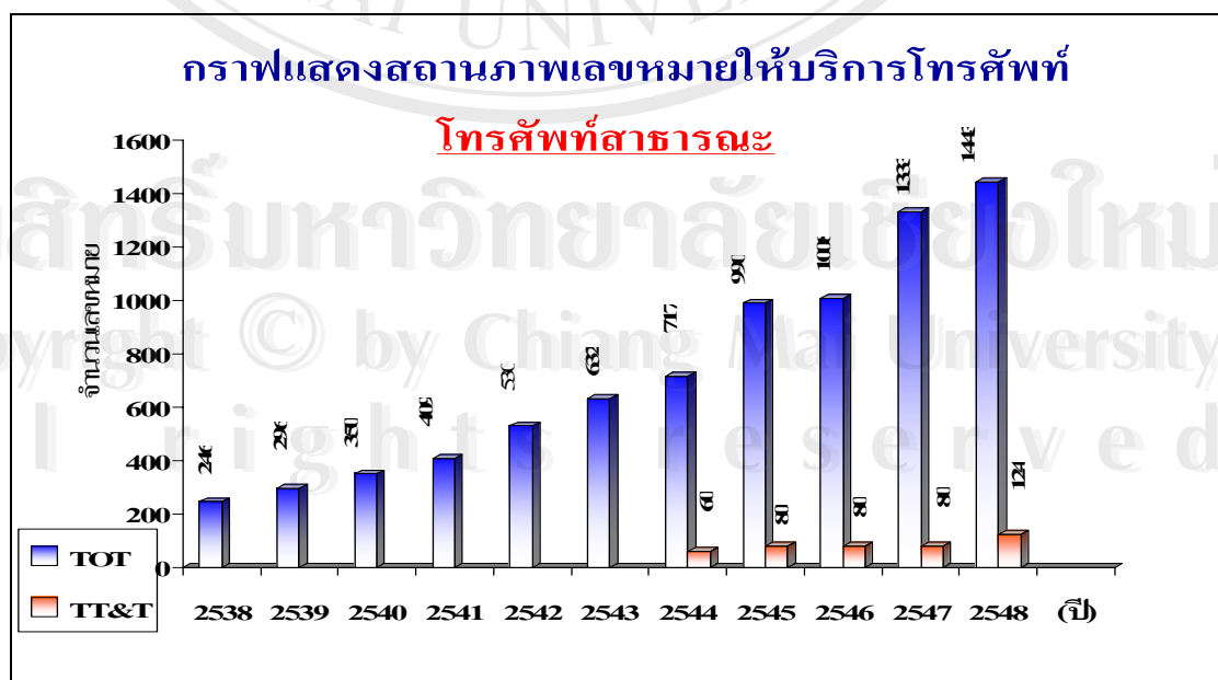
ภาพที่ 1.2 แสดงสถานภาพการให้บริการโทรศัพท์สาธารณะของ บมจ.ทีโอที และ บมจ.ทีทีแอนด์ที

จากภาพที่ 1.2 พบว่าการให้บริการโทรศัพท์สาธารณะในจังหวัดแพร่ บมจ.ทีโอที มีจำนวนเลขหมายให้บริการมากกว่า บมจ.ทีทีแอนด์ที ทั้งนี้เนื่องมาจาก บมจ.ทีโอที เป็นรัฐวิสาหกิจในสังกัดของรัฐบาลจำเป็นต้องดำเนินงานตามนโยบายรัฐบาลจึงมีการลงทุนให้บริการครอบคลุมทั้งจังหวัด ถึงแม้จะมีผลตอบแทนต่ำ ส่วน บมจ.ทีทีแอนด์ที เป็นบริษัทที่ดำเนินงานแบบธุรกิจจึงเลือกลงทุนเฉพาะจุดที่สามารถให้ผลตอบแทนสูงสุด