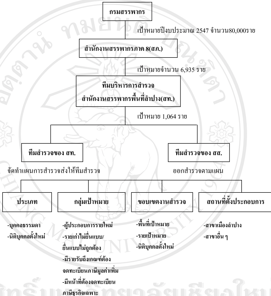
ภาพที่ 4.2 แสดงแผนผังลักษณะและโครงสร้างระบบงานสำรวจและติดตามธุรกิจนอกระบบภาษี ของสำนักงานสรรพากรพื้นที่ลำปาง

เมื่อทีมบริหารการสำรวจได้รับมอบหน้าที่รับผิดชอบให้ควบคุมการสำรวจและจัดทำแผนงานสำรวจกำหนดเป้าหมายแล้ว ส่งให้ทีมสำรวจของสำนักงานสรรพากรพื้นที่แต่ละพื้นที่สาขาออกสำรวจผู้ประกอบการ ผลการสำรวจผู้ประกอบการในปีงบประมาณ 2547 ปรากฏว่าการสำรวจและติดตามธุรกิจนอกระบบภาษีได้จำนวน 2,631 ราย ดังนั้น ผลการสำรวจและติดตามธุรกิจนอกระบบภาษีของสำนักงานสรรพากรพื้นที่ลำปาง ได้ผลเกินเป้าหมายจำนวน 1,567 ราย คิดเป็นร้อยละ 147.27 และนำผลการสำรวจของผู้ประกอบการ จำนวน 2,631 ราย มาจำแนกประเภทต่าง ๆ ดังมีรายละเอียดต่อไปนี้