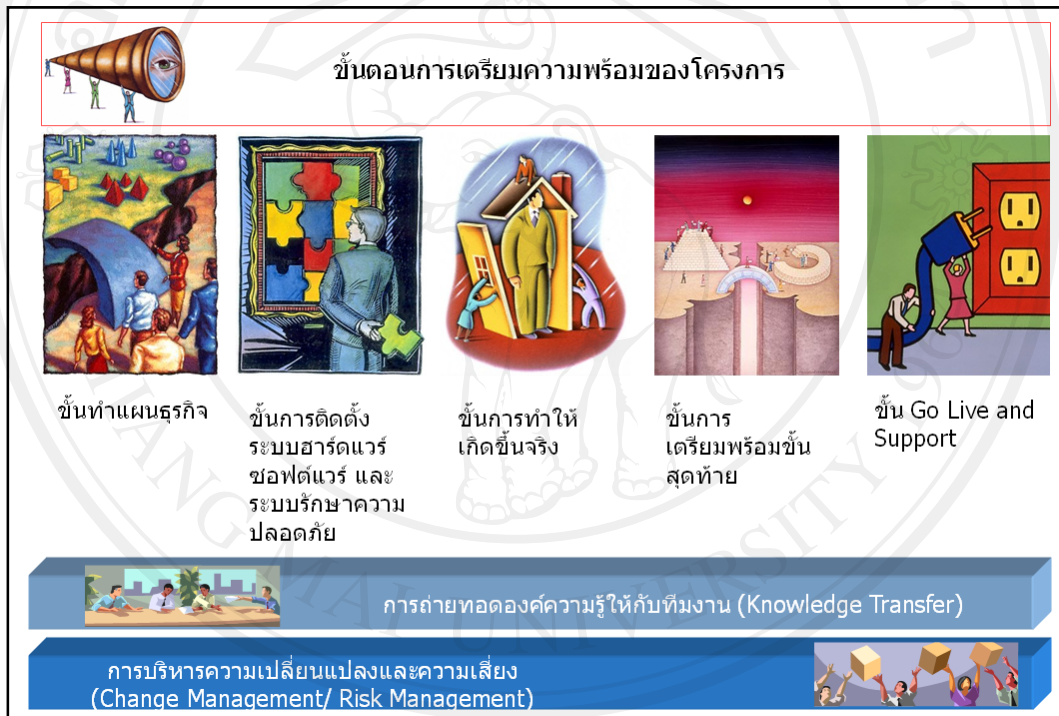
รูป 1.2 แผนการดำเนินงานตามแบบ Oracle Methodology

โดยจัดทำ Statement of work เพื่อเป็น input สำหรับ Project Management Process และ Software Implementation process execution แล้ว จะได้ผลลัพธ์คือ Software Configuration