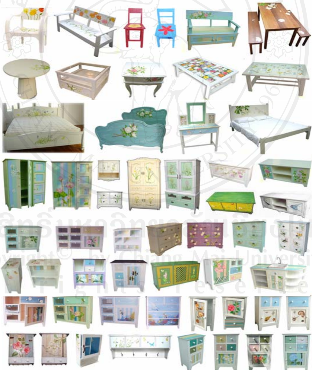
ตัวอย่างเฟอร์นิเจอร์ไม้ทาสี

เฟอร์นิเจอร์ไม้ทาสี หมายถึง เฟอร์นิเจอร์ที่ผลิตจากไม้จริง เช่น ไม้สน ไม้มะม่วง และ เฟอร์นิเจอร์ที่ผลิตจากไม้ที่ผ่านการแปรรูปเป็นไม้อัด โดยไม่รวมถึงเฟอร์นิเจอร์ที่ทำจากไม้สังเคราะห์ซึ่งผ่านกระบวนการทางเคมีหลายขั้นตอนแล้วจึงนำมาขึ้นรูปเป็นแผ่น เช่น MDF Board Particle Board เป็นเฟอร์นิเจอร์ที่สามารถนำไปใช้งานได้ทั้งภายในและภายนอกที่พักอาศัย สำนักงาน หรือร้านค้าต่าง ๆ เช่น ตู้ โต๊ะ เก้าอี้ เตียง ชุดรับแขก ชั้นวางของ โต๊ะเก้าอี้สนาม ชิงช้า โดยมีการทำสีหรือการวาดลวดลายแบบแฮนด์เมค (Handmade) ด้วยสีอะคริลิก เป็นส่วนประกอบ