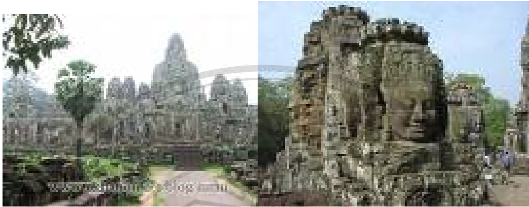
รูปที่ 5 ปราสาทบายน

จังหวัดเสียมราฐ หมายถึงจังหวัดหนึ่ง ตั้งอยู่ทางทิศเหนือของประเทศกัมพูชา ซึ่งเคยเป็นเมืองหลวงของประเทศกัมพูชาในอดีต และปัจจุบัน จังหวัดเสียมราฐมีฐานะเป็นจังหวัดที่มีความสำคัญยิ่งต่อเศรษฐกิจของประเทศ โดยเฉพาะในเรื่องการท่องเที่ยว ซึ่งเป็นที่ตั้งของมรดกโลก นครวัดนครธม แห่งเดียวของประเทศกัมพูชา