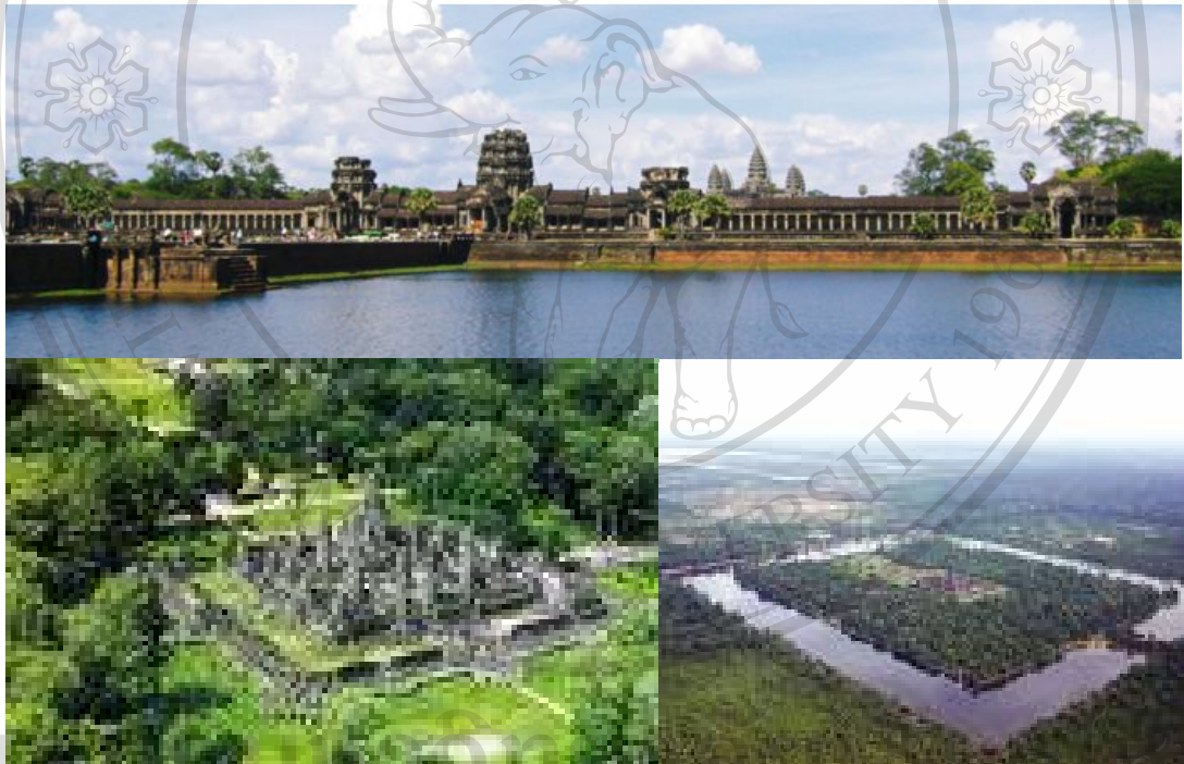
รูปที่ 1 นครวัดโดยรอบ

นครวัด หมายถึง ศาสนสถานและโบราณสถานซึ่งมีอายุกว่า 900 ปี และเป็นศูนย์กลางวัฒนธรรมที่สำคัญที่สุดในเอเชียอาคเนย์ในอดีต และเป็นอดีตเมืองหลวงของราชอาณาจักรกัมพูชา ทั้งนี้ยังเป็นสิ่งมหัศจรรย์อันดับ 7 ของโลก รวมทั้งยังได้จดทะเบียนเป็นมรดกของโลกในปี 2537 ซึ่งนับเป็นมรดกโลกแห่งแรกของอินโดจีน ซึ่งประกอบด้วยปราสาทหินและประสาทต่างๆ ถึง 72 แห่ง ตั้งอยู่ที่เมืองเสียมราฐ ในประเทศกัมพูชา สร้างในรัชสมัยของพระเจ้าสุริยวรมันที่ 2 ในพุทธศตวรรษที่ 16-17 เพื่อเป็นศาสนสถานประจำนครของพระองค์ เมื่อสมัยแรกนั้น นครวัดได้ถูกสร้างเป็นเทวสถานในศาสนาฮินดู ลัทธิไวษณพนิกาย แต่ต่อมาในสมัยของพระเจ้าชัยวรมันที่ 7 ได้เปลี่ยนให้เป็นวัดในศาสนาพุทธนิกายมหายาน ในปัจจุบันปราสาทนครวัดนับเป็นสิ่งก่อสร้างสัญลักษณ์ของประเทศกัมพูชา และได้รับลงทะเบียนเป็นมรดกโลกภายใต้ชื่อ เมืองพระนคร