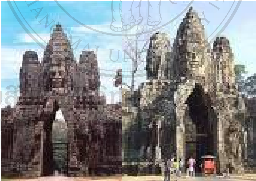
รูปที่ 4 นครธมด้านทิศใต้

นครธม เมืองหลวงแห่งสุดท้ายและเมืองที่เข้มแข็งที่สุดของอาณาจักรขะแมร์สถาปนาขึ้นในปลายคริสต์ศตวรรษที่ 12 โดยพระเจ้าชัยวรมันที่ 7 มีอาณาเขตครอบคลุมพื้นที่ 9 ตารางกิโลเมตร อยู่ทางทิศเหนือของ นครวัด ภายในเมืองมีสิ่งก่อสร้างมากมายนับแต่สมัยแรกๆ และที่สร้างโดยพระเจ้าชัยวรมันที่ 7 และรัชทายาท ใจกลางพระนครเป็นปราสาทหลักของพระเจ้าชัยวรมัน เรียกว่า ปราสาทบายน และมีพื้นที่สำคัญอื่นๆ รายล้อมพื้นที่ชัยภูมิถัดไปทางเหนือ