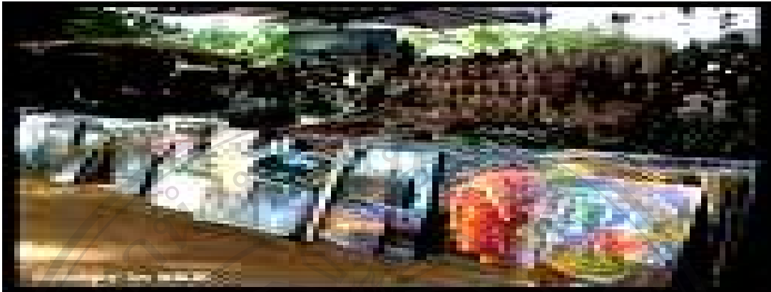
รูปที่ 3 ร้านขายของที่ระลึกหน้าปราสาทนครวัด

นครธม เมืองหลวงแห่งสุดท้ายและเมืองที่เข้มแข็งที่สุดของอาณาจักรขะแมร์สถาปนาขึ้นในปลายคริสต์ศตวรรษที่ 12 โดยพระเจ้าชัยวรมันที่ 7 มีอาณาเขตครอบคลุมพื้นที่ 9 ตารางกิโลเมตร อยู่ทางทิศเหนือของ นครวัด ภายในเมืองมีสิ่งก่อสร้างมากมายนับแต่สมัยแรกๆ และที่สร้างโดยพระเจ้าชัยวรมันที่ 7 และรัชทายาท ใจกลางพระนครเป็นปราสาทหลักของพระเจ้าชัยวรมัน เรียกว่า ปราสาทบายน และมีพื้นที่สำคัญอื่นๆ รายล้อมพื้นที่ชัยภูมิถัดไปทางเหนือ