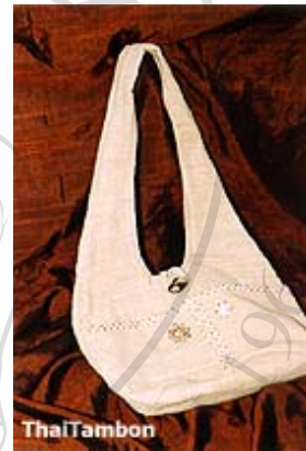
กระเป๋าสะพายกระดุมกะลา