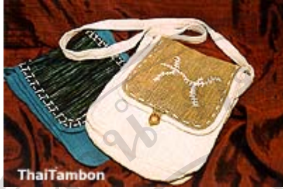
กระเป๋าปักผ้าฝ้าย