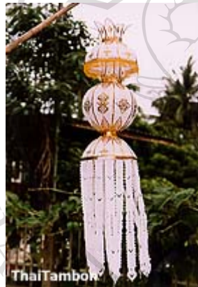
โคมร่มกระดาษสา