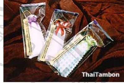
ถุงการบูร