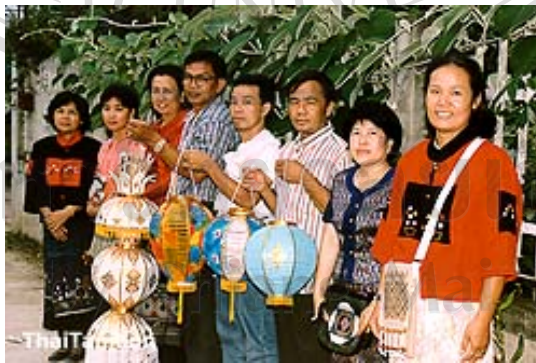
ภาพที่ 3 สมาชิกในกลุ่มผลิตตำบลท่าศาลา

6. ฝ่ายคลังสินค้า มีหน้าที่ รับและจ่ายวัตถุดิบเพื่อใช้ในกระบวนการผลิตและดูแลการเบิกผลิตภัณฑ์เพื่อจัดจำหน่ายและรับผลิตภัณฑ์ที่ผลิตเสร็จจากสมาชิกด้วย