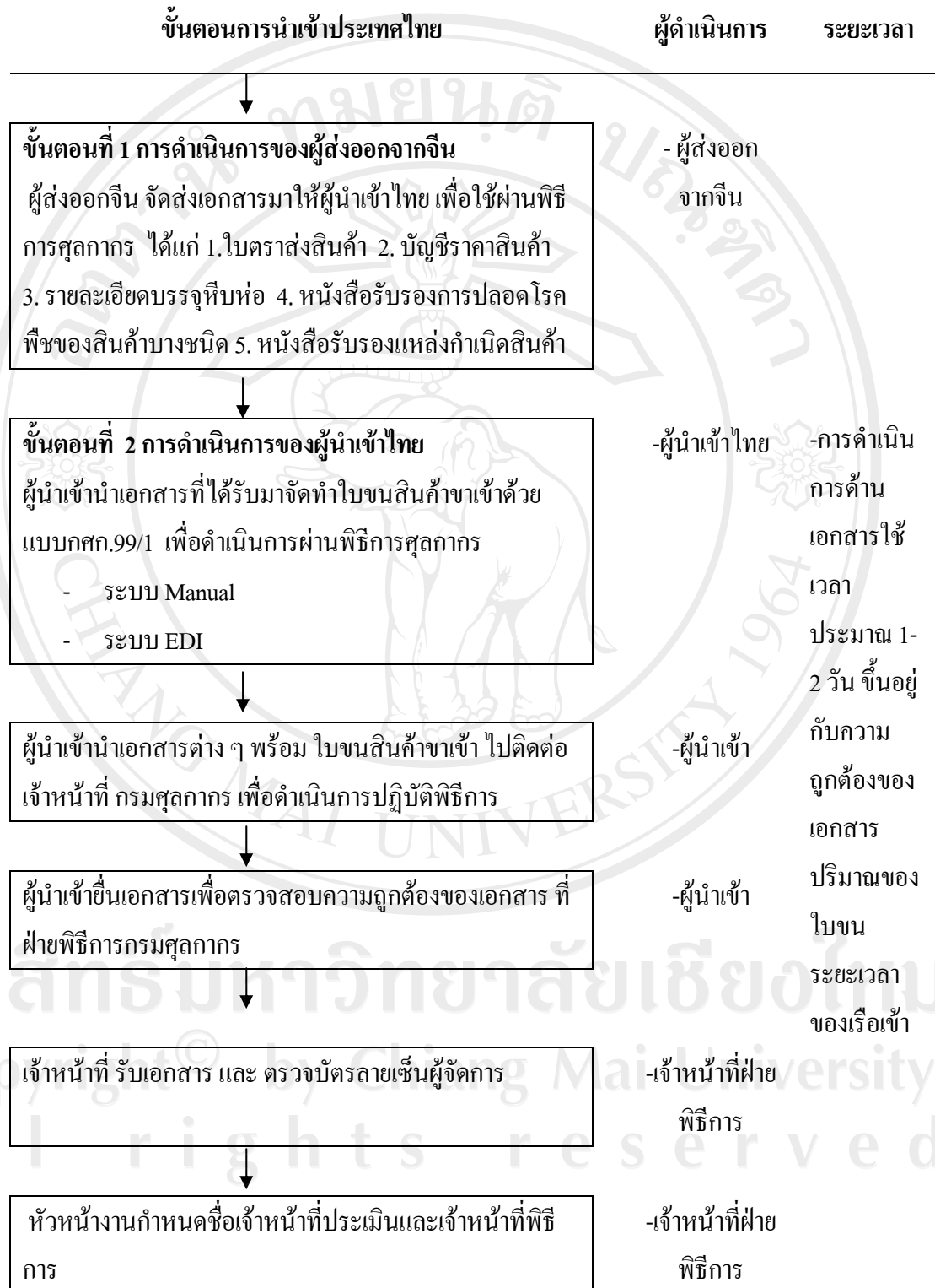
รูปที่ 3.1 แสดงขั้นตอนการนำเข้าสินค้าของประเทศไทย