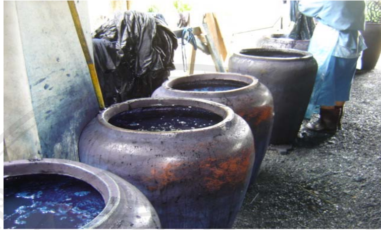
ภาพที่ 3-5 โอง่งสำหรับการย้อมเส้นไหมอ่อน