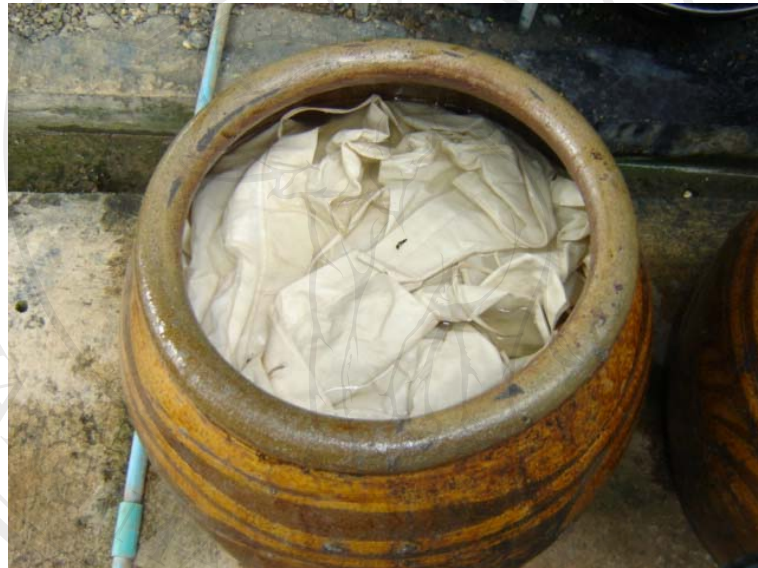
ภาพที่ 3-14 เสื้อผ้าดิบที่นำมาแช่น้ำสะอาด

ขั้นตอนที่ 2 ตัดเย็บผ้าดิบให้เป็นเสื้อหม้อห้อมตามแบบและขนาดที่ต้องการให้เรียบร้อย ก่อนนำไปย้อมเพราะจะทำให้ประหยัดเนื้อผ้า แต่ถ้านำผ้าดิบมาย้อมก่อนที่จะตัดเย็บจะทำให้ไม่สามารถคำนวณผ้าได้แน่นอนเมื่อนำไปตัดเย็บแล้วจะทำให้เหลือเศษผ้ามากและทำให้ได้ผลผลิตน้อยจึงต้องตัดเย็บก่อนที่จะนำไปย้อม จากนั้นจะได้เสื้อผ้าดิบสีขาวแล้วนำไปแช่น้ำสะอาดทิ้งไว้เป็นเวลา 1-2 คืน ดังแสดงในภาพที่ 3-14 เพื่อให้แป้งในเนื้อผ้าออกหมดและเนื้อผ้าดูดซึมน้ำได้ทั่วถึง แล้วนำผ้าขึ้นมาจากนั้นมาผึ่งให้หมาดพร้อมจะนำไปย้อม