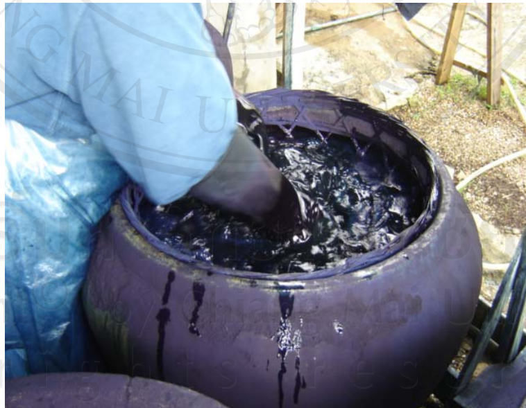
ภาพที่ 3-16 การข้อมเสื้อหม้อห้อม (การจกผ้า)

ขั้นตอนที่ 4 ช่างซ่อมจะสวมถุงมือยางกดผ้าลงในตะกร้าตาห่างให้สีซึมทั่วผ้าทั้งหมด เพื่อให้เนื้อผ้าดูดซับสีให้ได้มากที่สุด แล้วใช้มือขยำผ้าให้ติดสีซึมจนทั่วทั้งผืน ในขั้นตอนนี้ชาวแพร์เรียกว่า การจกผ้า (การข้อมผ้าหม้อห้อม) ดังแสดงในภาพที่ 3-16