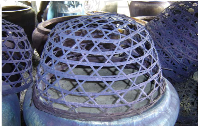
ภาพที่ 3 -8 ตะกร้าตาห่างสำหรับสวมปากโอ่ง

3. ตะกร้าตาห่าง เป็นตะกร้าทำจากไม้ไผ่ โดยสานห่างๆ ปากกว้างขนาดพอดีที่จะวางครอบปากโอ่ง ก้นสอบ ความสูงประมาณ 1-2 ฟุต ใช้สำหรับใส่ผ้าที่จะย้อมเพื่อไม่ให้จมลงก้นหม้อแล้วแช่ส่วนก้นของตะกร้าลงในสีย้อม ดังแสดงในภาพที่ 3-8