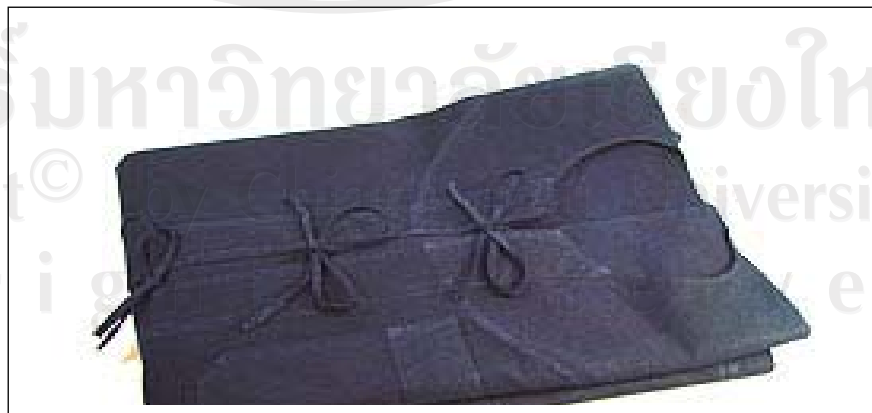
ภาพที่ 3-18 เสื้อหม้อห้อมพร้อมจำหน่าย

ถ้าหากต้องการให้รีดง่ายและจับจีบเรียบอยู่ตลอดเวลาเมื่อนำไปขายจะไม่ยับยู่ยี่ วิธีทำคือ ต้องลงแป้งโดยจะนำแป้งมันมาละลายน้ำและใส่ในหม้อต้มจนเดือดทิ้งไว้ให้พออุ่นจึงเอาผ้าที่ย้อมทุกขั้นตอนแล้วมาแช่ไว้สักครู่ ขย่ำน้ำให้ทั่วถึง นำไปตากจนแห้งสนิทแล้วนำมาพรมน้ำรีดให้เรียบ ดังแสดงในภาพที่ 3-18 แล้วนำไปขายสู่ตลาดทั้งการขายส่งและขายปลีก