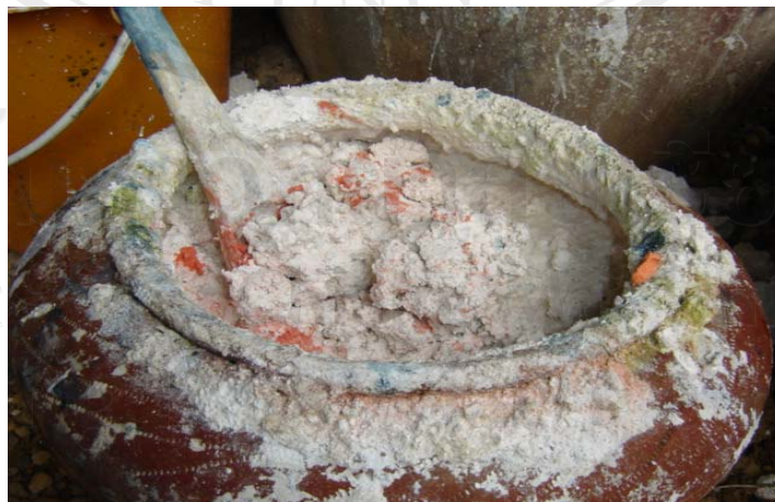
ภาพที่ 3-3 ปูนขาว

สีย้อมผ้าตามภาพที่ 3-2 ประกอบด้วย น้ำคราม ปูนขาวและน้ำค้างจากขี้เถ้า ดังแสดงในภาพที่ 3-3 และ 3-4 ตามลำดับ