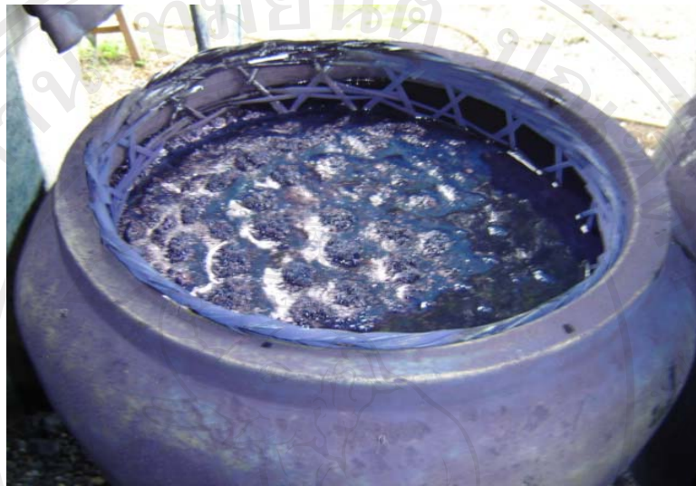
ภาพที่ 3-2 สีย้อมเส้นหม้อหอม

สีย้อมผ้าได้จากการหมักต้นและใบคราม หมักเป็นน้ำครามเพื่อสกัดให้ได้สี สำหรับย้อมผ้า ดังแสดงในภาพที่ 3-2