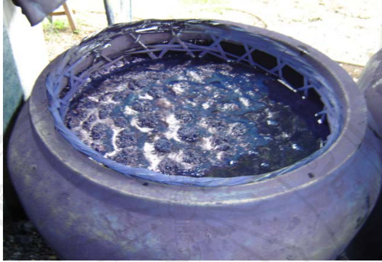
ภาพที่ 3-15 ตะกร้าตาห่างสวมปากโอ่ง

ขั้นตอนที่ 4 ช่างซ่อมจะสวมถุงมือยางกดผ้าลงในตะกร้าตาห่างให้สีซึมทั่วผ้าทั้งหมด เพื่อให้เนื้อผ้าดูดซับสีให้ได้มากที่สุด แล้วใช้มือขยำผ้าให้ติดสีซึมจนทั่วทั้งผืน ในขั้นตอนนี้ชาวแพร์เรียกว่า การจกผ้า (การข้อมผ้าหม้อห้อม) ดังแสดงในภาพที่ 3-16