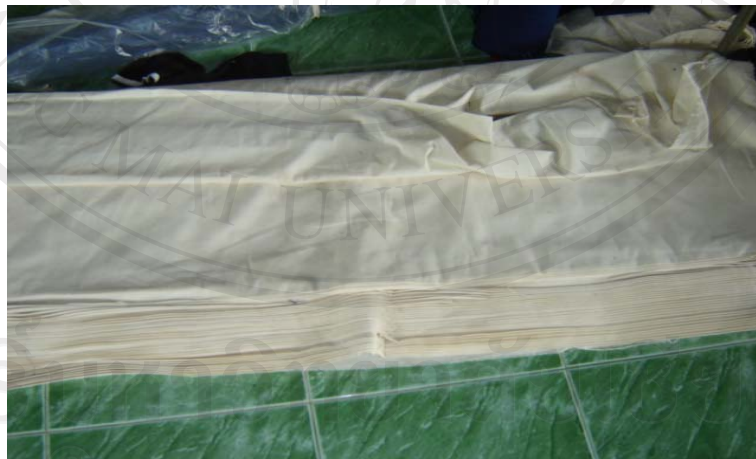
ภาพที่ 3-1 ภาพผ้าดิบที่จะนำมาตัดเย็บเป็นเสื้อ

1. ผ้าดิบ เป็นผ้าฝ้ายที่มีสีขาวหม่นๆ ส่วนใหญ่จะซื้อจากร้านค้าในจังหวัดหรือซื้อจากโรงงานนำมาตัดเย็บเป็นเสื้อตามแบบและขนาดที่ต้องการ ดังแสดงในภาพที่ 3-1