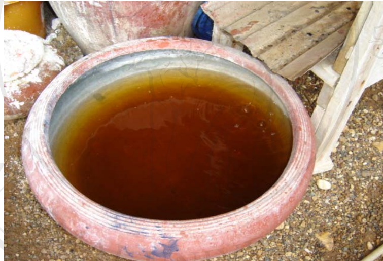
ภาพที่ 3-6 โอง่งใส่น้ำต่างจากจี้เต้า