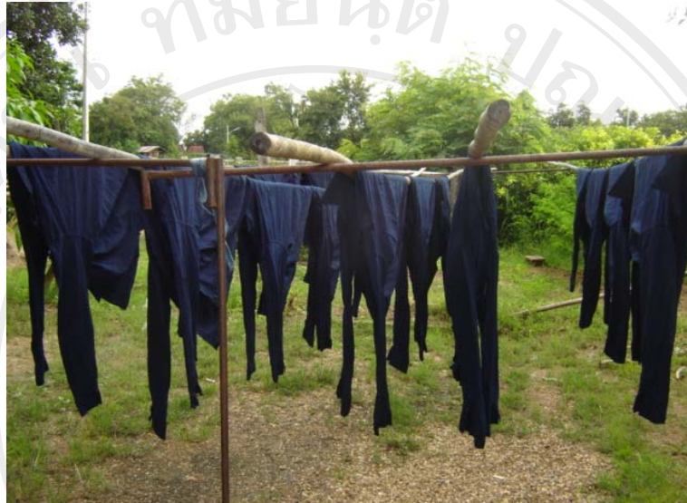
ภาพที่ 3-17 ผ้าที่ย้อมเสร็จตากให้แห้ง

ขั้นตอนที่ 5 นำผ้าที่ได้รับการขย่ำข้อมสีจนทั่วแล้วออกจากตะกร้าตาห่างนำไปฝั่งแดดที่ราวตากผ้าจนแห้ง ดังแสดงในภาพที่ 3-17 แล้วข้อมซ้ำตามขั้นตอนที่ 3 และขั้นตอนที่ 4 อีกจำนวน 5 ครั้ง เพื่อให้แน่ใจว่าสีครามที่ย้อมติดผ้าทั่วผืนและสีเสมอกันดีแล้ว การข้อมซ้ำหลายครั้งมีข้อดีคือทำให้สีที่ย้อมติดทนนาน