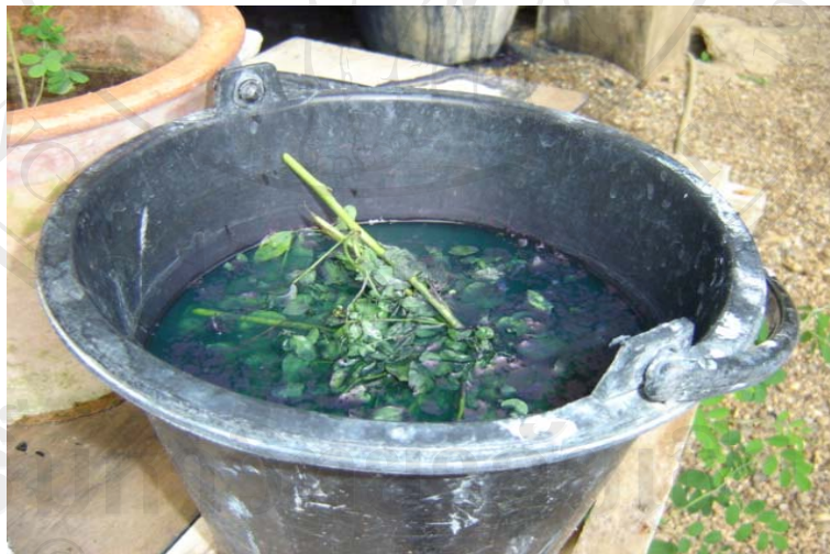
ภาพที่ 3-11 แสดงการแช่ต้นและใบคราม

2. นำใบหอมหรือใบครามมัดเป็นท่อนทั้งกิ่งและใบยาวประมาณ 8 นิ้ว แช่น้ำเปล่าทิ้งไว้ 2-3 คืน ใบครามเนา น้ำครามจะออกเป็นสีเขียว (ห้ามแช่น้ำเกิน 3 คืนเพราะน้ำต้นครามจะกลายเป็นสีขาว ใช้ไม่ได้) ดังแสดงในภาพที่ 3-11