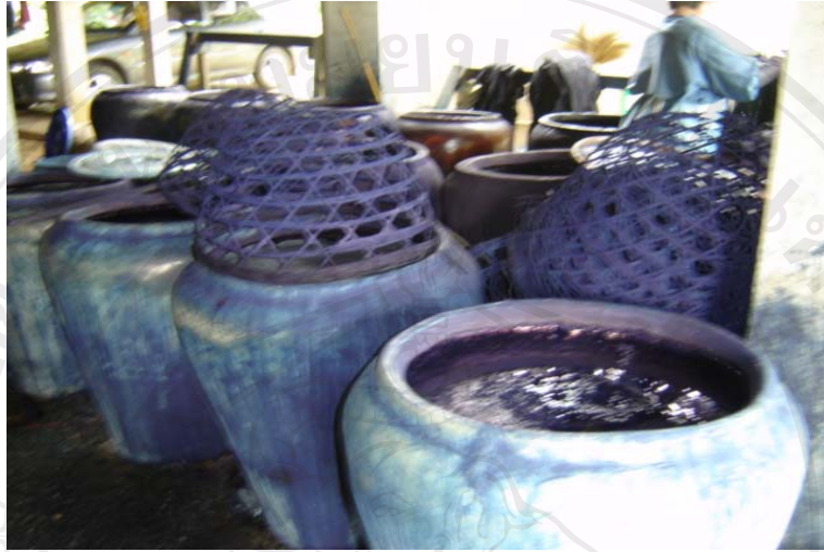
ภาพที่ 3-12 หัวเชื้อคราม

เป็นฟองสีน้ำตาลเงินเข้มและมีคราบเหนียว แล้วทิ้งไว้ให้ตกตะกอน ส่วนที่ตกตะกอนจะมีลักษณะเหนียวข้น เรียกว่าหัวเชื้อคราม ดังแสดงในภาพที่ 3-12