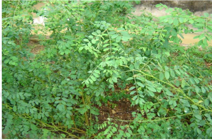
ภาพที่ 3-10 ต้นและใบคราม

2. นำใบหอมหรือใบครามมัดเป็นท่อนทั้งกิ่งและใบยาวประมาณ 8 นิ้ว แช่น้ำเปล่าทิ้งไว้ 2-3 คืน ใบครามเนา น้ำครามจะออกเป็นสีเขียว (ห้ามแช่น้ำเกิน 3 คืนเพราะน้ำต้นครามจะกลายเป็นสีขาว ใช้ไม่ได้) ดังแสดงในภาพที่ 3-11