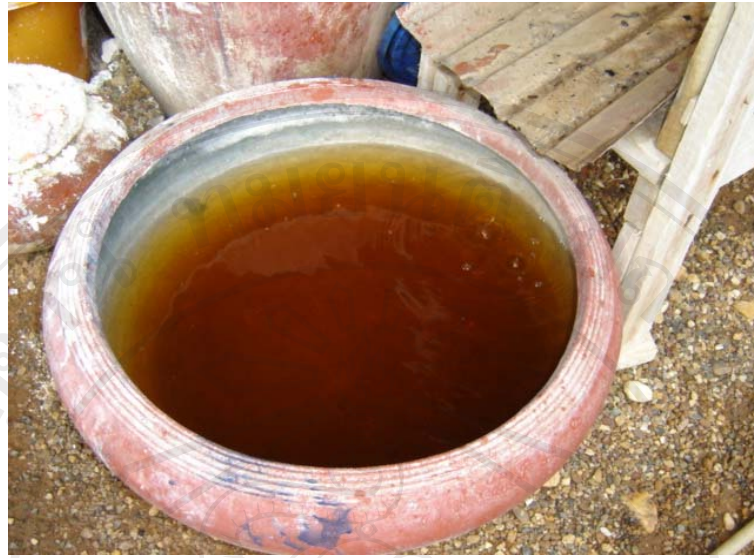
ภาพที่ 3-4 น้ำต่างจากขี้เถ้า

น้ำต่างจากขี้เถ้า ใช้เป็นตัวละลายสีที่ได้จากต้นคราม น้ำขี้เถ้าที่ได้จากการนำขี้เถ้าถ่านมาละลายน้ำคนให้ทั่วแล้วปล่อยให้แห้งไว้ให้ตกตะกอนจะได้น้ำต่างเป็นน้ำใสที่อยู่ตอนบน ซึ่งการทำน้ำต่างนั้นชาวบ้านจะทำโดยนำถังโดยด้านล่างถึงเจาะรูเล็กๆ เพื่อให้ น้ำสามารถไหลออกได้ แล้วใส่ขี้เถ้าลงไปจนถึงประมาณครึ่งถังจนเต็ม นำถังเปล่ามารองน้ำจากก้นถัง น้ำที่ได้จากการกรองขี้เถ้า คือน้ำต่าง