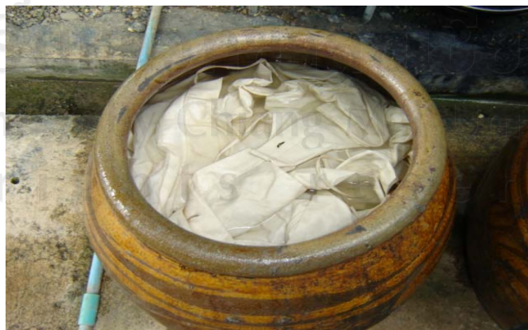
ภาพที่ 3-7 โอง่งแช่เส้นผ้าดิบเพื่อเตรียมย้อม