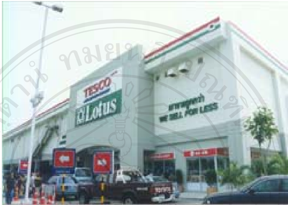
ภาพที่ 1 แสดงภาพร้านค้าปลีกขนาดใหญ่

ลิขสิทธิ์มหาวิทยาลัยเชียงใหม่ Copyright © by Chiang Mai University All rights reserved