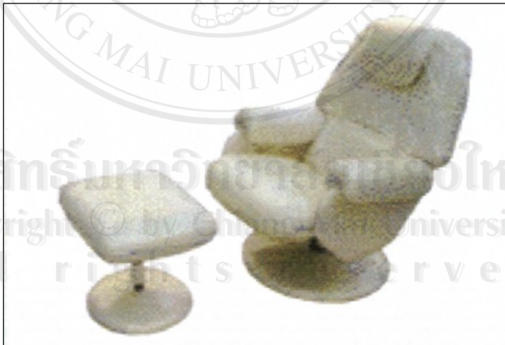
ภาพเตียงนอนเท้า