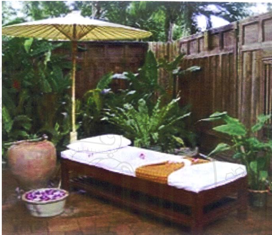
ภาพประกอบการตกแต่งธุรกิจสปา