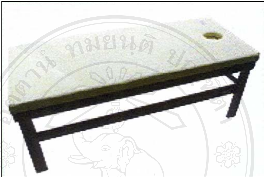
ภาพเตียงนอนน้ำมัน