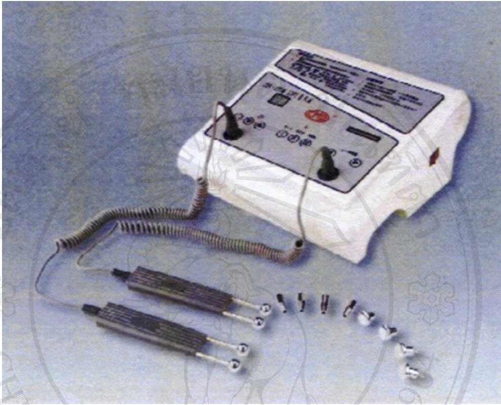
ภาพเครื่องฟลิตฟยกระชบผิว

ลิขสิทธิ์มหาวิทยาลัยเชียงใหม่ Copyright © by Chiang Mai University All rights reserved