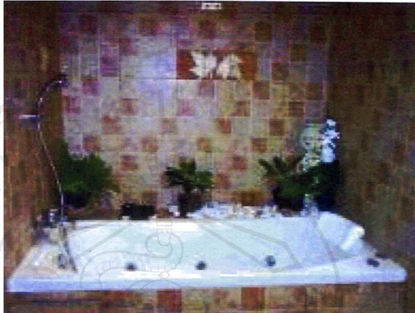
ภาพอ่างน้ำวน