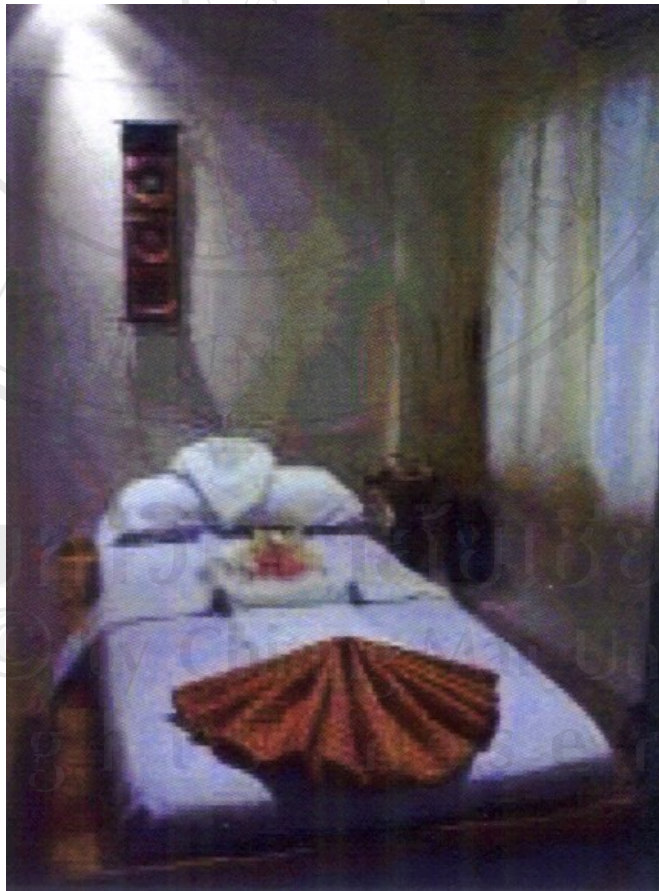
ภาพเตียงนอน