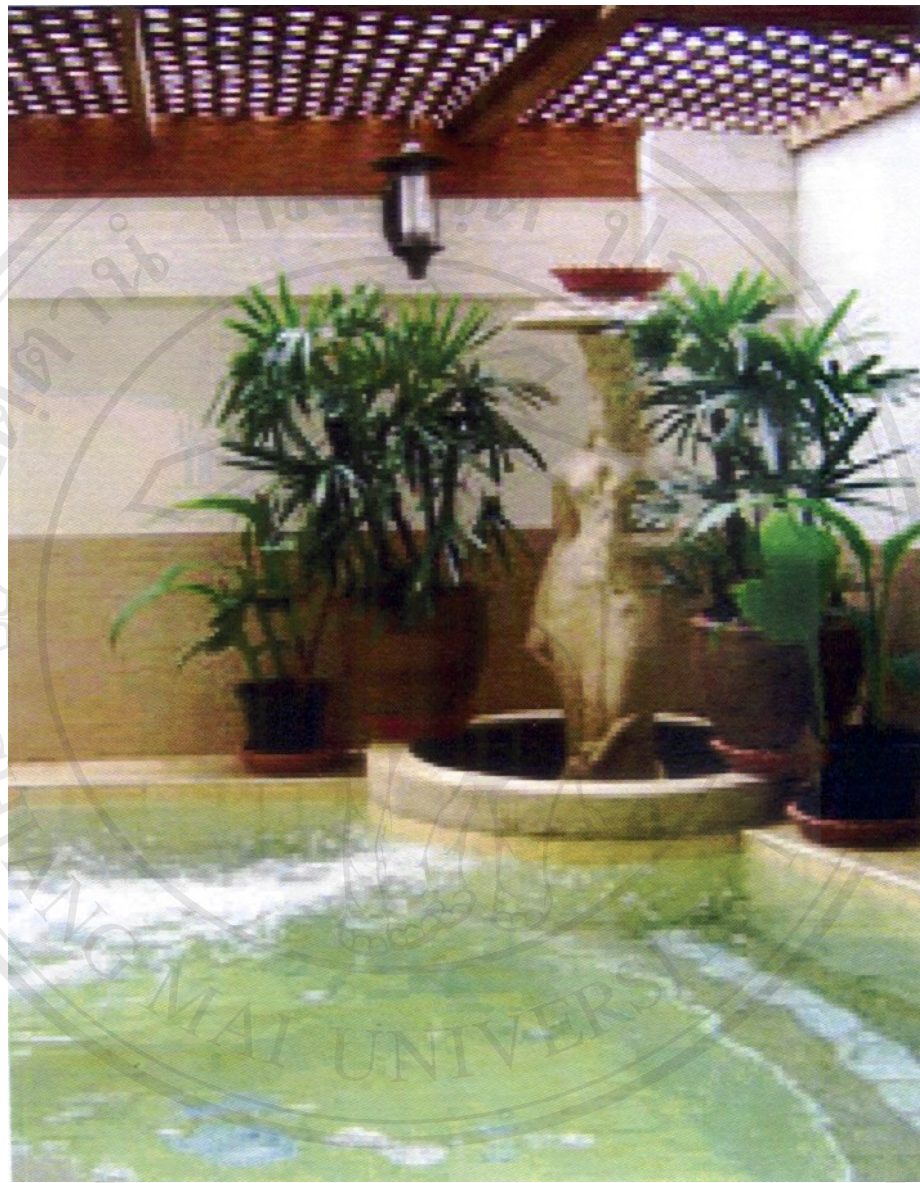
ภาพอ่างน้ำวน