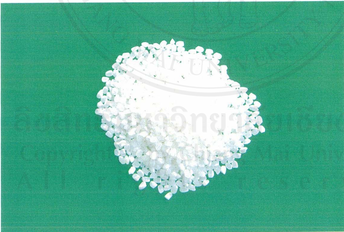
รูป ก.4 เมล็ดข้าวญี่ปุ่นพันธุ์ SA1(โคชสีการ)