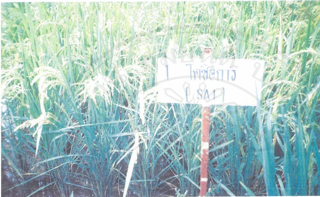
รูป ก.3 ต้นข้าวญี่ปุ่นพันธุ์ SA1(โคชสีการ)