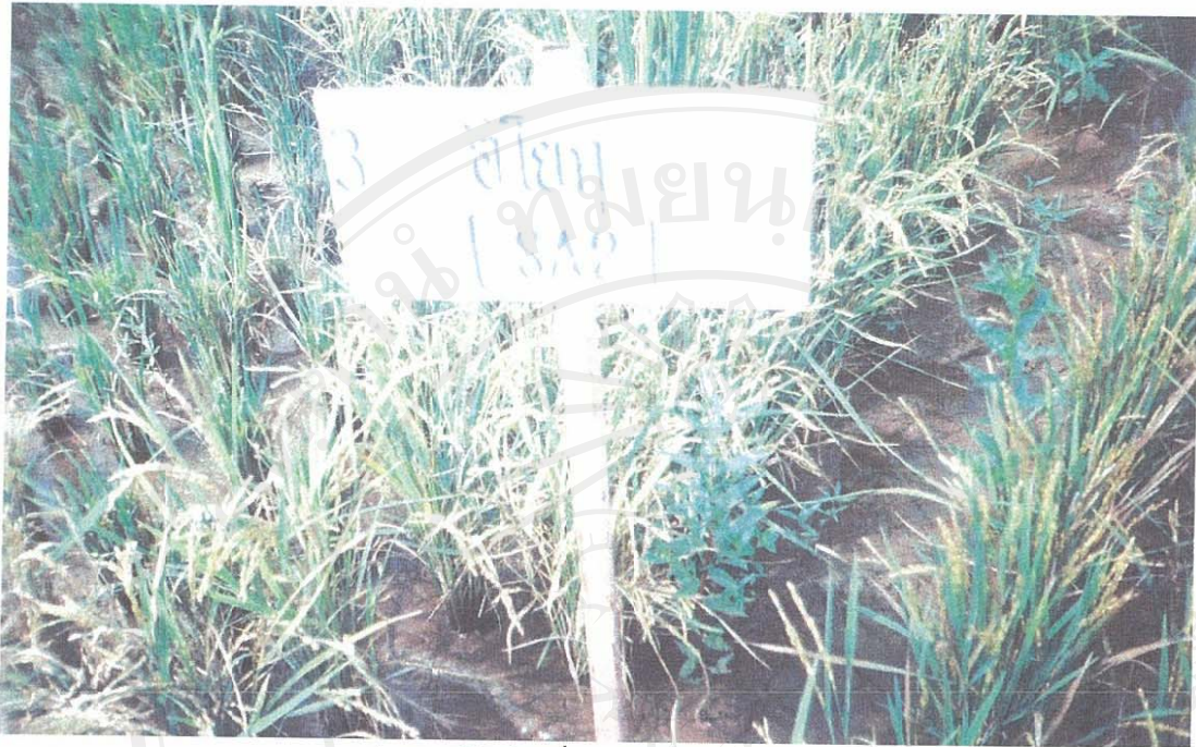
รูป ก.1 ต้นข้าวญี่ปุ่นพันธุ์ SA2(ชิโยกุ)