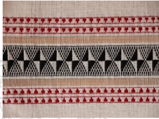
ภาพที่ 9 ผ้าทอไทลื้อลายดอกแหลมบิด