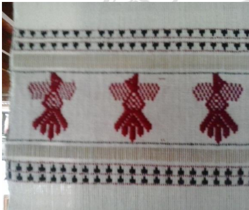
ภาพที่ 5 ผ้าทอไทลื้อลายนก