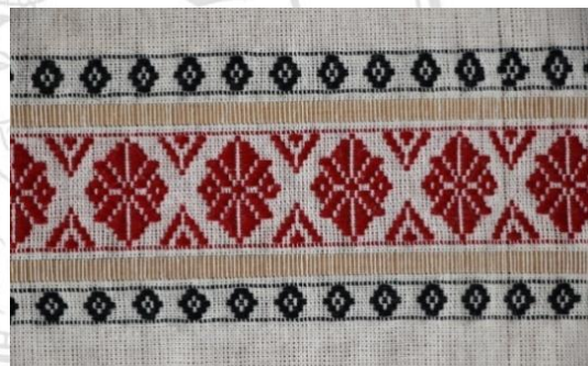
ภาพที่ 11 ผ้าทอไทลื้อลายดอกมะลิหลวง

1.3) ผ้าทอไทลื้อลวดลายจากอุปกรณ์เครื่องใช้ต่างๆ เช่น ลายกะแจ้ดำ (ภาษากลาง) ลายเก้งก้าง (หน้าไม้) เป็นต้น