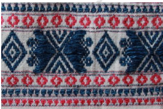
ภาพที่ 7 ผ้าทอไทลื้อลายผีเสื้อ

วิทยาลัยเชียงใหม่ Chiang Mai University reserved