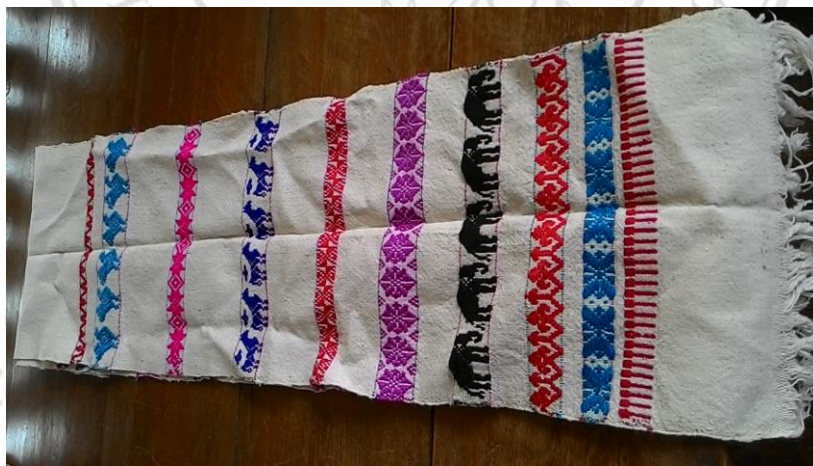
ภาพที่ 27 ผ้าโพกหัว