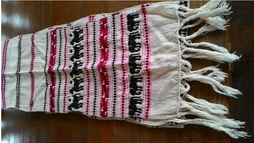
ภาพที่ 19 ผ้าโพกหัว