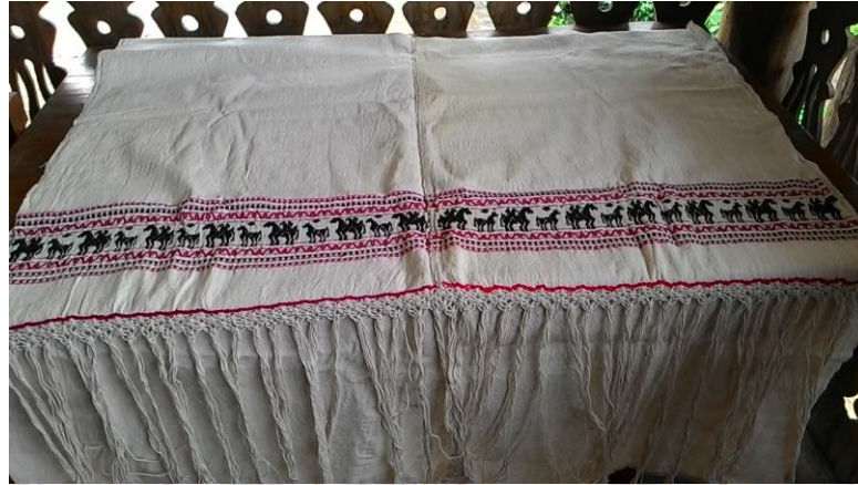
ภาพที่ 26 ผ้าปูโต๊ะลายม้าและไก่อของหลังม้า