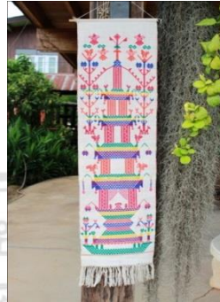
ภาพที่ 15 ผ้าทอไทลื้อลายรูปประสาท