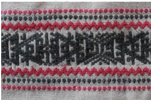
ภาพที่ 12 ผ้าทอไทลื้อลายกะแจ้ดำ

1.3) ผ้าทอไทลื้อลวดลายจากอุปกรณ์เครื่องใช้ต่างๆ เช่น ลายกะแจ้ดำ (ภาษากลาง) ลายเก้งก้าง (หน้าไม้) เป็นต้น