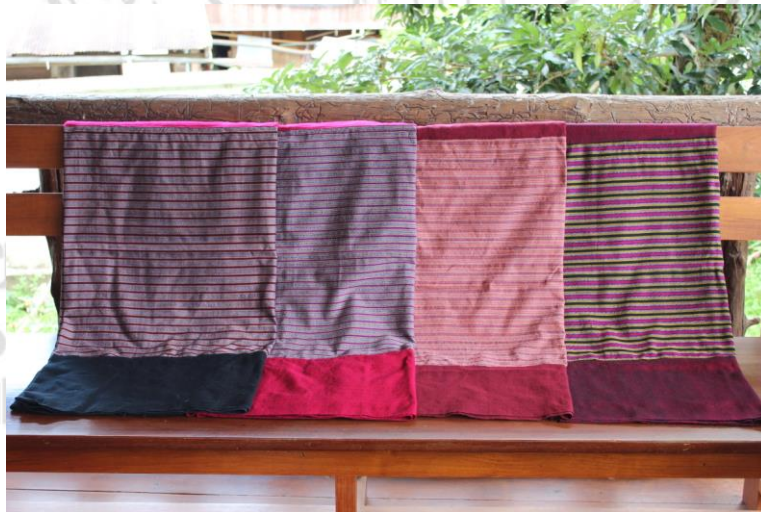
ภาพที่ 18 ผ้าซิ่น ผลผลิตของกลุ่มทอผ้าทอไทลื้อ บ้านแม่สาบ