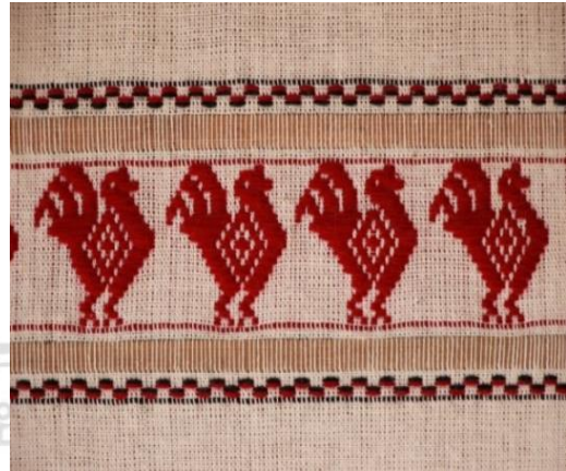
ภาพที่ 4 ผ้าทอไทลื้อลายไก่