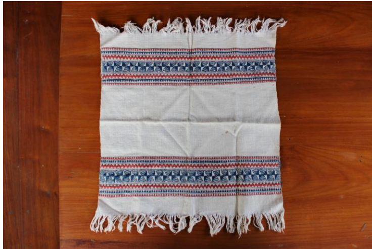
ภาพที่ 21 ผ้ารองจาน