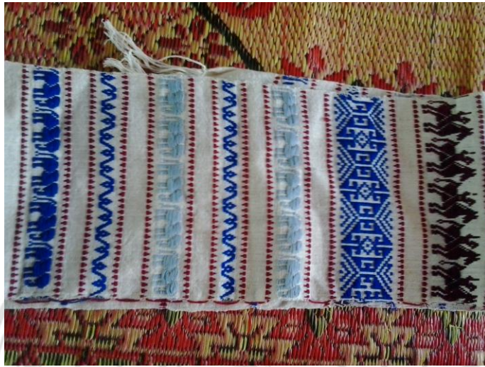
ภาพที่ 23 ผ้าคาดเอว