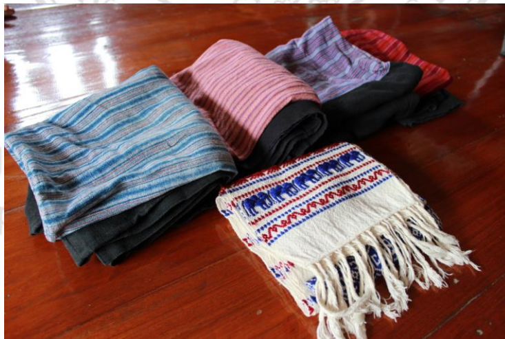
ภาพที่ 24 ผลผลิตของกลุ่มทอผ้าทอไทลื้อ บ้านแม่สาบ