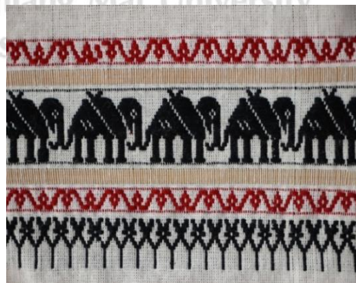
ภาพที่ 2 ผ้าทอไทลื้อลายช้าง