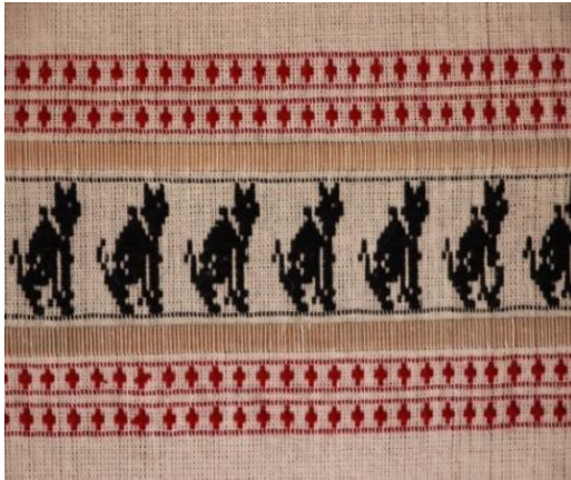
ภาพที่ 3 ผ้าทอไทลื้อลายแมว