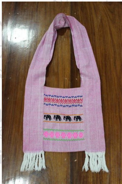
ภาพที่ 25 ถุงย่าม