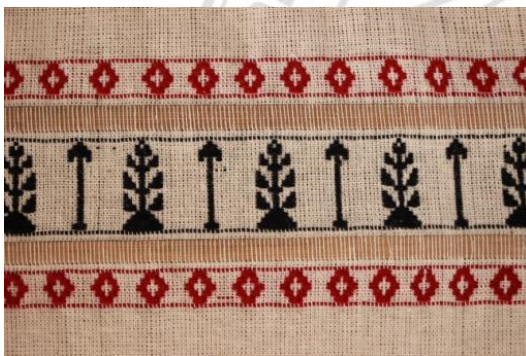
ภาพที่ 16 ผ้าทอไทลื้อลายจ้อ (จ้อ)