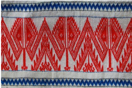
ภาพที่ 14 ผ้าทอไทลื้อลายหัวนาค

2) ลวดลายที่เกิดจากความเชื่อถือศรัทธาพระพุทธศาสนาขนบธรรมเนียมประเพณี เช่น ลายหัวนาค (หัวพญานาค) ลายปราสาท ลายจ้อ (จ้อ) เป็นต้น