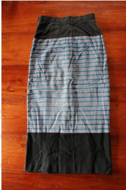
ภาพที่ 25 ผ้าซิ่น