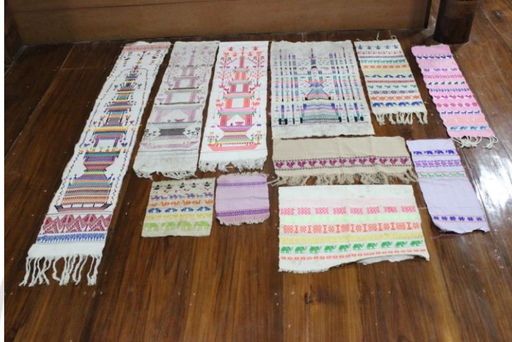
ภาพที่ 17 ตุ้ง ผลผลิตของกลุ่มทอผ้าทอไทลื้อ บ้านแม่สาบ