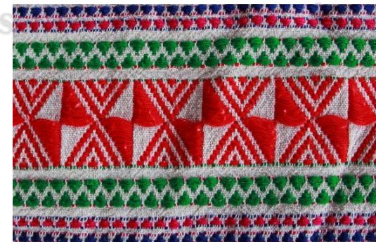
ภาพที่ 13 ผ้าทอไทลื้อลายเก้งก้าง (หน้าไม้)