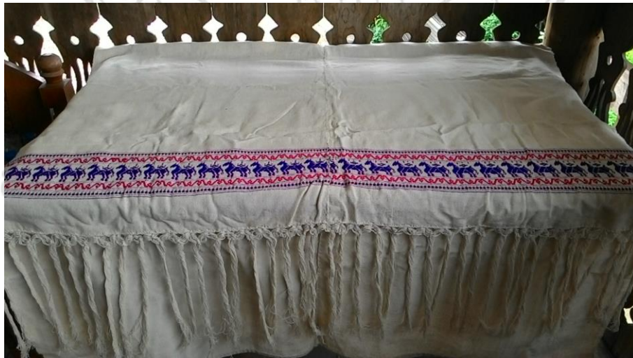
ภาพที่ 20 ผ้าปูโต๊ะลายม้า