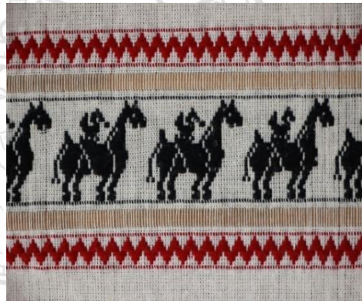
ภาพที่ 6 ผ้าทอไทลื้อลายไก่ของหลังม้า