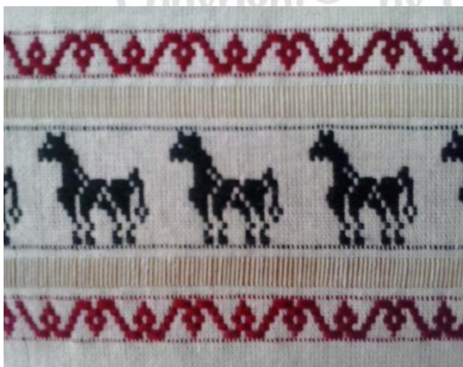
ภาพที่ 1 ผ้าทอไทลื้อลายม้า

1.1) ผ้าทอไทลื้อลายรูปสัตว์ต่างๆ เช่น ลายม้า ลายช้าง ลายแมว ลายไก่ ลายนก ลายผีเสื้อ เป็นต้น