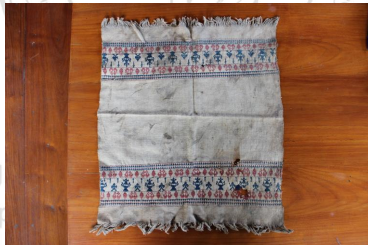
ภาพที่ 22 ผ้ารองจาน