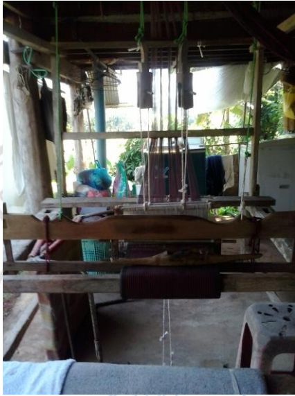
ภาพที่ 28 กี่ทอผ้า