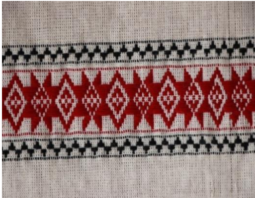
ภาพที่ 8 ผ้าทอไทลื้อลายดอกควักแป้

1.2) ผ้าทอไทลื้อลายดอกไม้ เช่น ลายดอกควักแป้ ลายดอกแหลมบิด ลายดอกเงาะ ลายดอกมะลิหลวง เป็นต้น