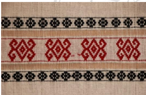
ภาพที่ 10 ผ้าทอไทลื้อลายดอกเงาะ