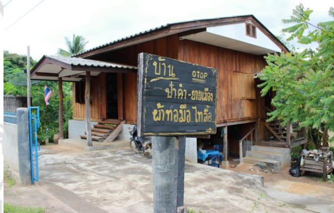
ภาพที่ 33 บ้านนางเมือง พิมสารี ประธานกลุ่มทอผ้า