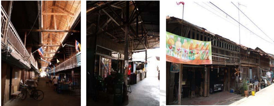
ภาพที่ 4.6 ตลาดบน ตลาดกลาง และตลาดล่าง