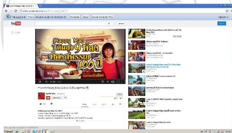
ภาพที่ 4.13 รายการสารคดีทางโทรทัศน์ที่เข้ามาถ่ายทำในชุมชนโบราณตลาดแก้มือ

อีกทั้งยังมีรายการสารคดีต่างๆ ที่ได้ให้ความสนใจและช่วยเป็นสื่อประชาสัมพันธ์ให้กับชุมชนตลาดโบราณแก้มืออีกด้วย โดยการนำเสนอในรูปแบบของบันเทิงกึ่งวิชาการที่ทำให้เข้าใจง่าย ได้รับทั้งความบันเทิงและความรู้ไปพร้อมๆ กัน ทำให้ผู้คนรู้จักชุมชนตลาดโบราณแก้มือมากขึ้น ความโดดเด่นในเรื่องของสถาปัตยกรรมที่เป็นเอกลักษณ์ และอาหารคาวหวานอันขึ้นชื่อของตลาดแก้มือส่งผลให้นักท่องเที่ยวที่ชื่นชอบในการท่องเที่ยวเชิงอนุรักษ์เข้ามาเยี่ยมชมชุมชนโบราณตลาดแก้มือกันมากขึ้น และจากที่ได้ลงพื้นที่สำรวจพูดคุยกับผู้คนในชุมชนพบว่านักท่องเที่ยวที่เข้ามาเยี่ยมชมส่วนใหญ่พูดเป็นเสียงเดียวกันว่า ตลาดแก้มือไม่ได้เพียงแต่ถ่ายรูปกับภูมิทัศน์ทางวัฒนธรรมที่สวยงาม การได้ลิ้มรสอาหารคาวหวานที่อร่อย และเป็นสูตรต้นตำหรับก็ยังได้ความรู้และได้เรียนรู้แหล่งมรดกทางศิลปะและวัฒนธรรมได้เป็นอย่างดี จึงไม่ได้ให้แต่ความสนุกสนานความบันเทิงเท่านั้น ความรู้และประวัติศาสตร์มรดกทางศิลปะและวัฒนธรรมก็ทำให้นักท่องเที่ยวที่เข้ามาเยี่ยมชมเหล่านั้นประทับใจในสิ่งที่ได้รับอยู่ไม่น้อย