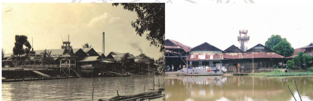
ภาพที่ 4.3 ตลาดเก่าห้องเมื่อครั้งอดีตและปัจจุบันมุมมองจากฝั่งวัดลานคา

ชุมชนตลาดโบราณเก่าห้องมีจำนวนประชากร ชาย 243 คน หญิง 258 คน รวม 501 คน จำนวนครัวเรือนทั้งหมด 181 ครัวเรือน และมีคณะกรรมการชุมชน 9 คน 6 ส่วนใหญ่ประกอบอาชีพทำนา บางส่วนทำไร่ และค้าขายกับชาวจีน