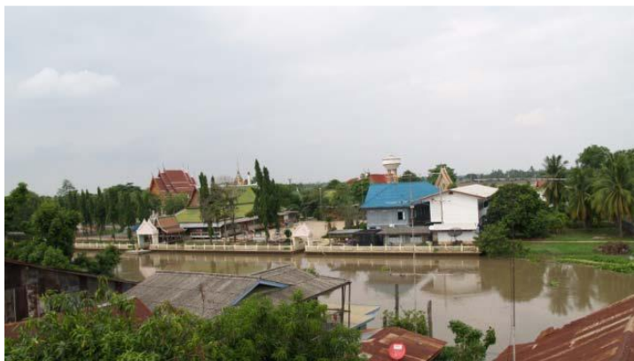
ภาพที่ 4.8 วัดลานคา