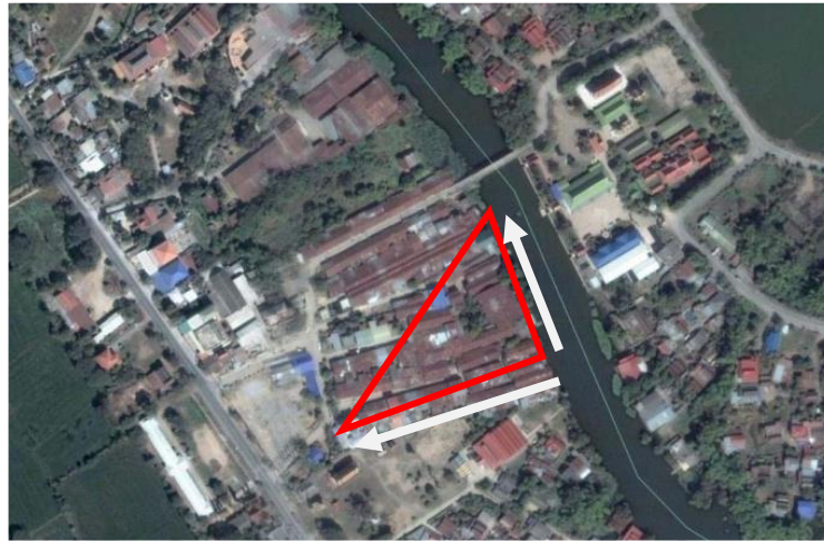
ภาพที่ 4.2 การตั้งฉากของบ้านเรือนและอาคารภายในชุมชนกับแม่น้ำ

ในพื้นที่ของส่วนนี้ เช่น อาคารตลาดสดใหม่ สถานีดับเพลิง ห้องสมุดประชาชน ศาลเจ้าและสำนักงานเทศบาลบางปลาหมอ 5