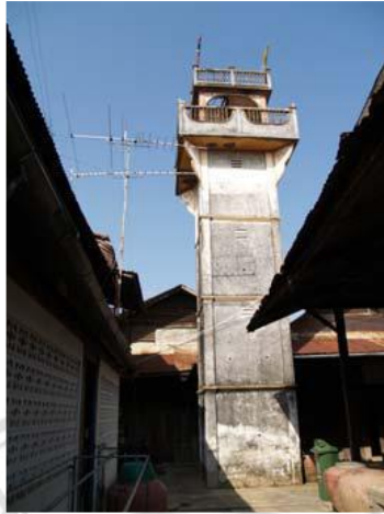
ภาพที่ 4.7 หอดูโจร