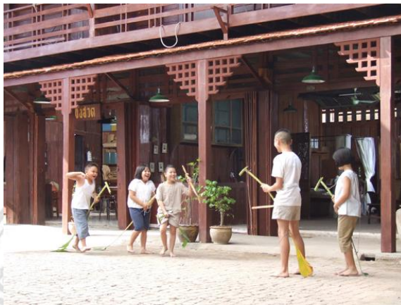
ภาพที่ 4.11 การใช้สถานที่ในการถ่ายทำละคร

มาตั้งแต่สมัยบรรพบุรุษไว้ให้คงอยู่และช่วยกันรักษาสถิงเหล่านี้ก็จะเป็นแหล่งเรียนรู้ทางศิลปะและวัฒนธรรมที่ดีแก่คนรุ่นหลังให้ได้ทราบว่สถานที่เหล่านี้ไม่ได้เป็นเพียงอาคารไม้เก่าๆ แต่เนื้เป็นการเล่าขานประวัติศาสตร์ผ่านสิ่งก่อสร้างที่มีค่ามากเกินกว่าจะประเมินค่าได้