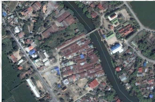
ภาพที่ 4.1 ที่ตั้งชุมชนตลาดโบราณเก้าห้อง อ.บางปลาหมอ จ.สุพรรณบุรี

2322 ชาวลาวจากเวียงจันทน์ได้พากันอพยพหลบหนีพม่าไปยังที่ต่างๆ บางพวกอพยพไปไกลถึงเมืองสุพรรณ และแยกไปเป็นกลุ่มตามๆ ในจำนวนนั้นมีกลุ่มหนึ่ง นำโดยขุนกำแหงฤทธิ์ ซึ่งเป็นผู้มีความสามารถ เป็นที่นับถือของชาวลาว และได้รับพระราชทานบรรดาศักดิ์ให้เป็นนายกองส่วย ทำหน้าที่เก็บอากรเข้ากรุงเทพฯ และเป็น “กำนัน” หัวหน้าหมู่บ้านคอยดูแลทุกข์สุขของชาวบ้าน ตัดสินคดีความ และช่วยเหลือชาวบ้านให้ร่มเย็น ได้อพยพมาทางบางปลาหมอ และเล็งเห็นทำเลที่ตั้งของบริเวณดังกล่าวว่าเป็นทำเลที่ดี จึงได้ช่วยกันปักหลักตั้งถิ่นฐานสร้างบ้านเรือนจนมั่นคงขึ้น ขุนกำแหงฤทธิ์จึงได้สร้างบ้านขึ้น แต่ต่อมาถูกไฟไหม้เสียหาย จึงได้สร้างบ้านใหม่ดังกล่าว มีจำนวนเก้าห้อง และมีศาลเจ้าอยู่ภายในบริเวณเดียวกันด้วย ตั้งแต่นั้นมาผู้คนที่อาศัยอยู่ในบริเวณดังกล่าวก็อยู่อย่างร่มเย็นเป็นสุขตลอดมา 3