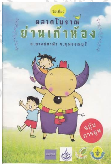
ภาพที่ 4.10 หนังสือการ์ตูนตลาดโบราณย่านเก่าห้อง