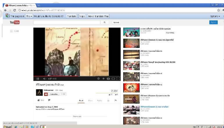
ภาพที่ 4.14 รายการสารคดีทางโทรทัศน์ที่เข้ามาถ่ายทำในชุมชนโบราณตลาดแก้มือ