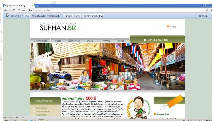
ภาพที่ 4.12 เว็บไซต์ต่างๆ ที่แนะนำชุมชนตลาดโบราณเก้าห้องและให้ความรู้ทางประวัติศาสตร์ของชุมชนและความเป็นมาของชุมชน

นอกจากนั้นแล้ว ยังมีเว็บไซต์และบล็อกเกอร์ชื่อดังได้ให้ความสนใจกับมรดกทางศิลปะและวัฒนธรรมมีคุณค่ายิ่งในชุมชนตลาดโบราณเก้าห้องแห่งนี้เป็นจำนวนมากทั้งการแนะนำสถานที่ที่ควรไปเยี่ยมชม การแนะนำตลาดโบราณที่น่าสนใจต่างๆ ในประเทศตลาดเก้าห้องก็ยังคงมีรายชื่ออันดับต้นๆ ในรายการนั้น นอกจากนี้ในเรื่องของตลาดโบราณแล้ววิถีชีวิตของคนในชุมชน มีปัญญาของปราชญ์ชุมชน และภูมิทัศน์ทางวัฒนธรรมที่เป็นเอกลักษณ์ของชุมชนตลาดโบราณเก้าห้องก็ยังเป็นที่สนใจและได้มีผู้คนเข้ามาเยี่ยมชมทั้งในรูปแบบของการเข้ามาเยี่ยมชมและเข้ามาศึกษาดูงานเพื่อนำไปประยุกต์ใช้กับชุมชนของตน