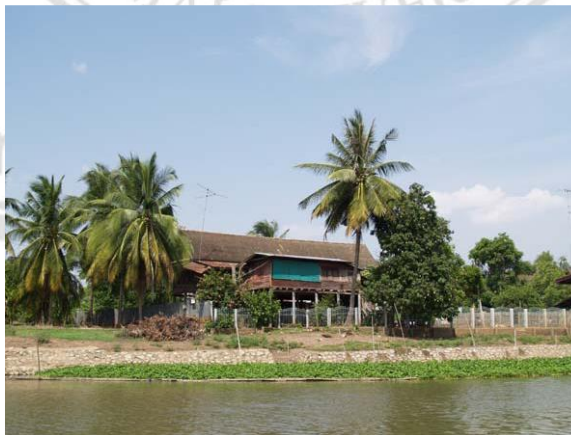
ภาพที่ 4.5 บ้านเก้าห้องมุมมองจากฝั่งตลาดเก้าห้อง