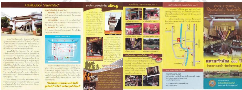
ภาพที่ 4.9 แผ่นพับประชาสัมพันธ์ตลาดเก่าห้อง

12.2 การจัดพิมพ์หนังสือ “เที่ยวตลาดโบราณบ้านเก่าห้อง