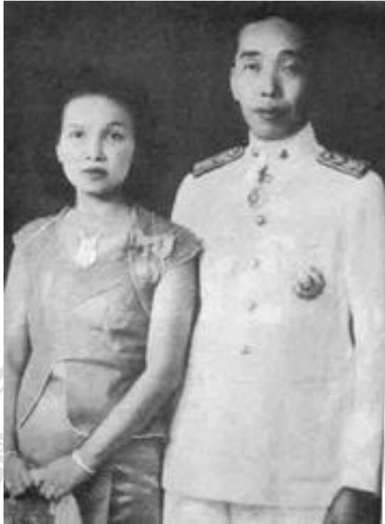
ภาพที่ 2.1 เจ้าฟ้าพรหมลือ และเจ้าหญิงทิพวรรณ ณ เชียงตุง