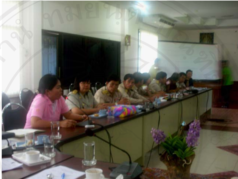
ผู้ศึกษาอธิบายภาพรวมของโครงการก่อสร้างระบบขนส่งด้วยสายพาน เชียงใหม่-แม่ฮ่องสอน ณ ห้องประชุมองค์การบริหารส่วนตำบลจี้เหล็ก