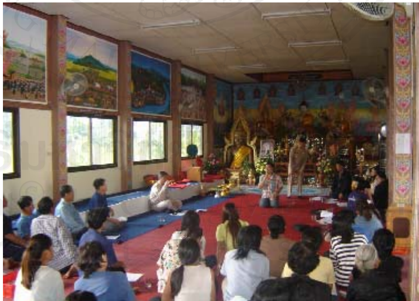
การประชุมกลุ่มย่อยภายในวัดมอญคั่นก บ้านดงป่าล้าน