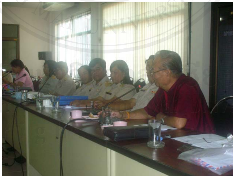
ที่ประชุมร่วมแสดงความคิดเห็นเกี่ยวกับผลกระทบทางสังคม