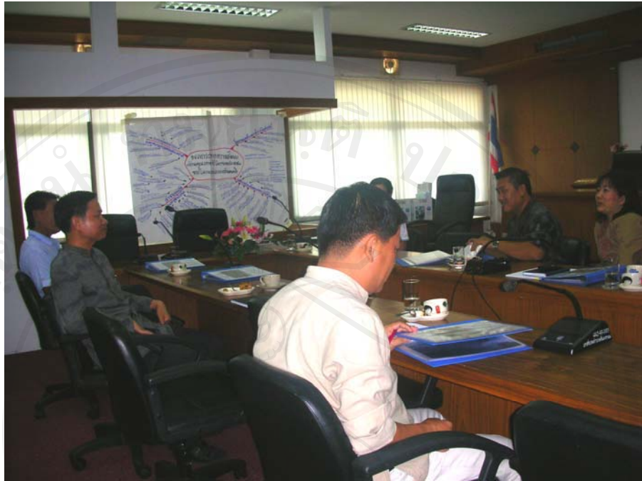
การประชุม ณ ห้องประชุมเทศบาลตำบลสันมหาพนร่วมกันแสดงความคิดเห็น และหาแนวทางป้องกันเพื่อลดผลกระทบทางสังคมในพื้นที่บ้านแม่มาลัย