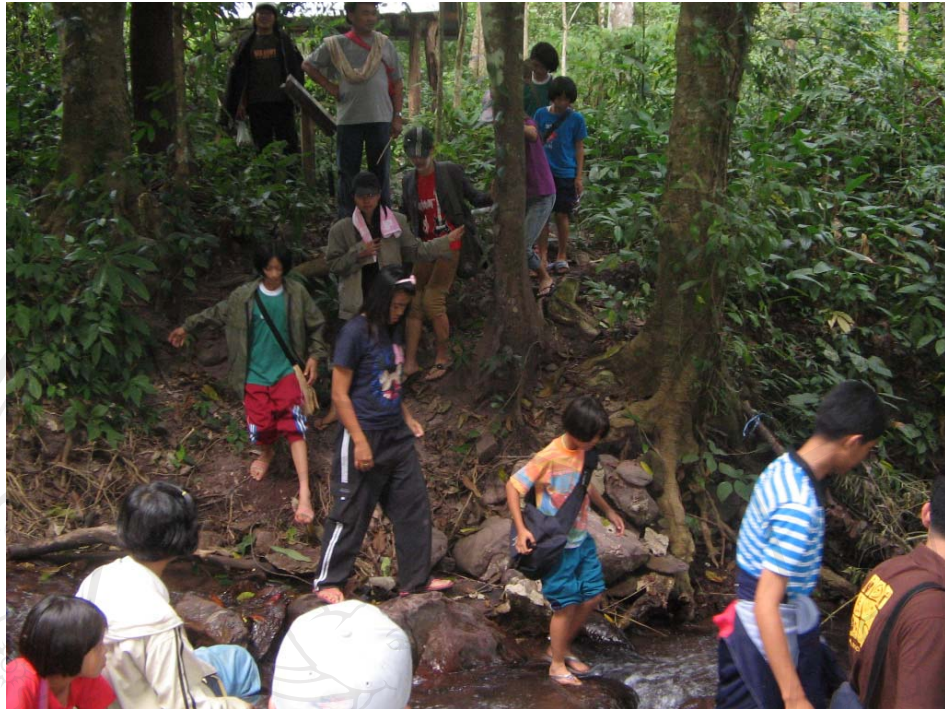
ภาพที่ 2 การเข้าค่ายสิ่งแวดล้อมและศึกษาทรัพยากรธรรมชาติและสิ่งแวดล้อมภายในชุมชน