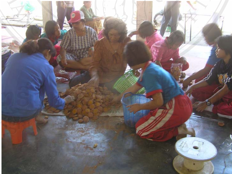
ภาพที่ 3 การเข้าร่วมกิจกรรมภายในชุมชน