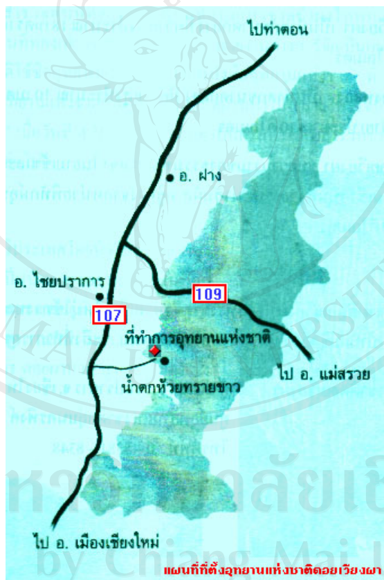
ภาพที่ 4.2 แผนที่สังเขปแสดงที่ตั้งอุทยานแห่งชาติคอยเวียงผา