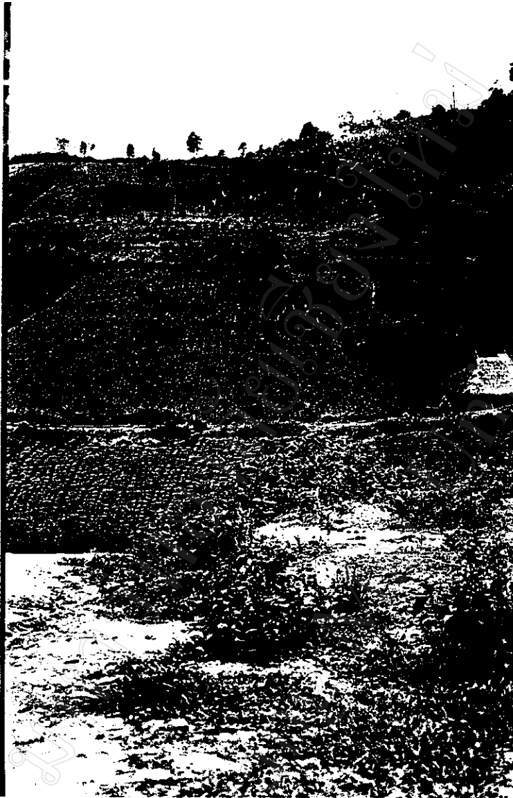
ลักษณะพื้นที่ทำการเกษตรของชาวบ้าน