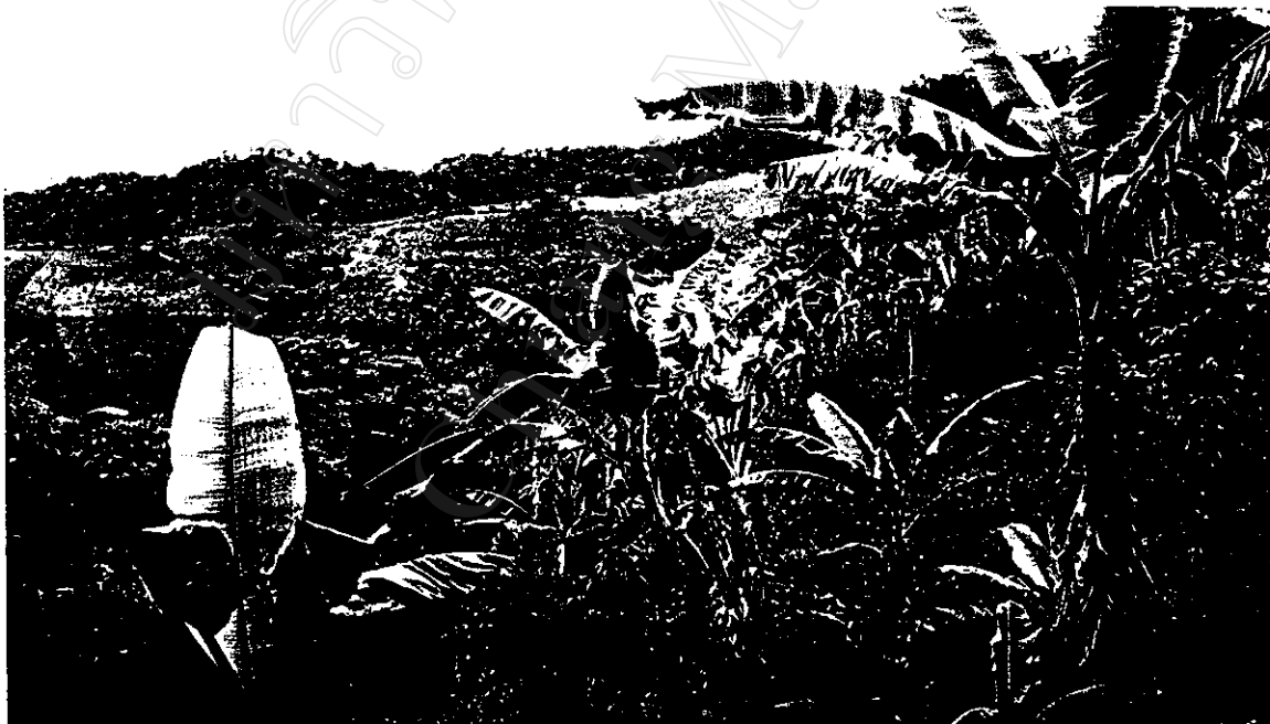
ลักษณะทั่วไปของหมู่บ้าน