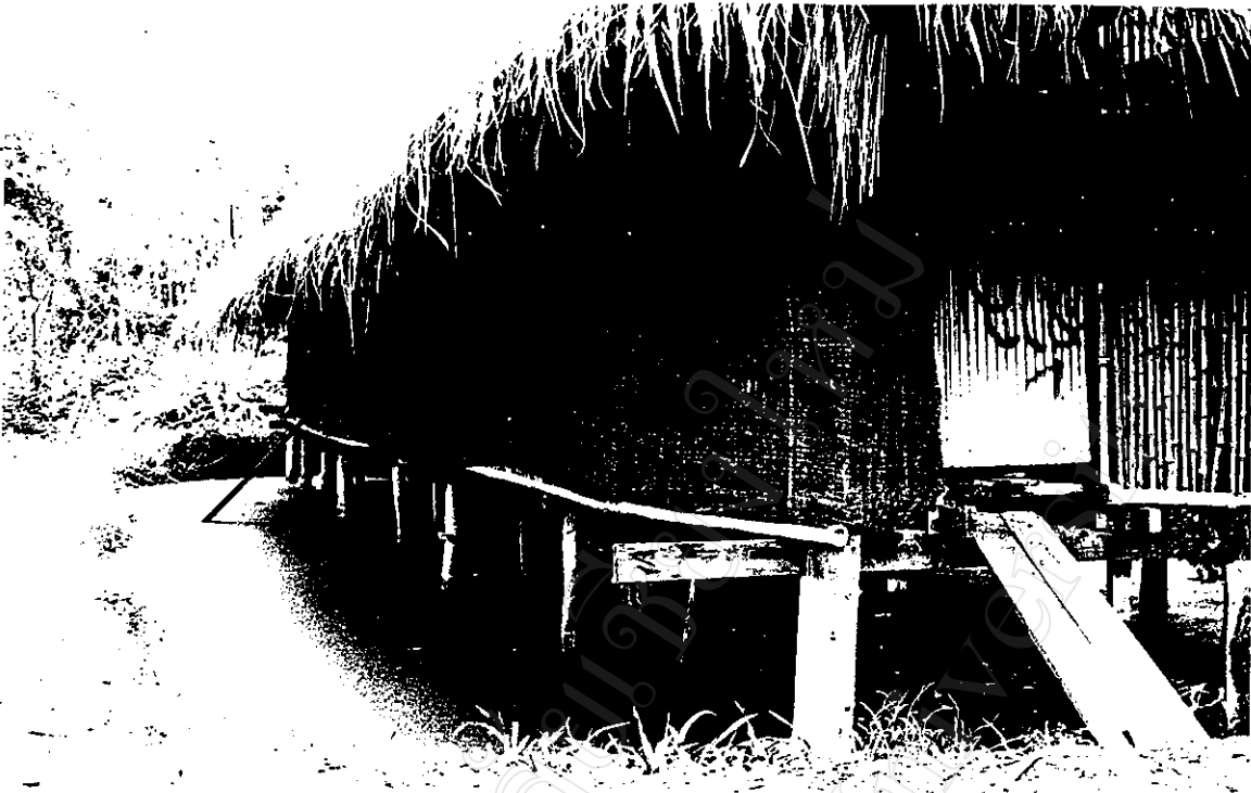
โรงเลี้ยงไก่ไข่บนบ่อปลาของโครงการฯ