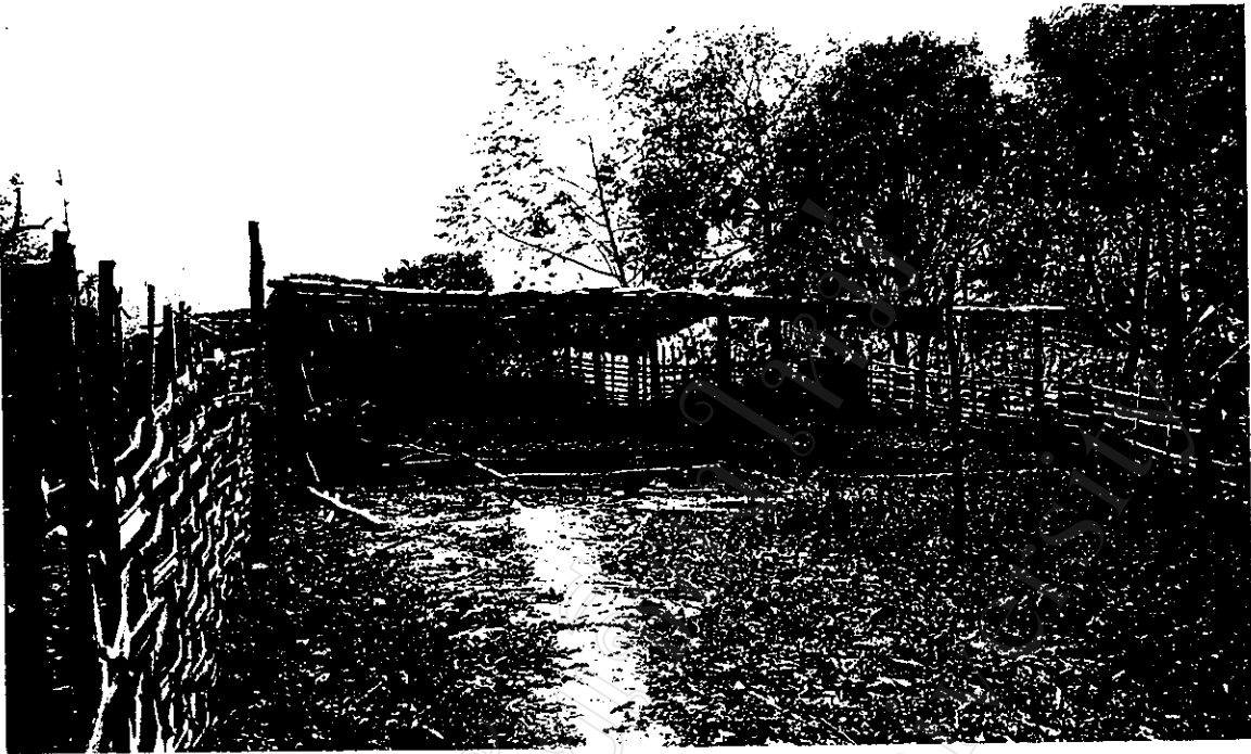
เรือนเพาะชำของชาวบ้าน