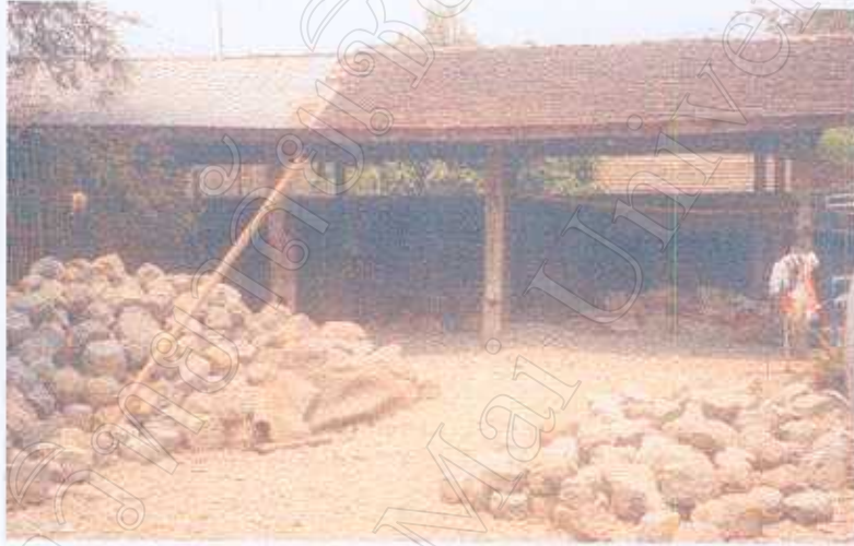
ภาพที่ 8 ทรัพยากรหิน ที่นำมาผลิตครก

ว่า ชุมชนกำลังอยู่ในช่วงของการพัฒนาเพื่อความทันสมัยและกำลังอยู่ใ้ระบบตลาดชุมชนจึงจำเป็นต้องจัดทำระบบการผลิตที่เอื้อต่อการอนุรักษ์ทรัพยากรธรรมชาติและสิ่งแวดล้อมกำหนดพื้นที่ของแปลงทรัพยากรธรรมชาติ แล้วให้ชุมชนมีการจัดสรรพื้นที่ ที่มีอยู่อย่างจำกัดเป็นส่วนๆ อดุสาหกรรมการในครัวเรือนขยายเป็น นำมาเอา ทรัพยากรหินจากแหล่งอื่นมาเสริมทรัพยากรธรรมชาติและสิ่งแวดล้อมของชุมชนลดลงซึ่งชุมชนกำลังเป็นเป้าหมายการพัฒนา ให้เข้าไปสู่การเปลี่ยนแปลง ดังจะเห็นได้ว่าวัฒนธรรมกับทรัพยากรสิ่งแวดล้อมเป็นสิ่งที่สามารถนำมาใช้ควบคู่กันไปได้ เพราะวัฒนธรรมนี้ให้คุณค่าแก่ความเป็นชุมชนที่สามารถผสมผสานกลมกลืน ซึ่งจะเห็นได้ว่าปัจจัยที่สำคัญอย่างยิ่งในการกำหนดและควบคุมระบบการผลิตของชุมชนคือระบบการที่พึ่งพาอาศัยธรรมชาตินั้นเอง