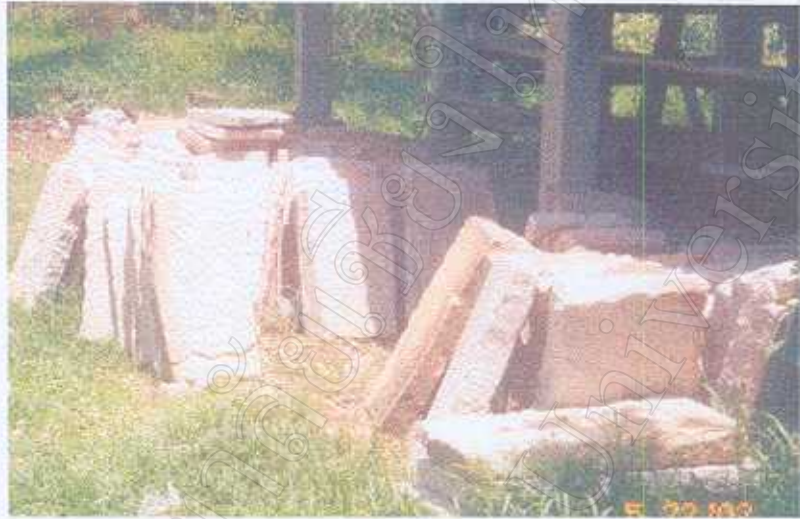
ภาพที่ 10 ทรัพยากรหินที่นำมาผลิตไหมเสมา

จะเห็นได้ว่า สภาพแวดล้อม ที่เอื้อต่อการผลิตเป็นปัจจัยหนึ่งที่สามารถทำให้ชุมชนสร้างรายได้เพราะถึงแวดล้อมอำนวยต่อการผลิต จะสามารถสร้างงานให้ชุมชน แต่ทรัพยากร ตามสภาพตามธรรมชาติเหล่านั้น ย่อมเสื่อมสลายไปตามเวลา การใช้ประโยชน์ได้ยาวนานแค่ไหนนั้นก็ย่อมขึ้นอยู่กับชุมชนนั้น ๆ ว่าจะรู้จักรักษาและรู้จักทรัพยากรธรรมชาติเหล่านั้น