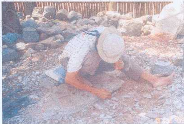
ภาพที่ 11 ทรัพยากรที่นำมาผลิตครกหิน,ไหมเสมา