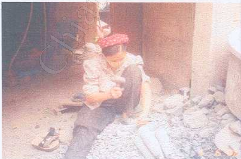
ภาพที่ 9 วิธีการทำครกหิน