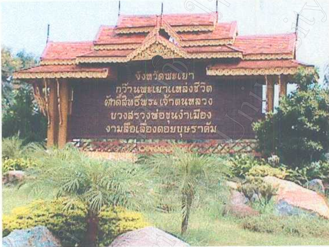
ถ้ำวิทยุประจำจังหวัดพะเยา