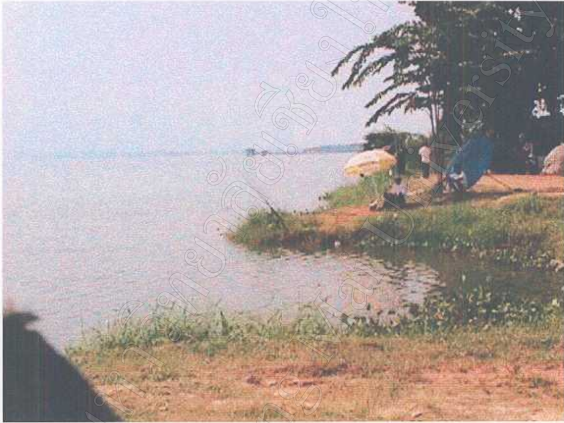
กิจกรรมการพักผ่อนหย่อนใจโดยการตกปลาในถ้ำน้ำทะเล