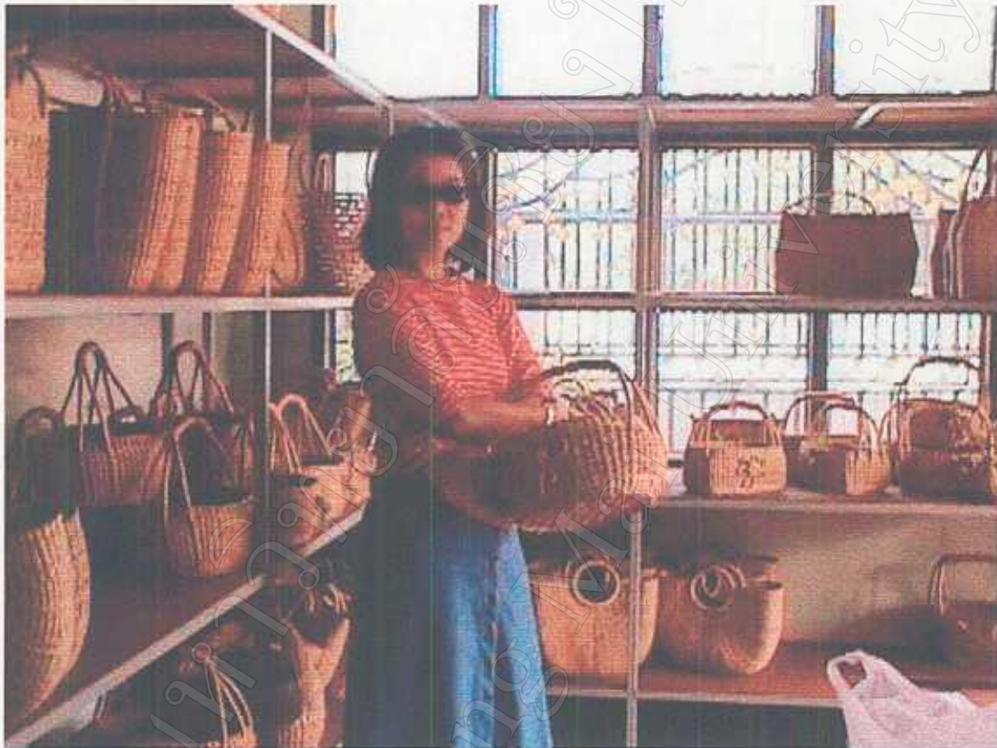
ผลิตภัณฑ์เครื่องใช้ที่ทำจากผักตบชวา มีวางจำหน่ายในร้านค้าภายในหมู่บ้าน