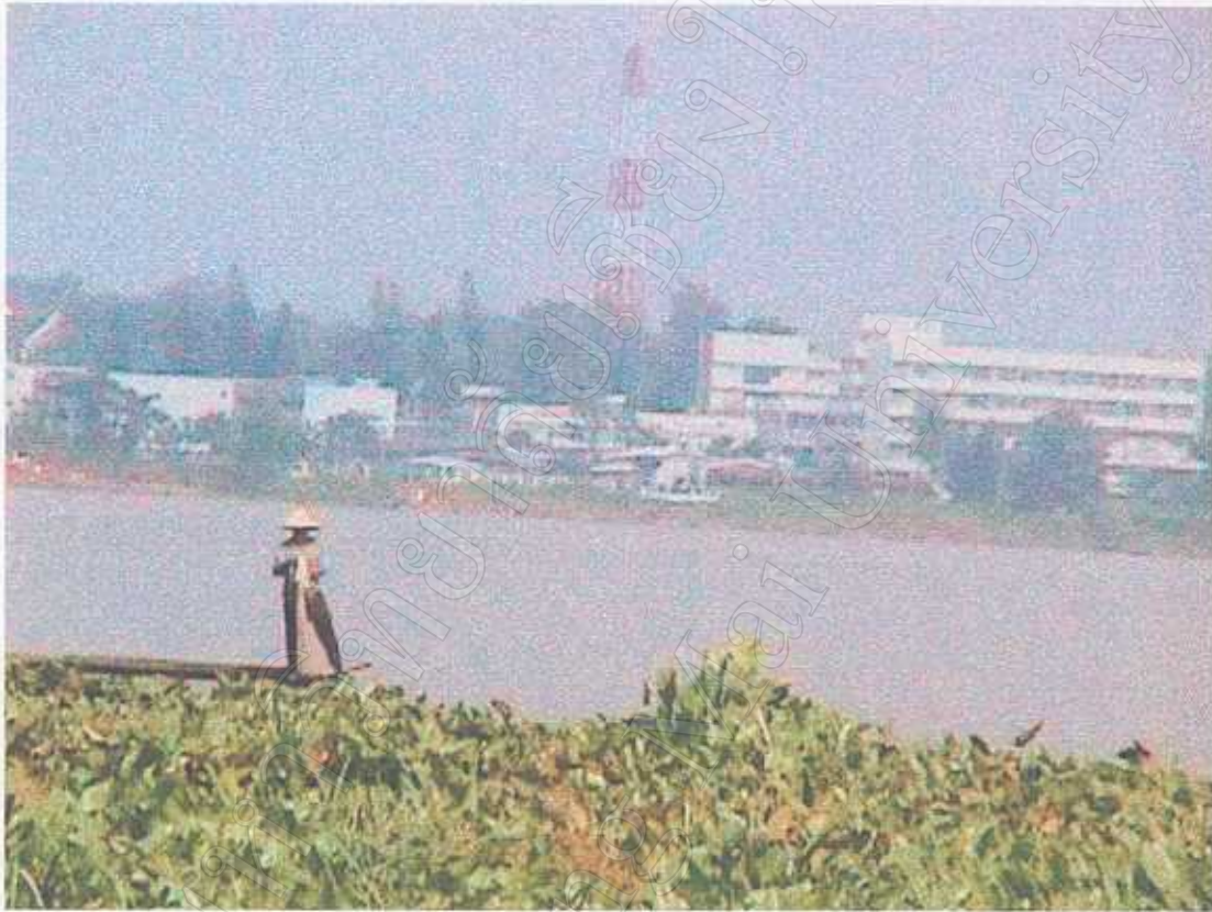
อาชีพการประมงของประชากรชนบท ด้านตะวันตก นอกเขตเทศบาลเมืองพะเยา