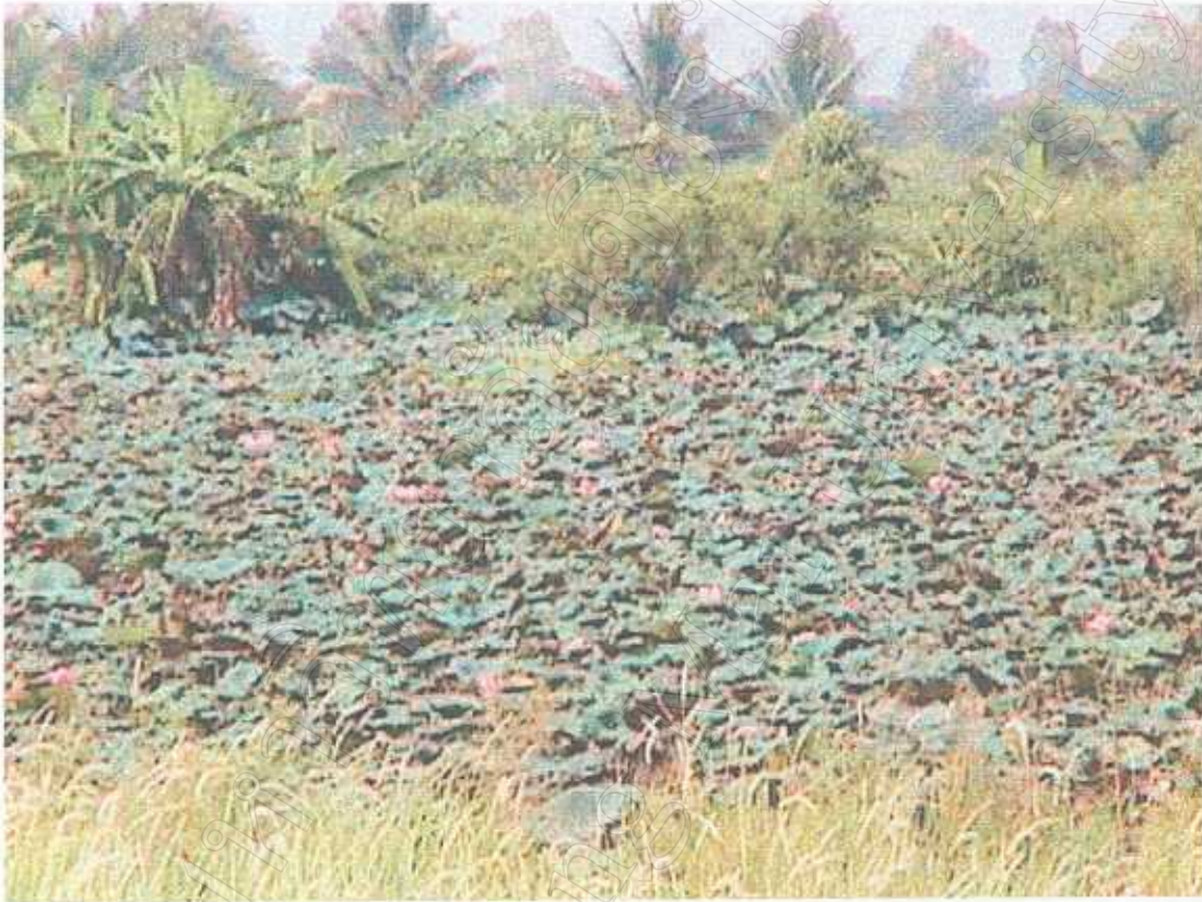
การทำนาบัวตึ๊ดกวันพะเยา ของประชากรชนบท ด้านตะวันตก นอกเขตเทศบาลเมืองพะเยา