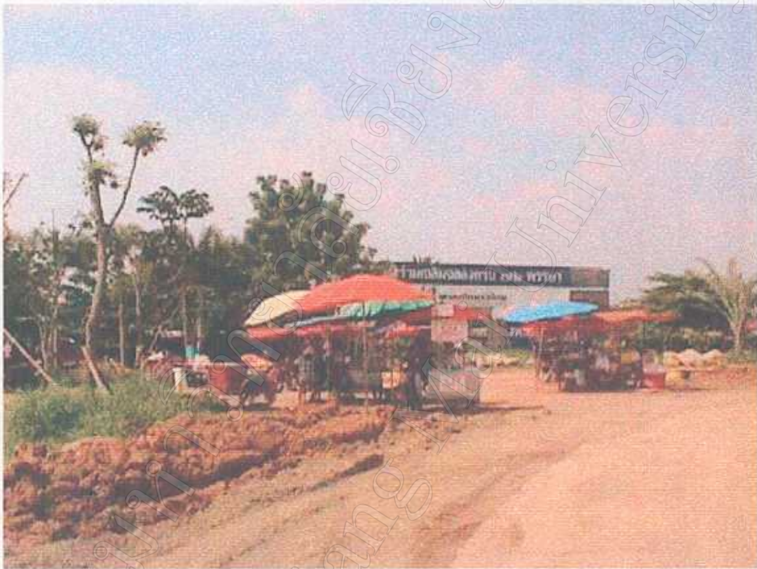
สภาพ 해변 แผงลอยริมกว๊านพะเยา ในเขตเทศบาลเมืองพะเยา