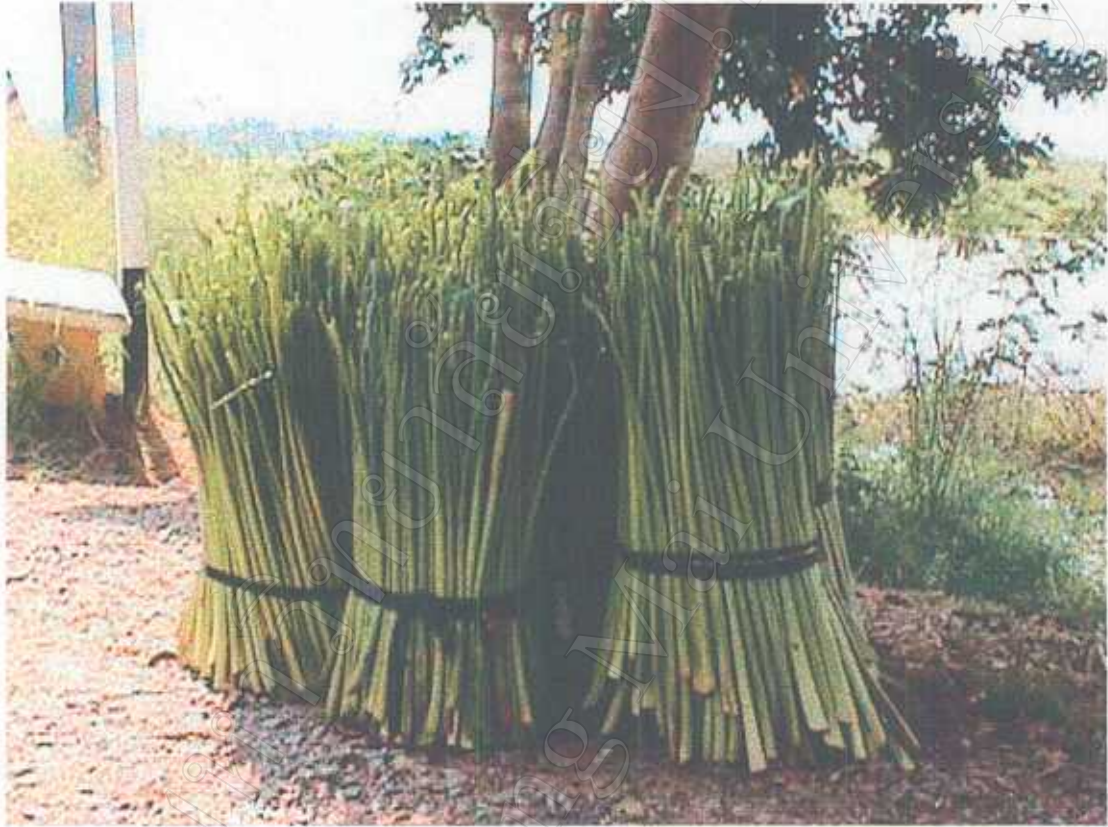
ลำต้นของฝักตบชวาที่เก็บขนมาจากกว๊านพะเยา