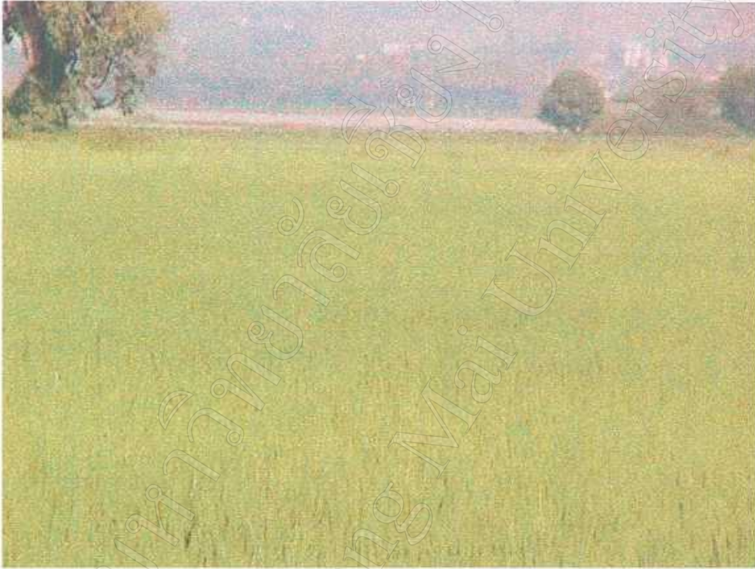
พื้นที่เกษตรกรรมของประชากรชนบท การทำนาข้าวติดกว๊านพะเยา ด้านตะวันตก นอกเขตเทศบาลเมืองพะเยา