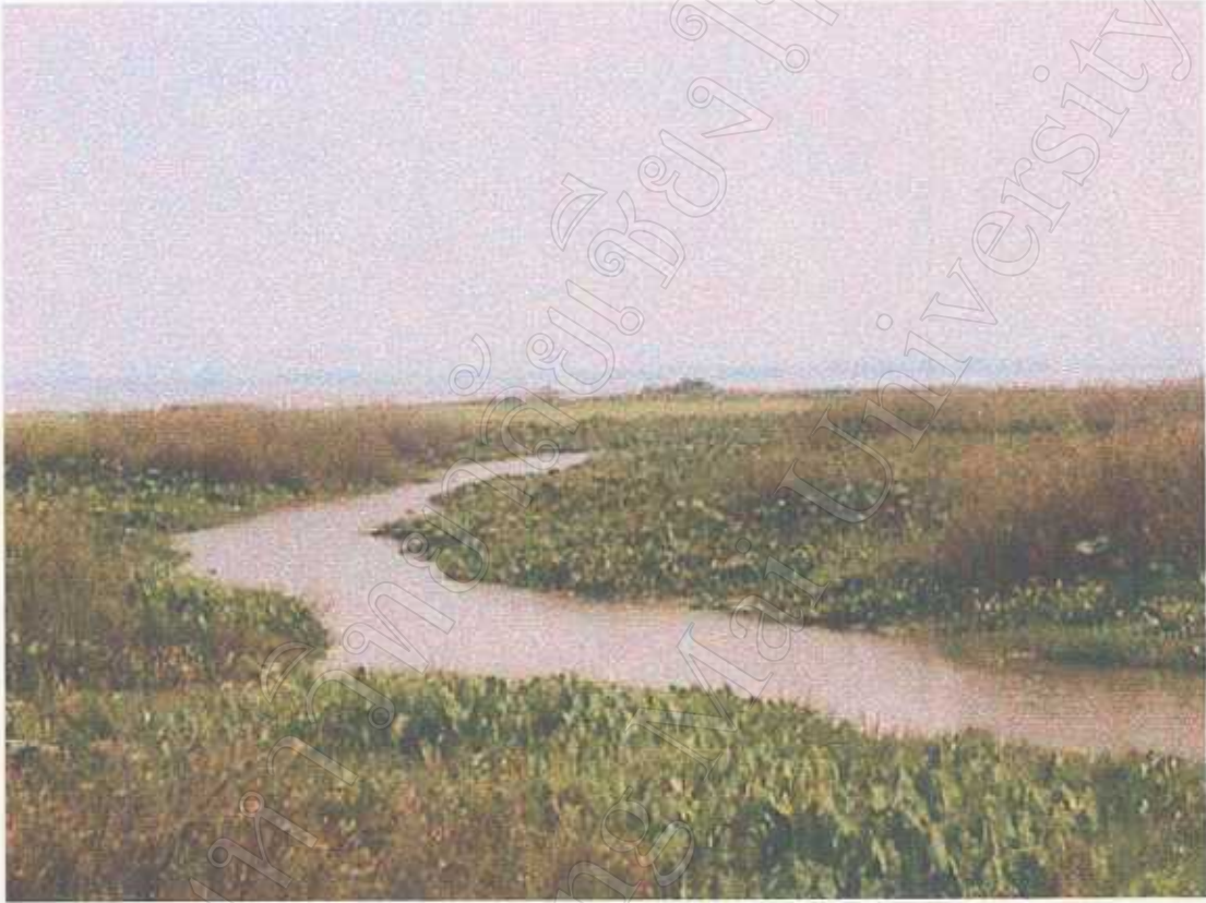
วัชพืช และผักตบชวาบริเวณกว๊านพะเยา ด้านตะวันตก นอกเขตเทศบาลเมืองพะเยา