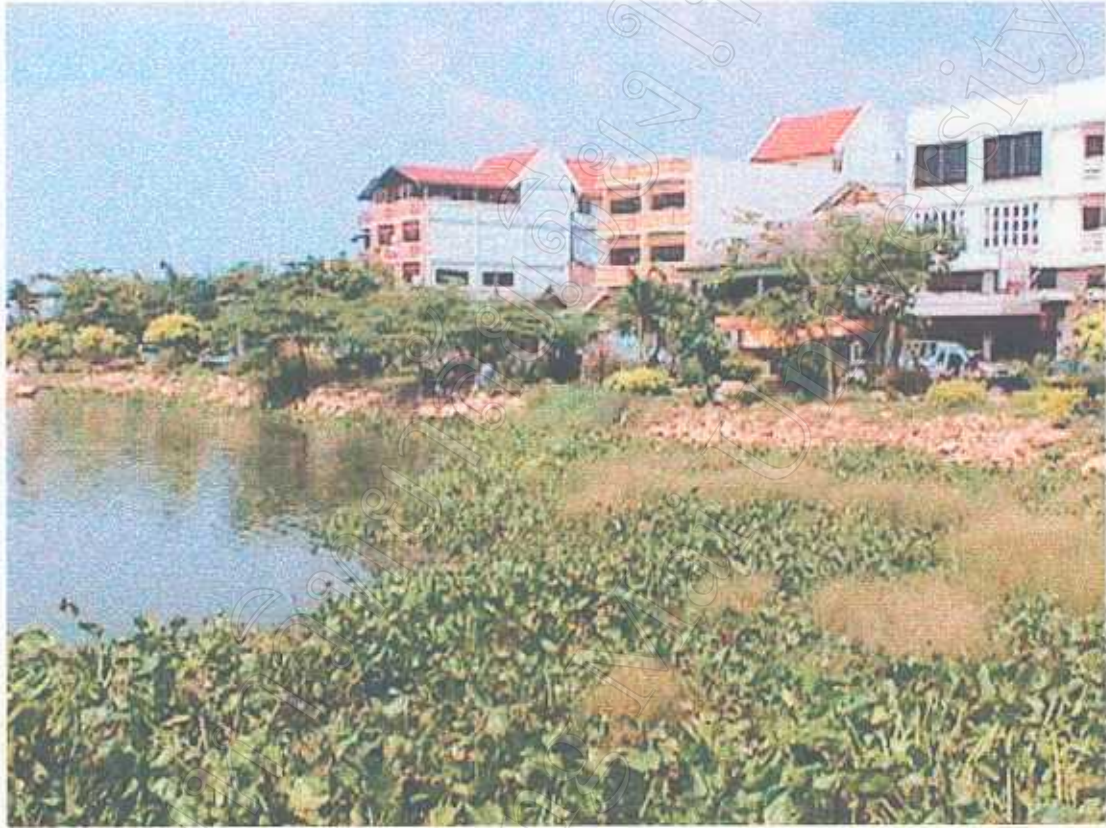
บริเวณร้านค้าริมกว๊านพะเยาด้านตะวันออก ในเขตเทศบาลเมืองพะเยา