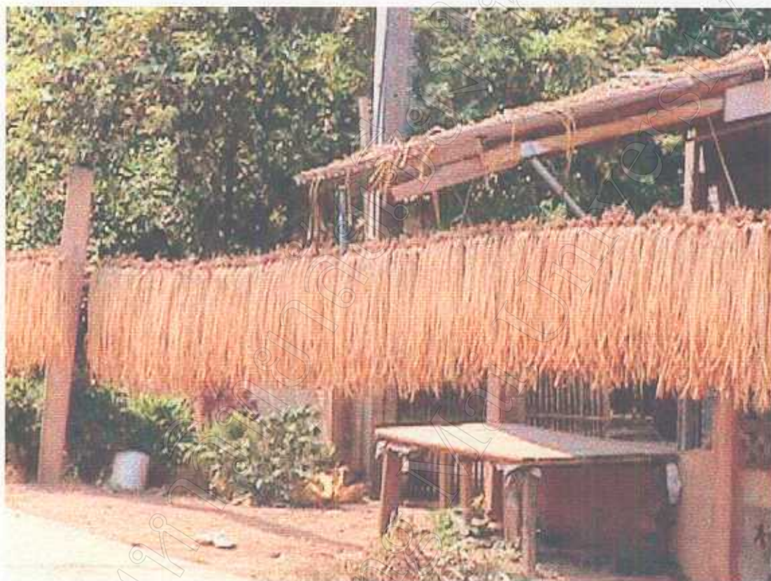
ลำต้นฝักตบขวานนำไปตากให้แห้งก่อนนำไปทำผลิตภัณฑ์เครื่องใช้