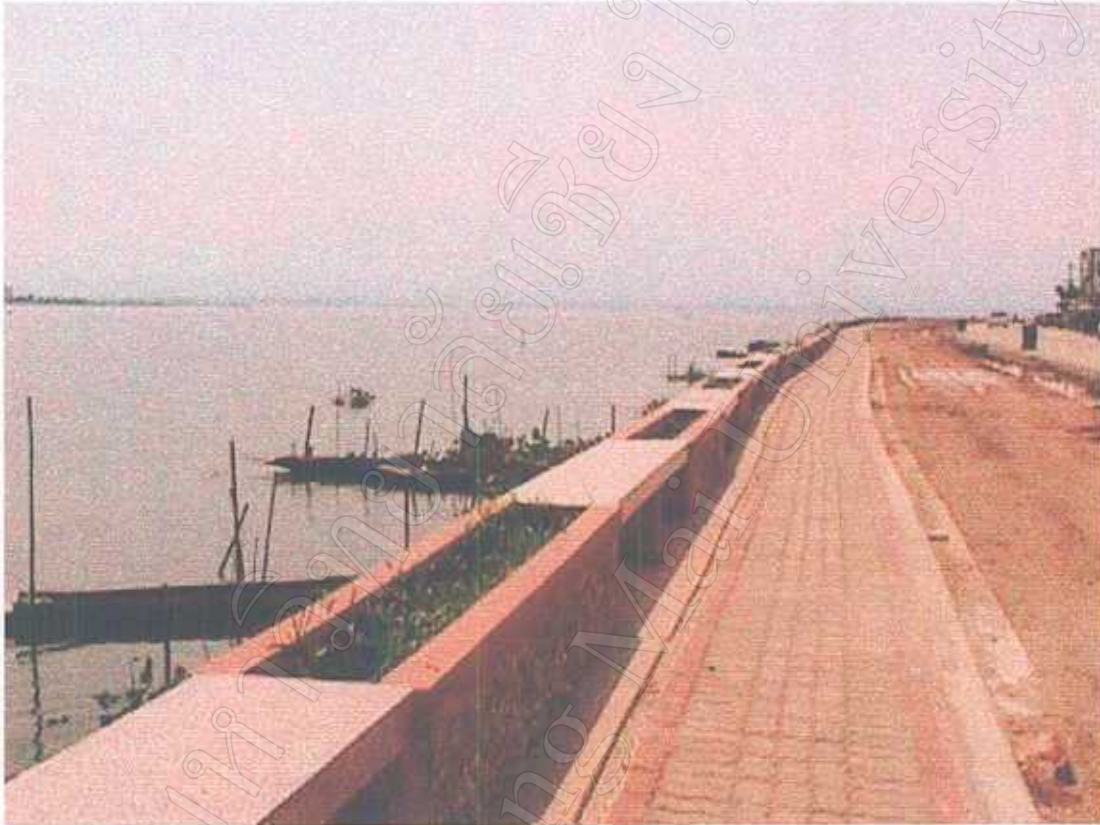
งานก่อสร้างทางเดินเท้า และถนนโดยรอบกว๊านพะเยาด้านตะวันออก ก่อสร้างโดยเทศบาลเมืองพะเยา