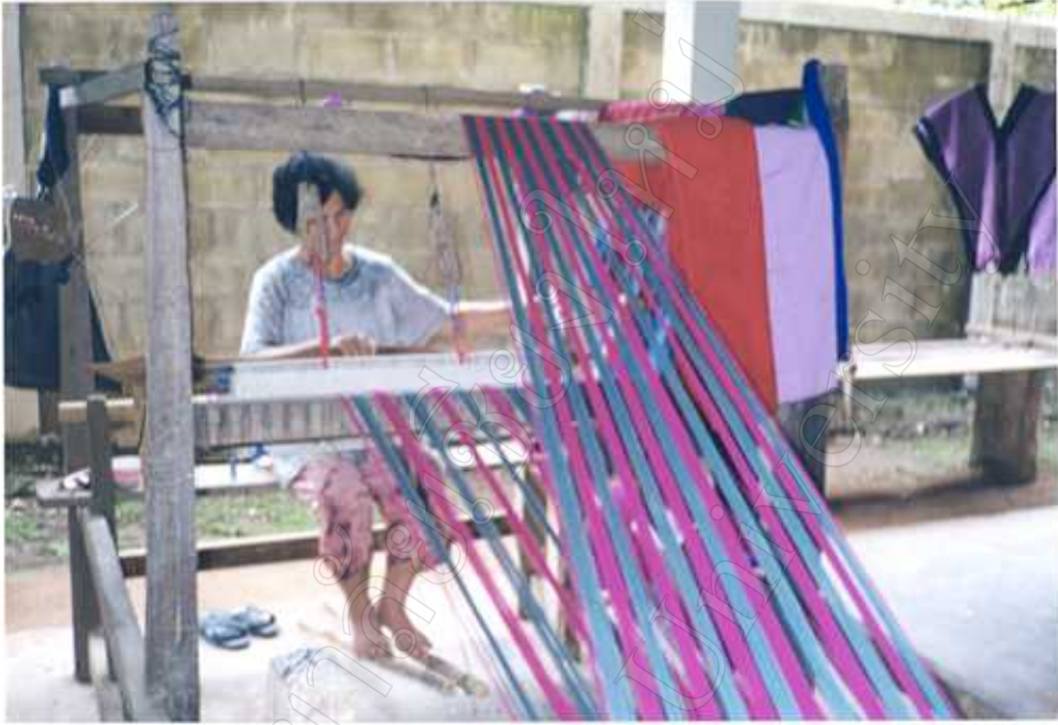
กิจกรรมการทอผ้า