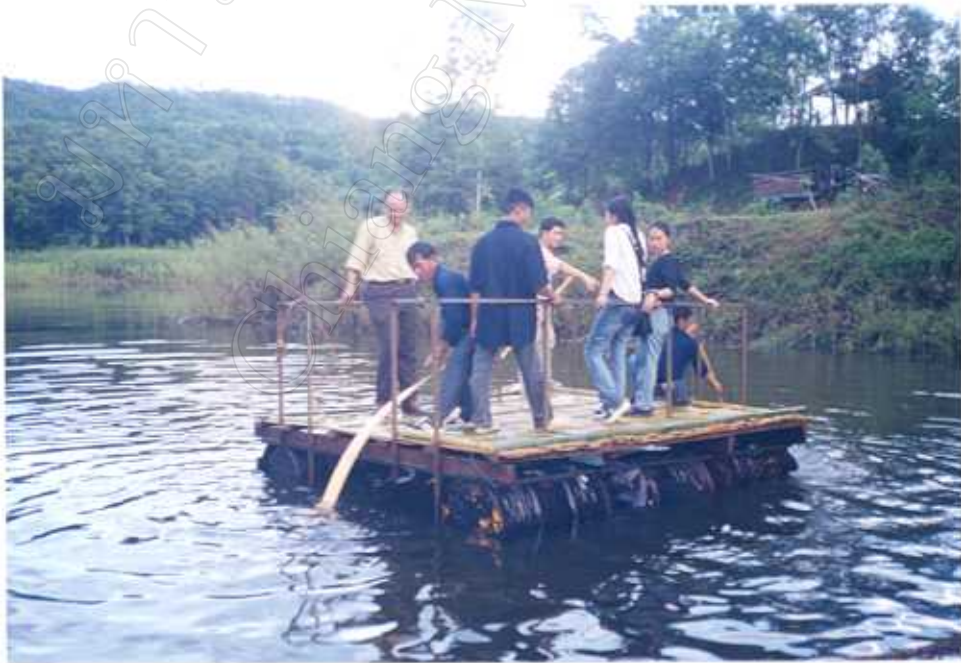
กิจกรรมการล่องแพชมธรรมชาติของอ่างเก็บน้ำแม่หยวก