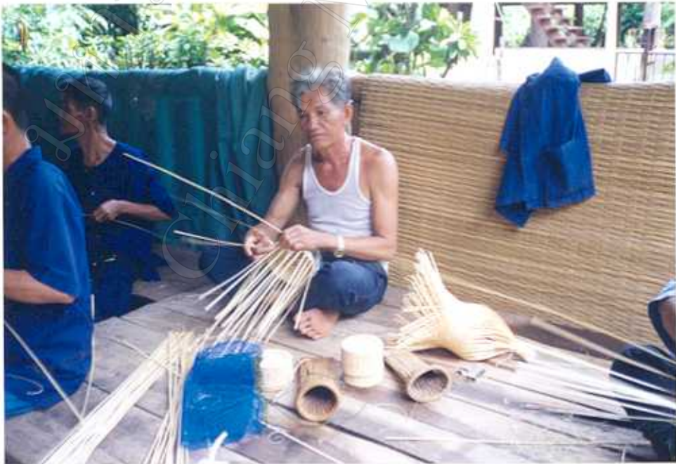
กิจกรรมการจักสานเครื่องใช้ในครัว