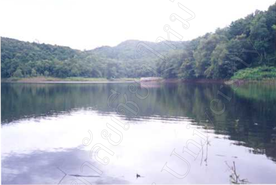
ทัศนียภาพของอ่างเก็บน้ำแม่หยวก

ภาพแสดง ทรัพยากรการท่องเที่ยวตำบลแม่ทราย