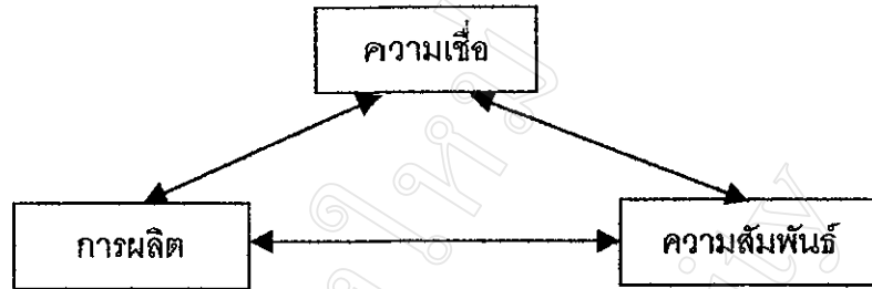
ภาพที่ 1 แผนภูมิแสดงความสัมพันธ์ระหว่างความเชื่อ การผลิตและความสัมพันธ์ของชุมชน

(กาญจนา แก้วเทพ และ กนกศักดิ์ แก้วเทพ, 2530 : 48)