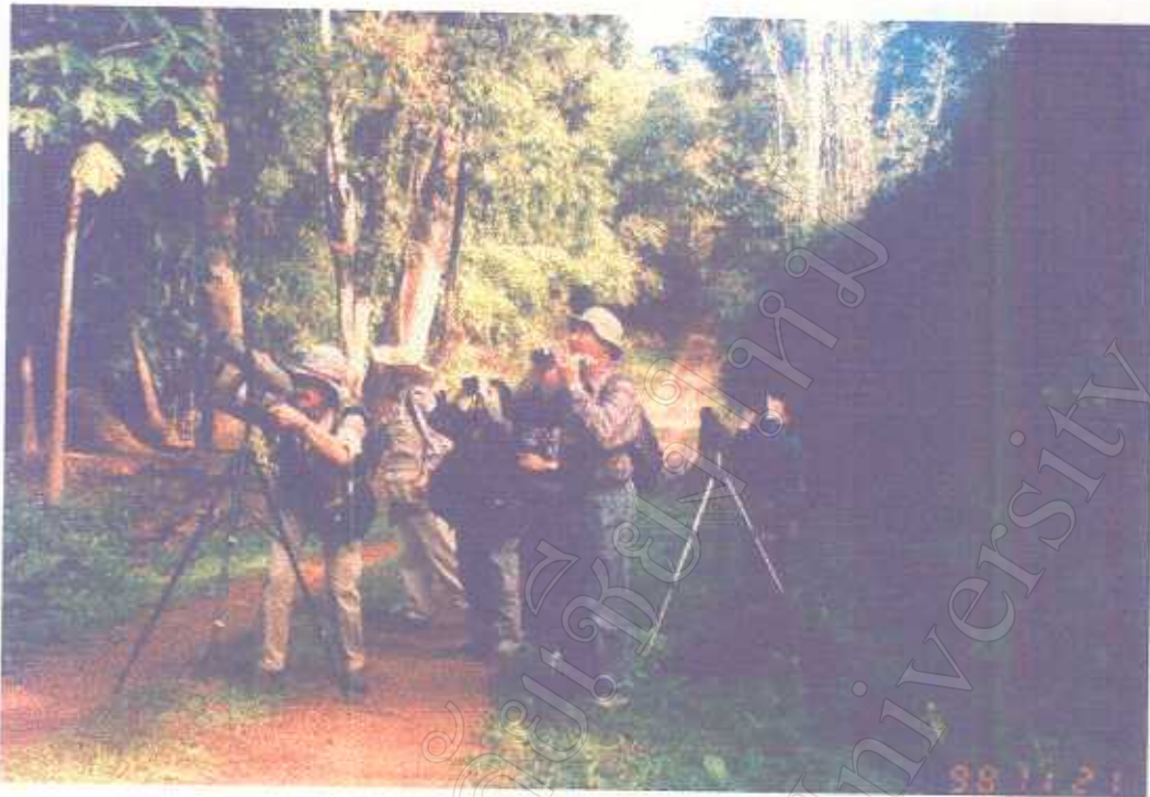
ภาพแสดง กิจกรรมดูนกตามเส้นทางศึกษาธรรมชาติ