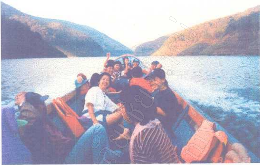
ภาพแสดง กิจกรรมการล่องเรือชมธรรมชาติในลำน้ำปิง