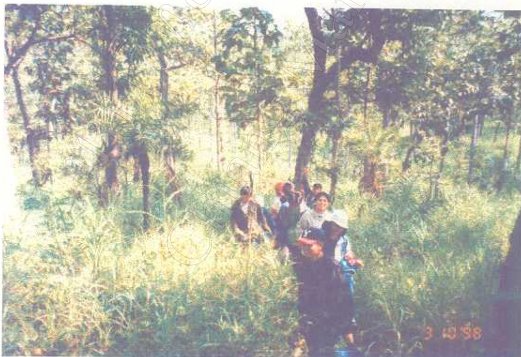
ภาพแสดง กิจกรรมการเดินชมธรรมชาติตามเส้นทางศึกษาธรรมชาติ