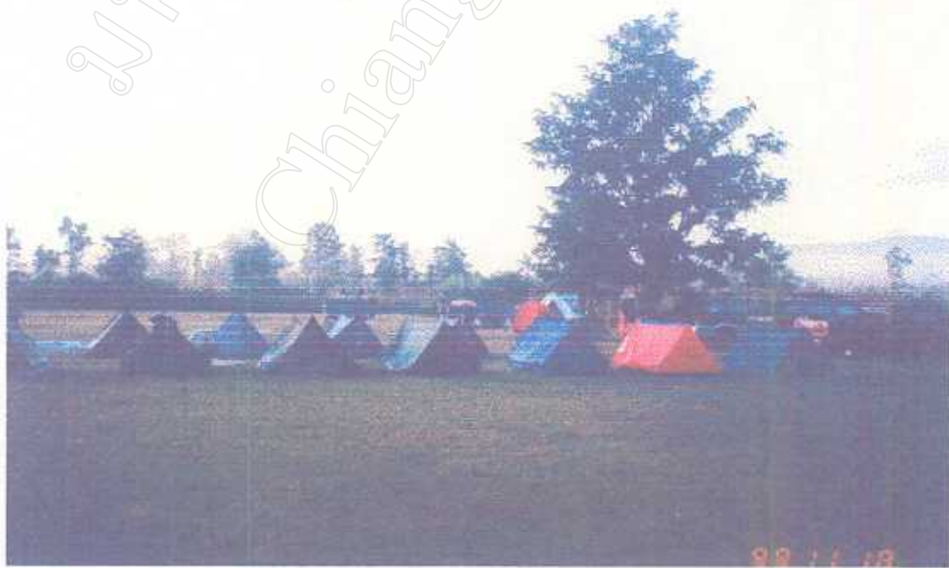
ภาพแสดง กิจกรรมการพักแรมบริเวณแหล่งท่องเที่ยวทุ่งก๊ก - ทุ่งนาง