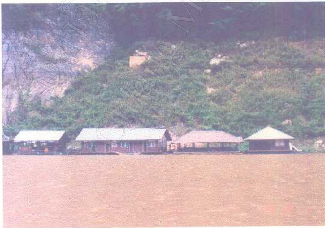
ภาพแสดง แหล่งท่องเที่ยวชมบริเวณแก่งก้อ