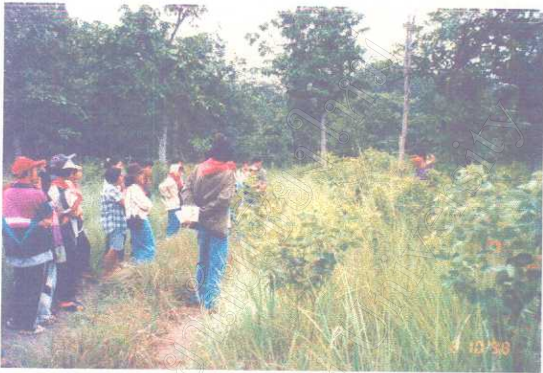
ภาพแสดง กิจกรรมเพื่อความหมายธรรมชาติ