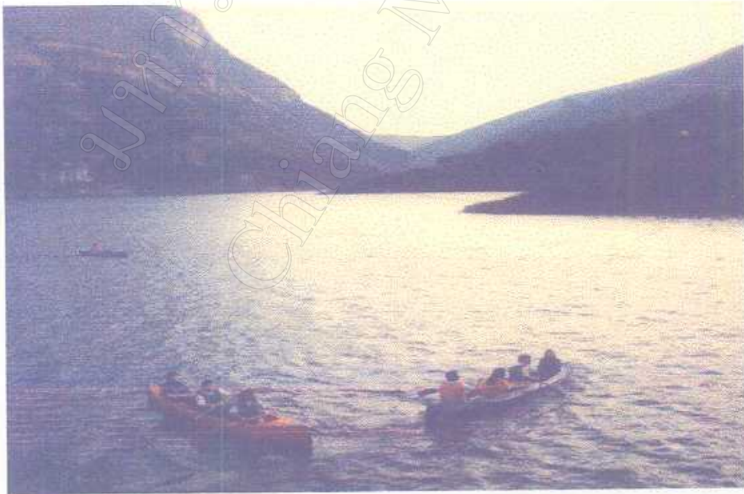
ภาพแสดง กิจกรรมการพายเรือแคนูในทะเลสาบแม่ปิง