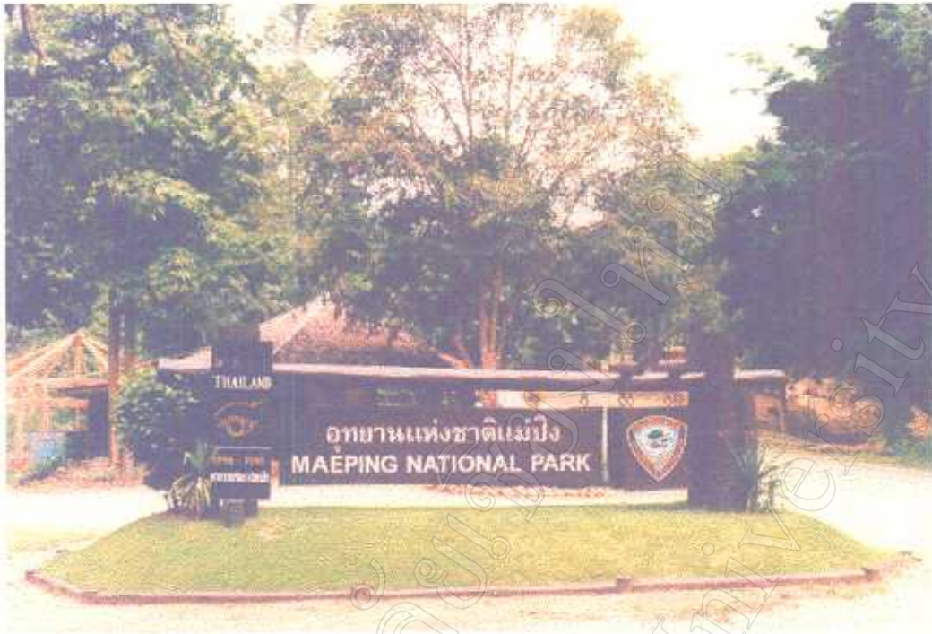
ภาพแสดง ที่ทำการอุทยานแห่งชาติแมปิง