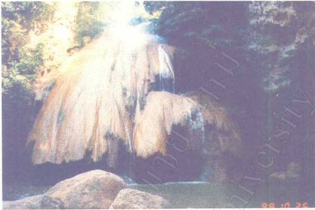
ภาพแสดง แหล่งท่องเที่ยวบริเวณน้ำตกถ่อหลวง