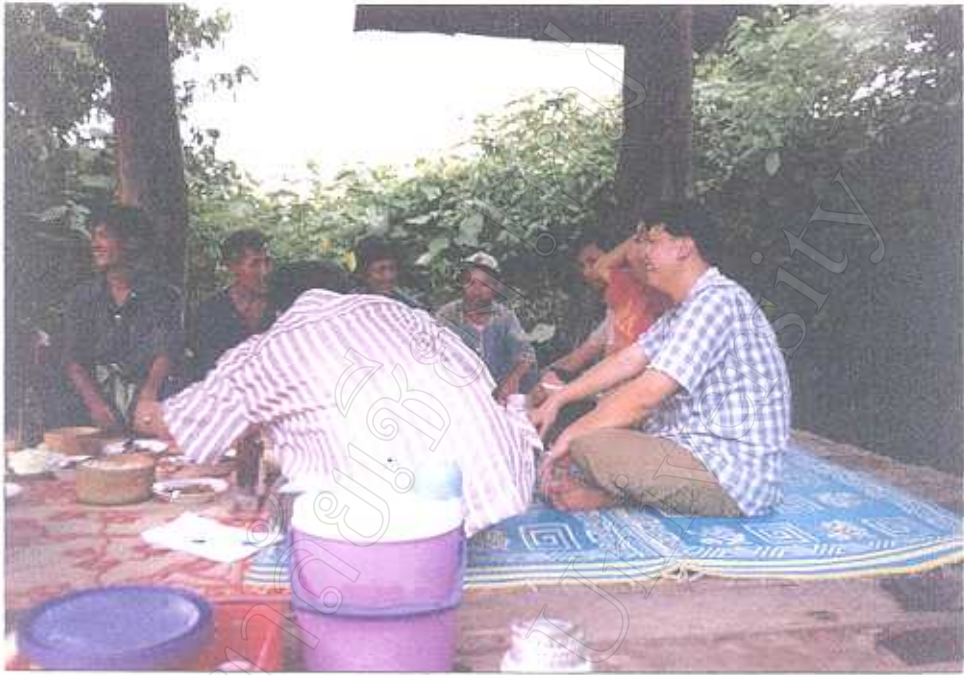
รูปภาพที่ 4 การสัมมนากับชาวบ้าน