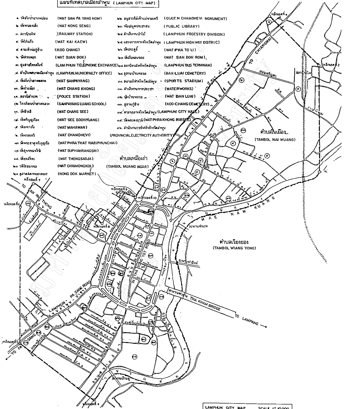
LAMPHUN CITY MAP SCALE 1:10,000