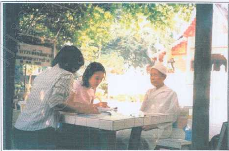
ภาพ 5 สัมภาษณ์แม่ชีที่ไม่สามารถกรอกแบบสอบถามเองได้ 30 มีนาคม 2545