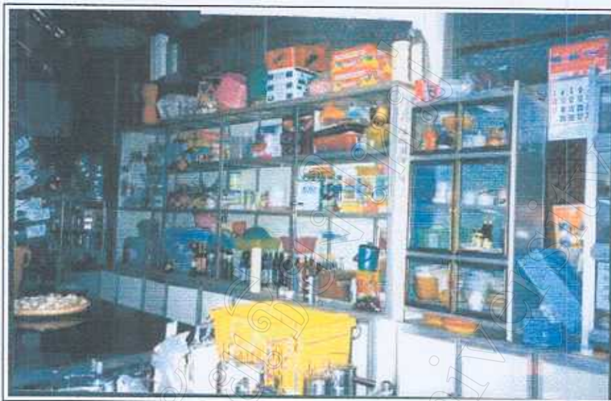
ภาพ 8 การเก็บเครื่องปรุงรสและของใช้ในครัว ถ่ายภาพโดย นางสาวอุบล ชันชะ 30 มีนาคม 2545