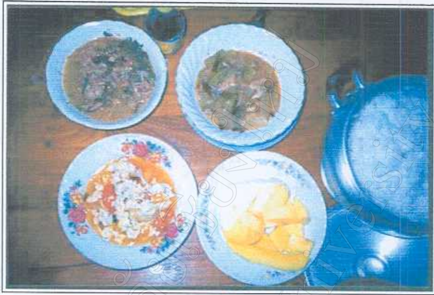
ภาพ 10 อาหารที่ทำมาจากโรงครัว 30 มีนาคม 2545