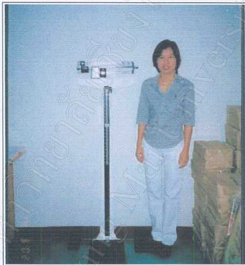
ภาพ 1 เครื่องมือที่ใช้ในการประเมินภาวะโภชนาการและผู้ทำการศึกษา 23 มีนาคม 2545