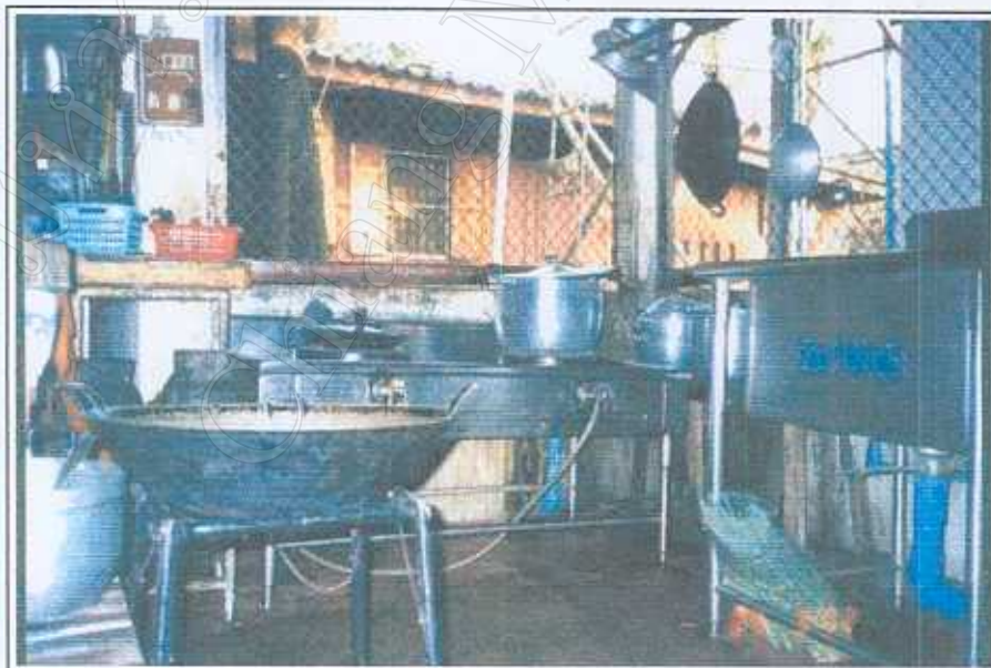
ภาพ 9 อุปกรณ์ทำครัว 30 มีนาคม 2545