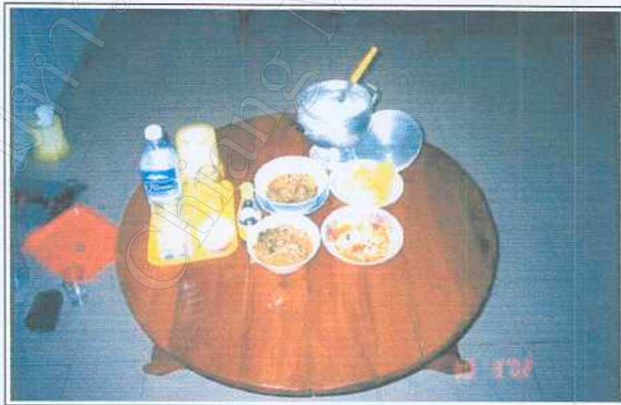
ภาพ 11 โต๊ะอาหารและอาหารที่ทำมาจากโรงครัว ถ่ายภาพโดย นางสาวอุบล ชันชะ 30 มีนาคม 2545