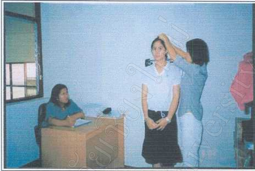
ภาพ 2 ความเชื่อมั่นและแม่นยำในการวัด (อาสาสมัคร ช้วน ผอม ปกติ) 23 มีนาคม 2545