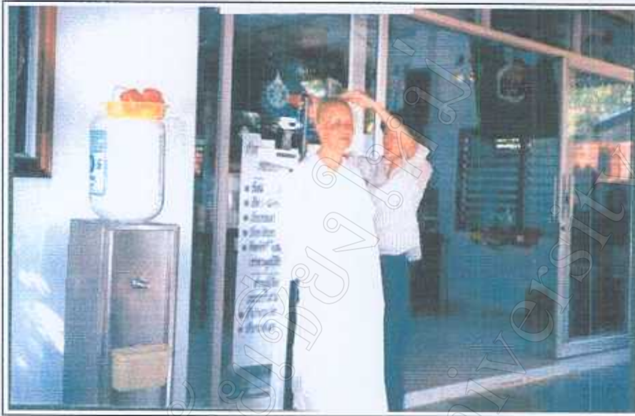
ภาพ 6 วัดส่วนสูงและชั่งน้ำหนักแม่จิ 30 มีนาคม 2545