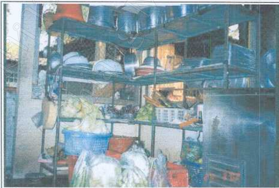
ภาพ 7 วัดตุนิบและอุปกรณ์ของใช้ในครัว 30 มีนาคม 2545