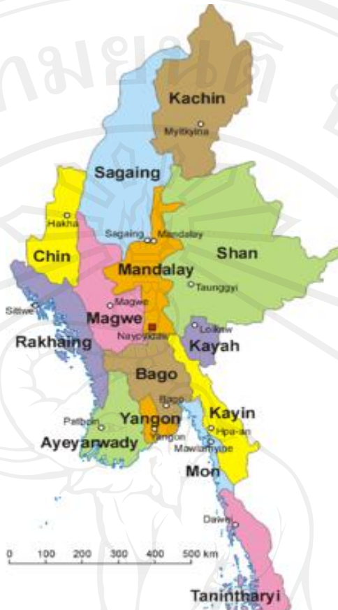
รูปที่ 1.1 แผนที่ตั้งของสาธารณรัฐแห่งสหภาพเมียนมาร์ แบ่งตามการปกครอง

สภาพทางสังคมโดยทั่วไปของสาธารณรัฐแห่งสหภาพเมียนมาร์นั้น เป็นสังคมที่ประกอบไปด้วยกลุ่มคนหลายเชื้อชาติ ประมาณ 135 ชาติพันธุ์ ซึ่งสามารถแบ่งได้เป็น 8 กลุ่มชาติพันธุ์หลัก ได้แก่ เชื้อชาติพม่า คะฉิ่น กะเหรี่ยง คะยาห์ ชิน มอญ ไทใหญ่ และ ยะไข่ โดยเชื้อชาติพม่า ถือได้ว่าเป็นกลุ่มชาติพันธุ์ที่มีจำนวนประชากรมากที่สุด ประมาณร้อยละ 68 ของประชากรทั้งหมด และร้อยละ 32 จะเป็นกลุ่มชาติพันธุ์อื่น (ดิรณัย อาป่อง, 2554) การเป็นพหุสังคมหรือสังคมที่ประกอบไปด้วยกลุ่มคนหลายชาติพันธุ์ในสาธารณรัฐแห่งสหภาพเมียนมาร์ ทำให้สังคมของประเทศต้องเผชิญกับปัญหาความขัดแย้ง และความเหลื่อมล้ำในการพัฒนาประเทศ ระหว่างกลุ่มชาติพันธุ์ (พรพิมล ศรีโชติ, 2542) ในส่วนของการพัฒนามนุษย์ (Human Development) สาธารณรัฐแห่งสหภาพเมียนมาร์จัดอยู่ในอันดับที่ 149 จากประเทศสมาชิกทั้งหมดขององค์การสหประชาชาติ 187 ประเทศ ในปี 2554 ซึ่งจัดอยู่ในกลุ่มประเทศที่มีการพัฒนาด้านมนุษย์ในระดับต่ำ (UNDP, 2554)