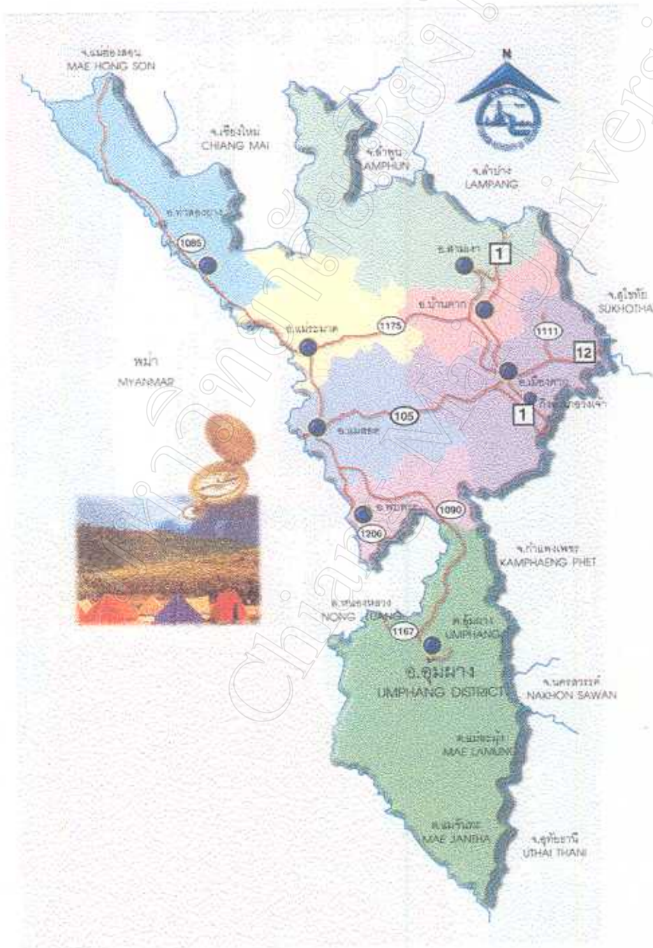
ภาพที่ 4.2 : แผนที่แสดงเส้นทางการเดินทางไปอำเภออุ้มผาง จังหวัดตาก

การเดินทางใช้ทางหลวงหมายเลข 105 (ตาก-แม่สอด) ถึงอำเภอแม่สอด แยกซ้ายมือตามทางหลวงหมายเลข 1090 (แม่สอด-อุ้มผาง) เส้นทางคดเคี้ยวระดับซับซ้อน 1,219 โค้งไปตามเทือกเขาถนนธงชัย ผ่านป่าเขาที่มีทัศนียภาพสวยงาม ใช้เวลาเดินทางประมาณ 4-5 ชั่วโมง