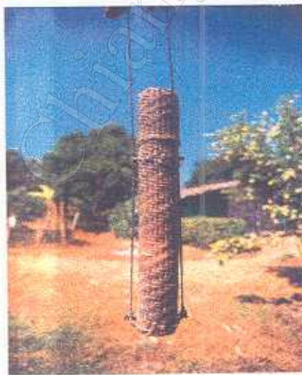
ภาพที่ 4.1 : กระบอกอู่มะ

อุ้มผางห่างจากตัวจังหวัดตากประมาณ 254 กิโลเมตร มีชายแดนติดต่อกับสหภาพเมียนมาร์ อุ้มผางเป็นอำเภอที่มีพื้นที่ใหญ่ที่สุดในประเทศไทย ด้วยเนื้อที่ประมาณ 1,572,281 ไร่ (คณะกรรมการพัฒนาเศรษฐกิจและสังคมแห่งชาติ 2540:5-232 – 5-260) เดิมมีชาวกะเหรี่ยงอาศัยอยู่เป็นจำนวนมาก ต่อมาได้มีคนไทยภาคเหนืออพยพเข้ามาอยู่มากขึ้นจนเป็นชุมชนใหญ่ อุ้มผางเดิมเป็นเมืองหน้าด่านชายแดนตะวันตกขึ้นอยู่กับจังหวัดอุทัยธานี และเป็นจุดตรวจหนังสือเดินทางชาวพม่าที่เข้ามาค้าขายในเขตแดนไทย โดยชาวพม่าที่เดินทางรอนแรมในป่าสมัยนั้นจะนำเอาเอกสารหนังสือเดินทางใส่ไว้ในกระบอกไม้ไผ่มีฝาปิดเพื่อป้องกันฝนและการฉีกขาดระหว่างเดินทาง เมื่อถึงจุดตรวจที่อุ้มผางก็จะเปิดกระบอกไม้ไผ่ยื่นเอกสารให้เจ้าหน้าที่ตรวจสอบและประทับตรา เอกสารที่วันนี้เรียกเป็นภาษากะเหรี่ยงว่า “อู่มะ” ต่อมาได้เพี้ยนเป็น “อู่มผาง” ซึ่งเป็นชื่อของอำเภออุ้มผางในปัจจุบัน