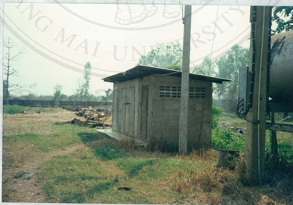
สภาพห้องส้วมของคณาจารย์ในโรงงาน