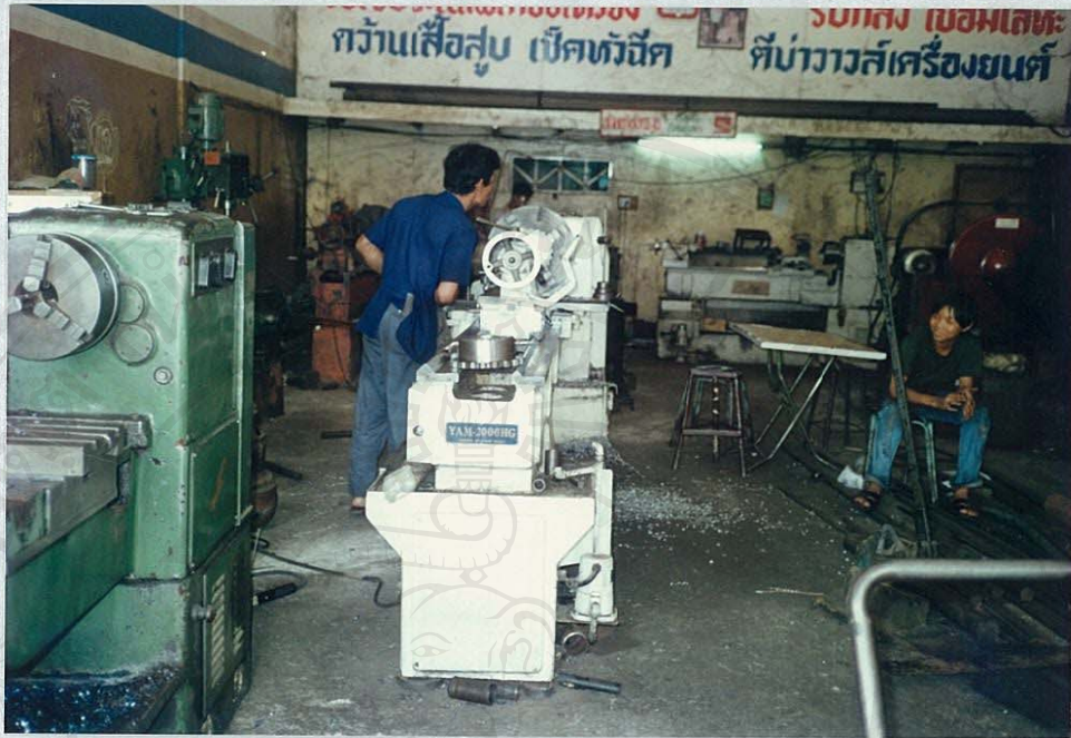
โรงงานอุตสาหกรรมบริการซ่อมสิ่งของ