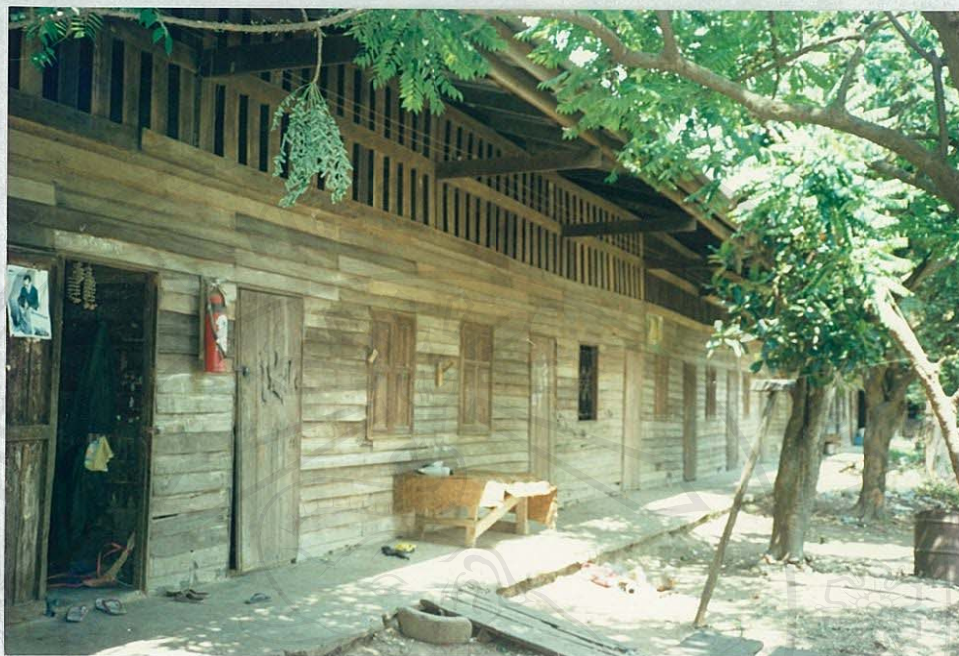
สภาพที่อยู่อาศัยของคณาจารย์ในโรงงาน