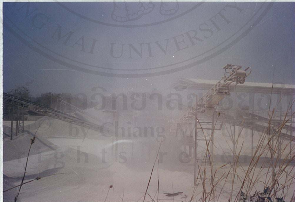
โรงงานอุตสาหกรรมการทำเมืองแร่