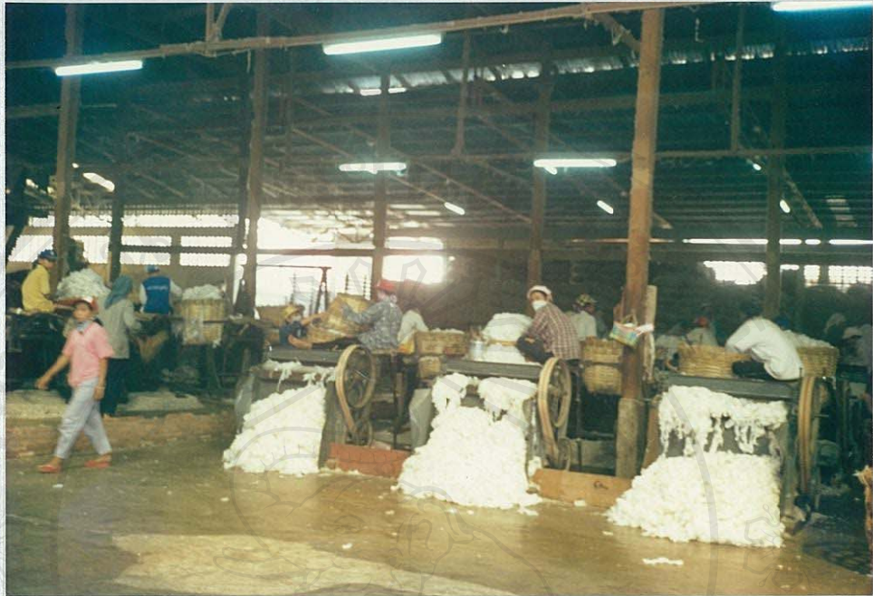
โรงงานอุตสาหกรรมทึบฝ้าย