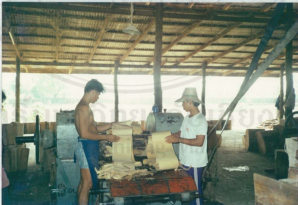
(โรงผลิตก้านไม้ขีด)