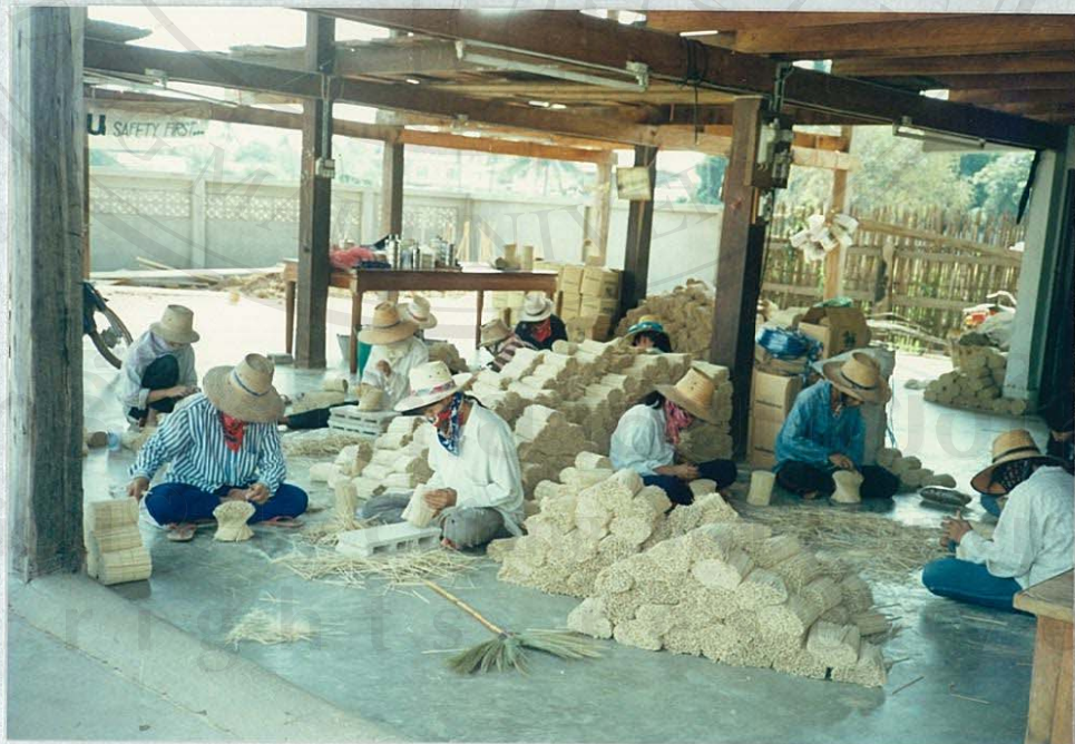
(โรงผลิตไม้จิ้มฟัน)