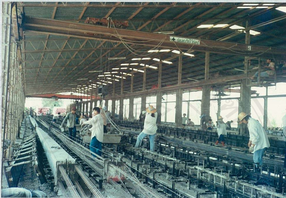
(โรงงานผลิตผลิตภัณฑ์คอนกรีต)