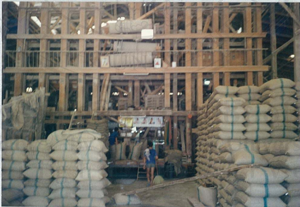
(โรงสีข้าว)