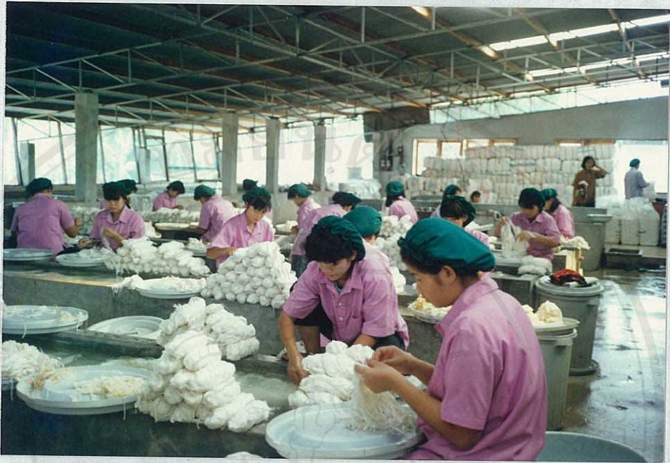
โรงงานอุตสาหกรรมผลิตกระดาษสา