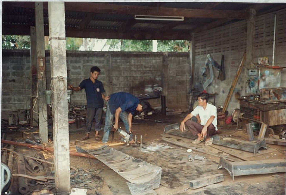
โรงงานอุตสาหกรรมผลิตผลิตภัณฑ์โลหะ เครื่องจักรและอุปกรณ์