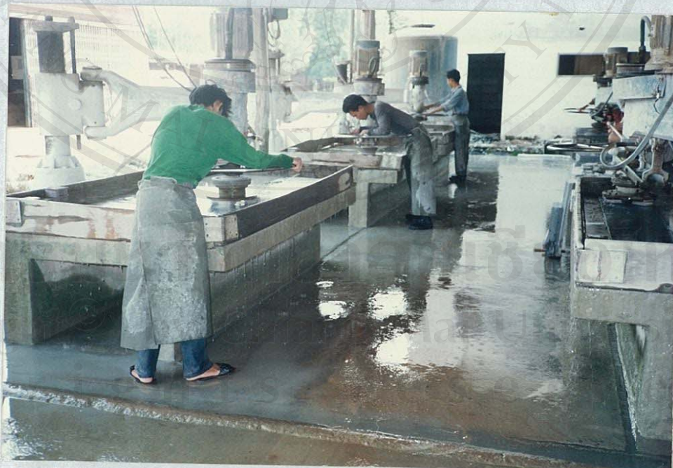
(โรงงานผลิตผลิตภัณฑ์หินอ่อน-หินแกรนิต)