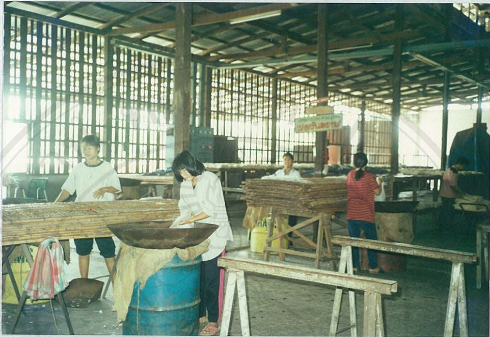
(โรงงานเส้นหมี่-เส้นก๋วยเตี๋ยว)