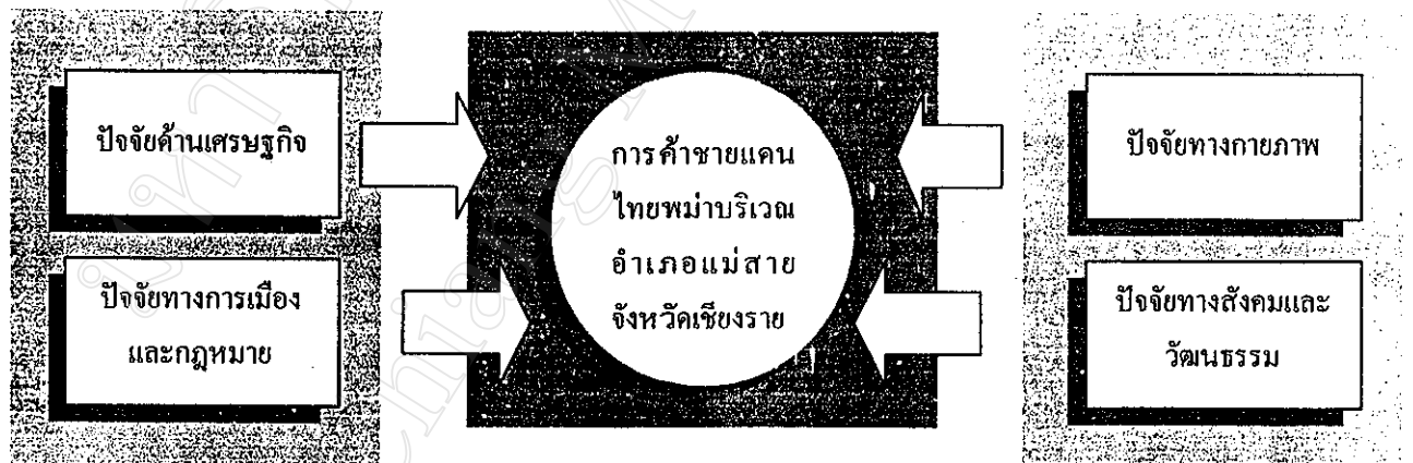
รูปที่ 2 แสดงกรอบแนวคิดในการศึกษา