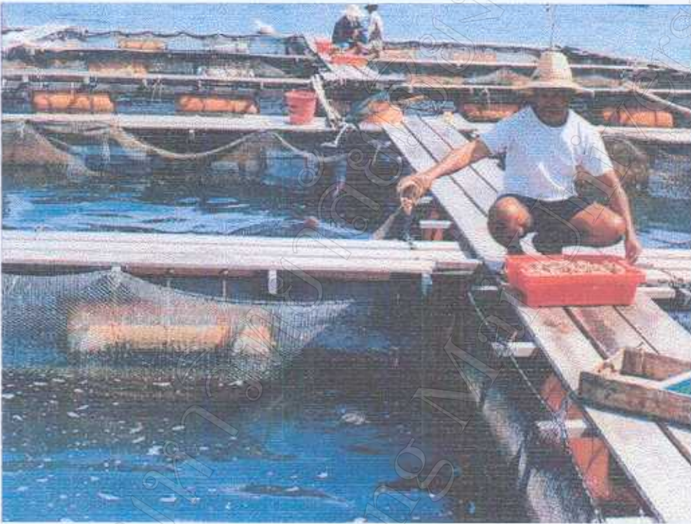
ภาพที่ 1 กระชังที่ใช้ในการเลี้ยงปลากระพงขาว