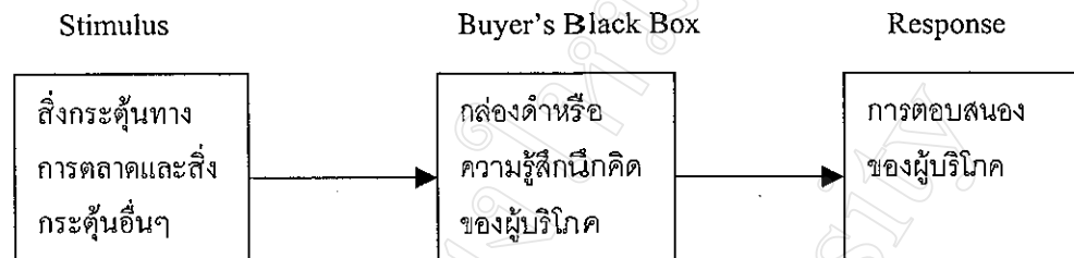
แผนภาพที่ 2.1 แสดงรูปแบบพฤติกรรมผู้บริโภคอย่างง่าย หรือ S-R Theory

สรุปโดยย่อจุดเริ่มต้นของโมเดลนี้อยู่ที่การมีสิ่งกระตุ้น (Stimulus) ให้เกิดความต้องการก่อนแล้วทำให้เกิดการตอบสนอง (Response) ดังนั้น โมเดลนี้จึงอาจเรียก S-R Theory ดังแผนภาพต่อไปนี้