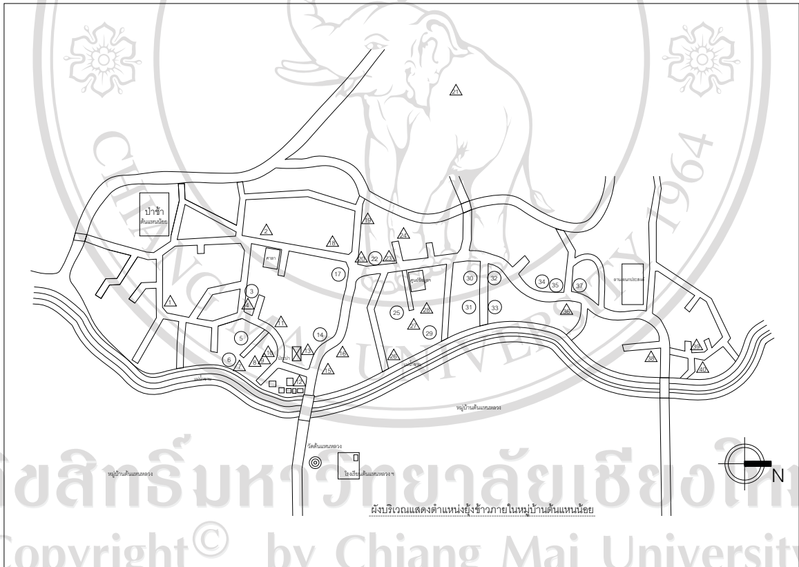
ภาพ 75 แผนผังของหมู่บ้านต้นเหน้อยและตำแหน่งหล่งข้าว