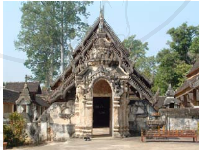
รูปที่ 1.3 วัดไหล่หิน (ขาบ่น) อาคารเลียนแบบ (ซ้ายบ่น)

ลิขสิทธิ์มหาวิทยาลัยบูรพา Copyright © All Rights Reserved