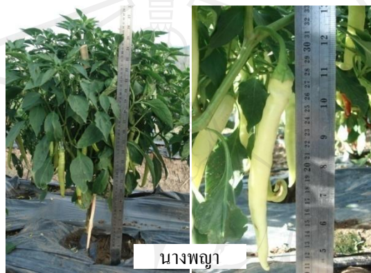
ภาพที่ 14 ลักษณะต้นและผลของพริกพันธุ์การค้า