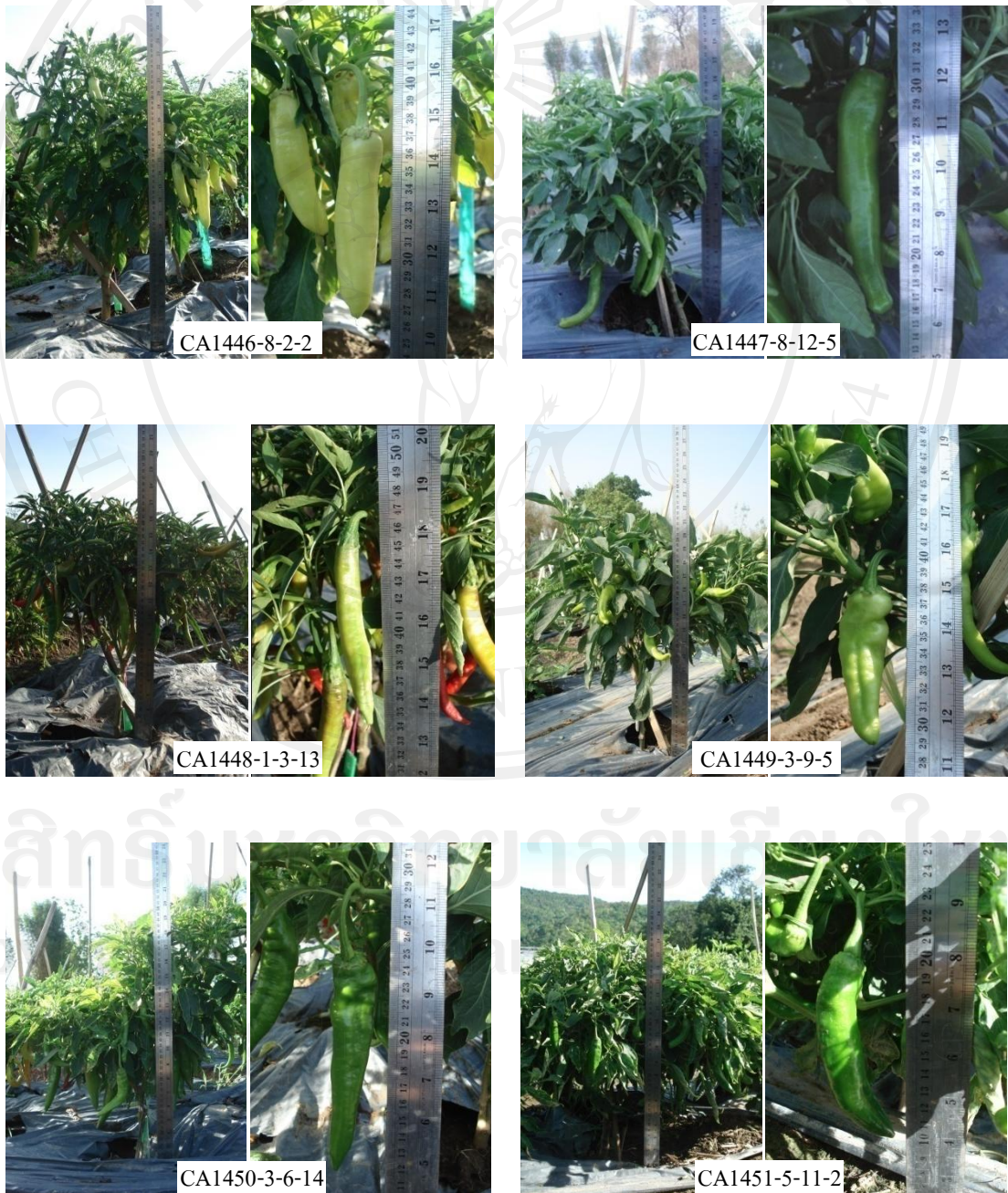
ภาพที่ 12 ลักษณะต้นและผลของพริกพ้อพันธุ์เทศผู้ปกติ

ผลมีรูปร่างเรียวยาว ปลายผลเว้า ไม่มีริยางค์ที่ส่วนปลายผล ผิวขุ่นปานกลาง ผลยาว 11.96 \pm 1.70 ซม. กว้าง 2.56 \pm 0.16 ซม. ก้านผลยาว 4.32 \pm 0.33 ซม. เส้นผ่าศูนย์กลางกลางผล 2.34 \pm 0.15 ซม. ความหนาของเนื้อผล 2.09 \pm 0.27 มม. จำนวนผลต่อต้น 28 \pm 6.00 ผล จำนวนผลต่อกก. 80 \pm 4.00 ผล น้ำหนักผลเฉลี่ย 22.35 \pm 3.18 ก. น้ำหนักผลต่อต้น 0.29 \pm 0.16 กก. และเมล็ดสีเหลืองเข้ม ผิวเรียบ ขนาดใหญ่ เส้นผ่าศูนย์กลาง 4.57 \pm 0.08 มม. มีเมล็ด 104 \pm 11.44 เมล็ดต่อผล