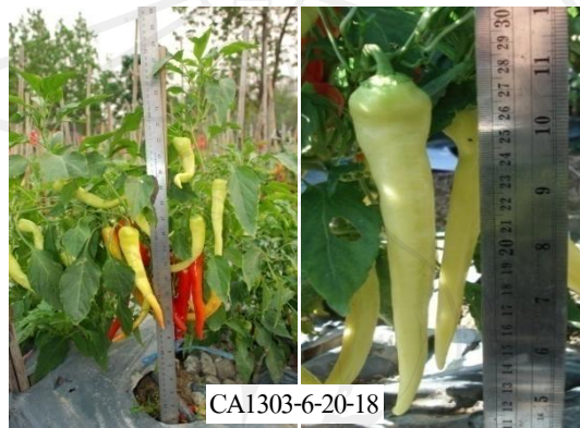
ภาพที่ 11 ลักษณะต้นและผลของพริกแม่พันธุ์กษยาเพศผู้เป็นหมัน