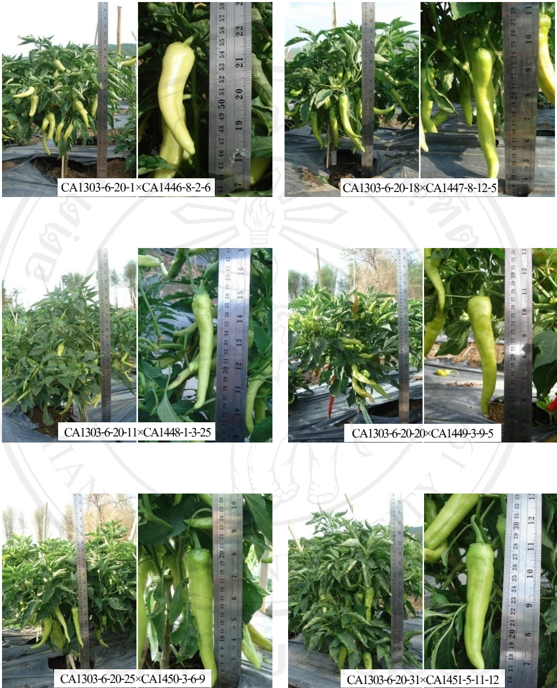
ภาพที่ 13 ลักษณะต้นและผลของพริกพันธุ์ลูกผสมชั่วที่ 1 (ต่อ)