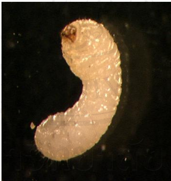
ภาพ 3.4 มอดหัวป้อมระยะตัวอ่อน

(ก) กลุ่มไข่ของมอดหัวป้อมบนเศษเมล็ดพืช (ข) ไข่มอดหัวป้อมขนาด 0.5 มิลลิเมตร