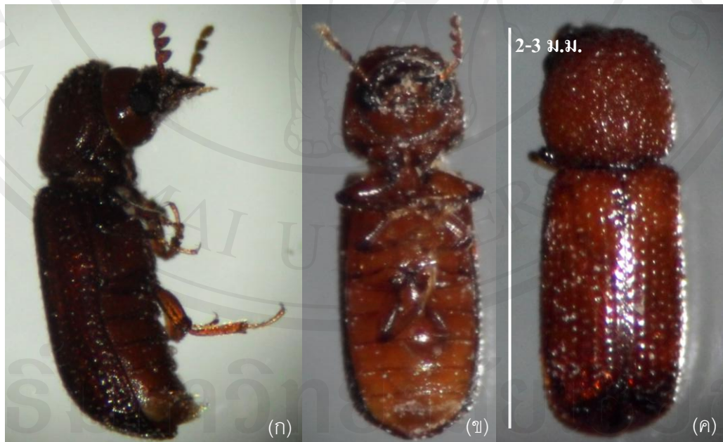
ภาพ 3.1 มอดหัวป้อม ( Rhyzopertha dominica ) ระยะตัวเต็มวัย

อุปกรณ์ในการเพาะเลี้ยงมอดหัวป้อมใช้ขวดโหลแก้วสีใสมีฝาปิด ขนาดเส้นผ่านศูนย์กลาง 6 เซนติเมตร สูง 15 เซนติเมตร บริเวณฝาเจาะช่องระบายอากาศ และปิดทับด้วยผ้าตาข่ายเพื่อ ป้องกันแมลงหลบหนี เป็นภาชนะสำหรับเพาะเลี้ยงมอดหัวป้อม (ภาพ 3.2)