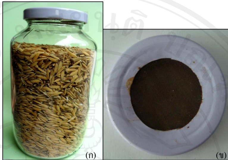
ภาพ 3.2 (ก) ขวดโหลแก้วมีฝาปิดเป็นตาข่ายถี่ ขนาดบรรจุ 500 มิลลิลิตรเพื่อใช้เลี้ยงแมลง (ข) ฝาปิดเป็นตาข่ายถี่

นำมอดหัวป้อมตัวเต็มวัยมาเพาะเลี้ยงด้วยข้าวเปลือกโดยนำข้าวเปลือกมาแช่ในตู้แช่แข็งที่อุณหภูมิ -20 องศาเซลเซียส นาน 24 ชั่วโมง เพื่อกำจัดแมลงอื่น ๆ ที่อาจปนเปื้อนมากับข้าวเปลือกก่อนนำมาเลี้ยงมอดหัวป้อม ข้าวเปลือกที่นำออกจากช่องแช่แข็งควรพักไว้เพื่อคลายความเย็นที่อุณหภูมิห้อง จากนั้นปรับความชื้นเมล็ดข้าวเปลือกให้มีความชื้น (moisture content) 15 เปอร์เซ็นต์ด้วยน้ำสะอาดแล้วคลุกให้ทั่ว ปิดฝาให้สนิทพักไว้ 48 ชั่วโมง ตวงข้าวเปลือกที่ปรับความชื้นแล้วใส่ลงในขวดโหล ประมาณ 3 ใน 4 ของขวด แล้วจึงปล่อยมอดหัวป้อมตัวเต็มวัยจำนวน 100 ตัวลงไป แล้วปิดฝาให้มอดหัวป้อมเจริญเติบโต และสืบพันธุ์อยู่ภายใน จากนั้นนำไปจัดวางไว้บนชั้นวางป้องกันมด และแมลงศัตรูอื่นเข้าไปรบกวนระหว่างการเพาะเลี้ยง มอดหัวป้อมจะอยู่ภายในขวดโหลนานประมาณ 5 วันเพื่อให้แมลงผสมพันธุ์ และวางไข่ จากนั้นร่อนแยกแมลงด้วยตะแกรงร้อนที่มีความถี่ช่องตะแกรงขนาด 2.5 และ 0.5 มิลลิเมตร วางซ้อนกันให้ตะแกรงร้อนขนาด 2.5 มิลลิเมตร วางอยู่ด้านบนเพื่อคัดข้าวเปลือกแล้วให้มอดหัวป้อมหล่นลงบนตะแกรงร้อนขนาด 0.5 มิลลิเมตร ซึ่งอยู่ด้านล่างพร้อมทั้งวางถาดหรือภาชนะรองพื้นเพื่อเก็บเศษผงจากการร่อน รวมทั้งไข่ของมอดหัวป้อม (ภาพ 3.3) ที่หลุดตกลงไปในระหว่างการร่อน เมื่อร่อนแยกข้าวเปลือกออกจากมอดหัวป้อมตัวเต็มวัยแล้ว นำข้าวเปลือกที่แยกได้พร้อมทั้งเศษผงต่าง ๆ ที่มีไข่ของแมลงปะปนอยู่ใส่ในขวดโหลเดิมพร้อมกับข้าวเปลือก หลังจากไข่พักเป็นตัวอ่อน (ภาพ 3.4) จะเจาะเข้าไปกัดกินภายในเมล็ดข้าวเปลือกจนกระทั่งเข้าดักแด้ (ภาพ 3.5) และเป็นตัวเต็มวัยในที่สุด ระยะจากไข่จนถึงตัวเต็มวัยใช้เวลาประมาณ 4 สัปดาห์