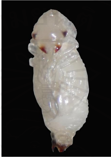
ภาพ 3.5 มอดหัวป้อมระยะดักแด้ที่ได้จากการผ่าเมล็ดข้าวเปลือก