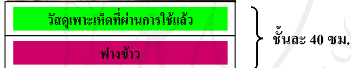
ภาพ 9 วัสดุรองพื้นคอกสุกรในแต่ละชั้น (การทดลองที่ 2)

การบันทึกข้อมูล ทำเช่นเดียวกับการทดลองที่ 1 ยกเว้นคุณสมบัติของปุ๋ยหมักในช่วงน้ำหนัก 20-60 กก. ซึ่งทำการสุ่มที่ระยะเวลาเลี้ยง 30 และ 45 วัน ส่วนในช่วงสุกรน้ำหนัก 60-90 กก. ซึ่งได้แยกเพศและย้ายมาเลี้ยงบนวัสดุรองพื้นคอกใหม่ ทำการสุ่มเก็บตัวอย่างวัสดุรองพื้นเมื่อปล่อยสุกรลงไปแล้วเป็นเวลา 30 และ 45 วัน ซึ่งในระยะ 45 วันนั้น เป็นระยะที่จับสุกรออกไปแล้วประมาณ 10 วัน ทั้งนี้การสุ่มเก็บตัวอย่างและวิเคราะห์ทางห้องปฏิบัติการ ทำเช่นเดียวกับการทดลองที่ 1 ดังได้กล่าวแล้ว