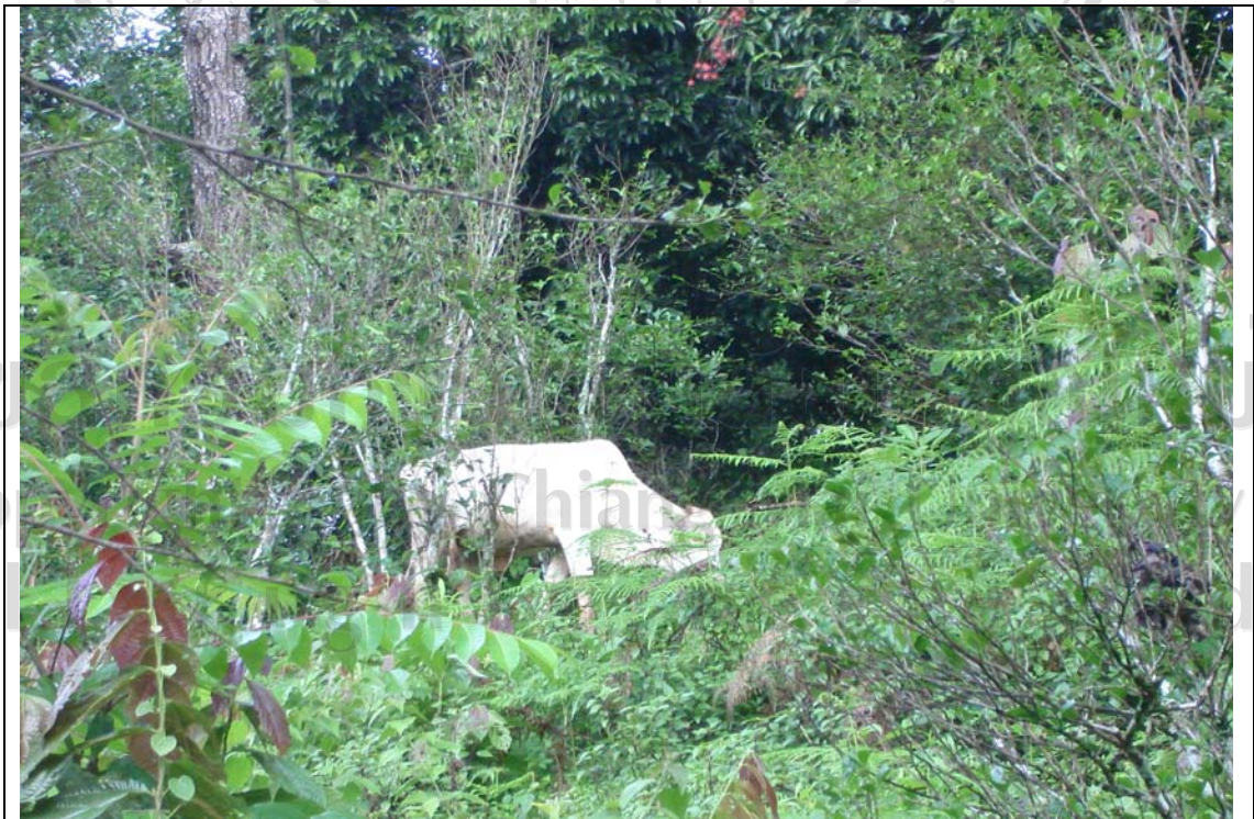
ภาพ 5.2 วัวที่เลี้ยงแบบปล่อยในป่าเมี่ยง บ้านป่าแป๋

บ้านแม่กำปอง และขุนลาว ซึ่งอยู่ในเขตอุทยานแห่งชาติด้วยกันทั้ง 2 หมู่บ้าน ซึ่งน่าจะมีความเข้มงวดในการใช้ประโยชน์และการอนุรักษ์ทรัพยากรธรรมชาติมากกว่า แต่พบว่าบ้านขุนลาวได้คะแนนเฉลี่ยของทุกกิจกรรมน้อยที่สุดเมื่อเปรียบเทียบกับ 4 หมู่บ้าน เนื่องจากบ้านขุนลาวไม่พบว่ามีการเลี้ยงวัวควายปล่อยในป่าเมี่ยงเลย ที่เป็นเช่นนี้ชาวบ้านให้เหตุผลว่าในปัจจุบันมีการปลูกกาแฟกันมากขึ้น วัวควายที่เลี้ยงปล่อยจะไปกัดกินและเหยียบย่ำต้นกาแฟของเพื่อนบ้าน คนที่เลี้ยงวัวควายจึงลดลงและหายไปมากที่สุด นอกจากนี้บ้านขุนลาวยังมีการตัดต้นไม้ใหญ่ทั้งต้นเพื่อทำฟืน ซึ่งต่างจากบ้านแม่กำปองที่การตัดไม้เพื่อทำฟืนนั้นชาวบ้านจะตัดเฉพาะกิ่งก้านของไม้ใหญ่หรือตัดฟันต้นไม้ที่ยืนต้นตายหรือเกือบถึงไม้แห่งเท่านั้น อีกทั้งมีกฎระเบียบของหมู่บ้านที่เข้มงวดเกี่ยวกับการตัดต้นไม้ โดยเฉพาะการตัดไม้เพื่อนำมาสร้างบ้านต้องมีการแจ้งให้คณะกรรมการหมู่บ้านและเจ้าหน้าที่รักษาป่าไม้ทราบก่อนทุกครั้ง แม้ต้นไม้ที่จะตัดนั้นอยู่ในพื้นที่สวนเมี่ยงของตนก็ตาม บ้านแม่กำปองจึงได้คะแนนในหัวข้อนี้มากที่สุด นอกจากนี้หัวข้อที่ทำให้บ้านขุนลาวได้คะแนนเฉลี่ยทุกกิจกรรมน้อยเนื่องจากเป็นหมู่บ้านเดียวที่พบว่า มีการถางพื้นที่สวนเมี่ยงเดิม เพื่อปลูกเสาวรส ซึ่งพื้นที่ของการปลูกเสาวรสได้ขยายตัวอย่างมากในช่วงปีพ.ศ.2549 ที่ผ่านมา