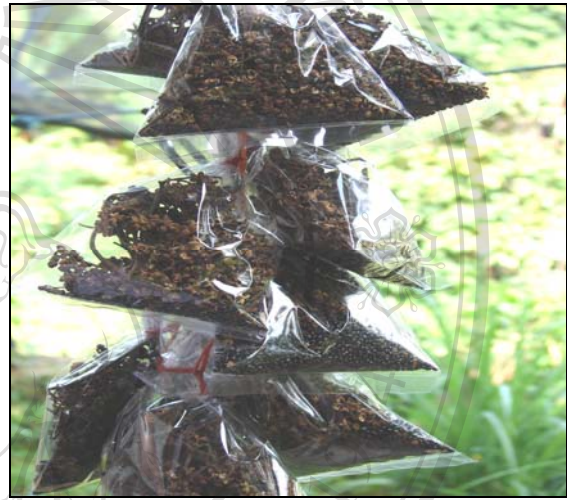
ภาพ 4.20 มะแขว่น พืชที่สร้างรายได้เสริมที่สำคัญของชาวสวนเมืองป่าแป๋และปางมะเกลือ