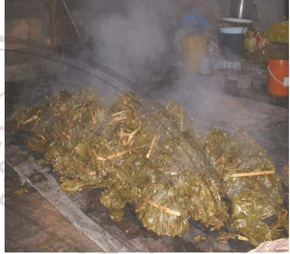
ภาพ 4.8 เมี่ยงที่นำไปนึ่งแล้ว