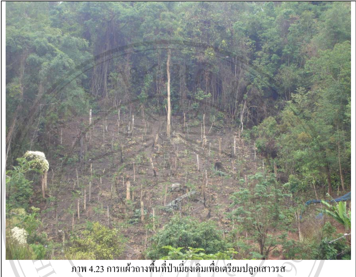
ภาพ 4.23 การแผ้วถางพื้นที่ป่าเมี่ยงเดิมเพื่อเตรียมปลูกเสาวรส