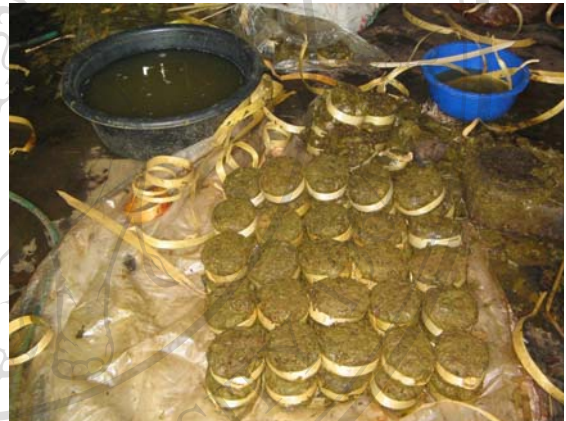
ภาพ 4.10 เมี่ยงที่จัดแต่งเรียบร้อยเพื่อเตรียมเรียงลงต่าง