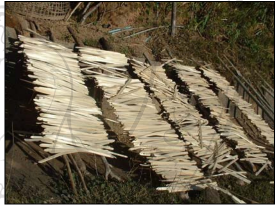
ภาพ 4.16 ตอกมัดเมียงที่นั่งสุกแล้ว