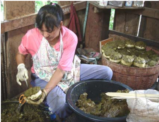
ภาพ 4.9 เมี่ยงที่นึ่งแล้วนำมาเปลี่ยนตอกมัดและจัดแต่งเป็นกำขนาดเท่าๆกัน