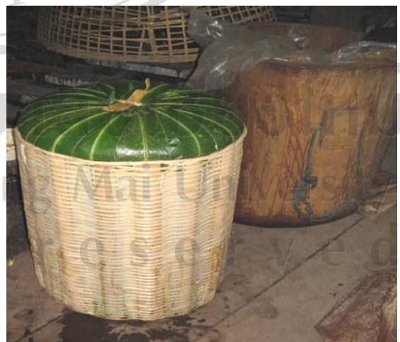
ภาพ 4.12 เมี่ยงที่จัดเรียงลงต่างพร้อมนำไปขาย