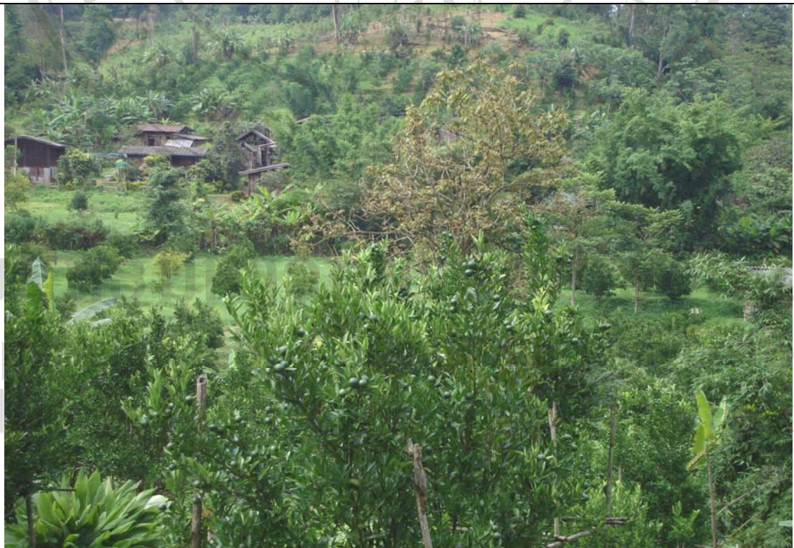
ภาพ 4.4 พื้นที่สวนเมืองเดิมซึ่งเป็นสภาพป่าธรรมชาติแต่ถูกถางเพื่อทำเป็นสวนส้ม