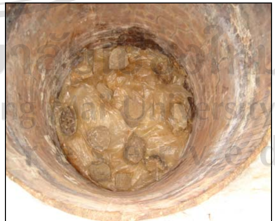
ภาพ 4.18 บ่อซีเมนต์ที่ใช้หมักเมียง(ส้ม)