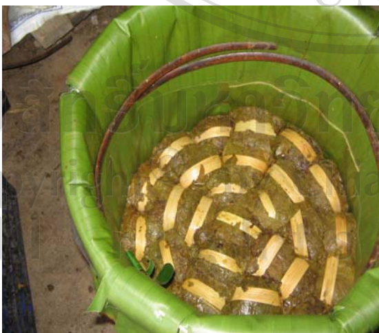
ภาพ 4.11 การจัดเรียงเมี่ยงลงต่าง ก่อนนำไปขาย