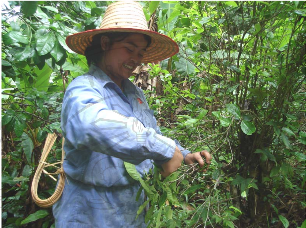
ภาพ 4.1 ชาวสวนเมืองคำดิ่งเก็บเมืองที่ป่าเมืองขุนลาว