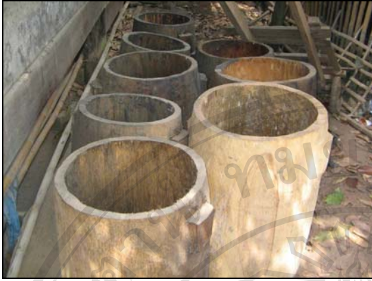
ภาพ 4.13 ไหนั่งเมียง