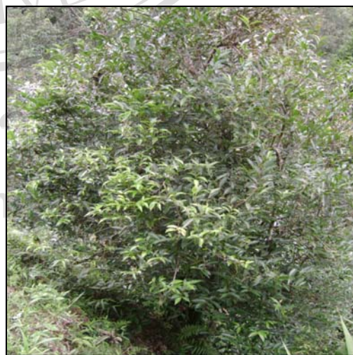
ภาพ 4.6 ต้นเมี่ยงที่โตพร้อมให้เก็บใบเมี่ยงแล้ว