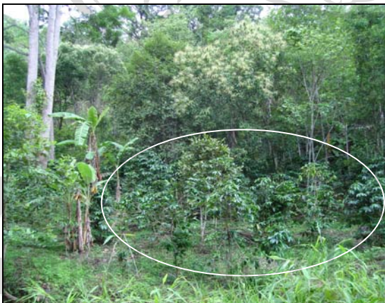
ภาพ 4.21 กาแฟ พืชที่ปลูกแซมในสวนเมือง : บ้านขุนลาว