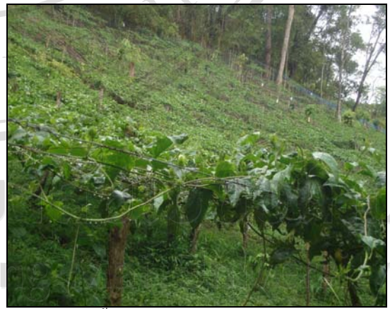
ภาพ 4.22 พื้นที่สวนเมืองเดิมที่กลายเป็นแปลงปลูกเสาวรส : บ้านขุนลาว