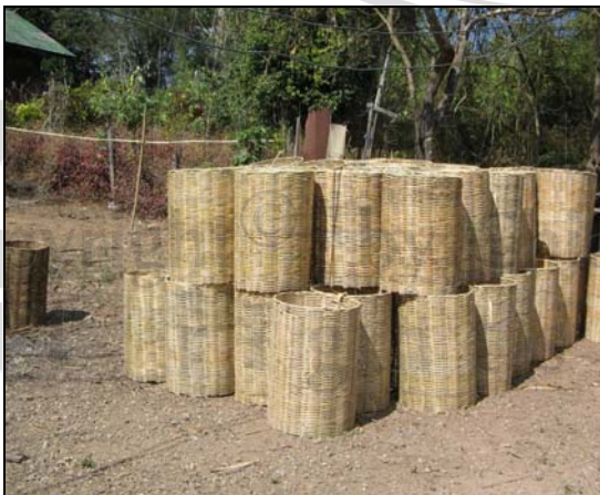
ภาพ 4.17 ทอหรือต่างใส่เมียง