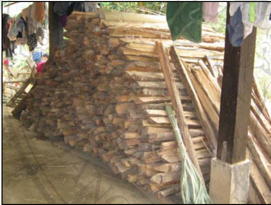
ภาพ 4.15 ฝืนสำหรับนั่งเมียง