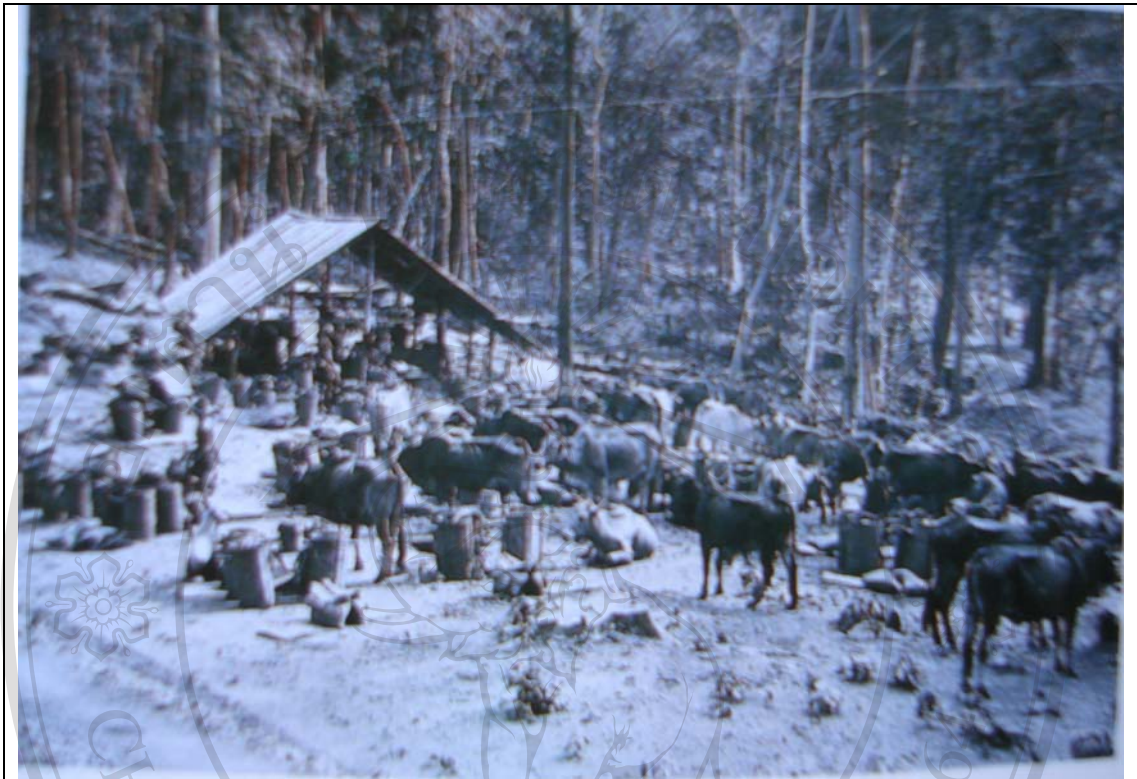
ภาพ 4.3 การรวานวัวต่าง ซึ่งเริ่มหายไปตั้งแต่ช่วงประมาณ 30 ปีที่ผ่านมา