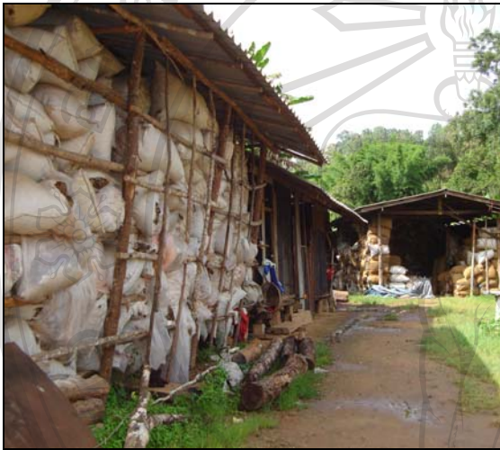
ภาพ 4.19 โรงงานรับซื้อใบชาแก่ ที่บ้านปางมะเกลือ

กาแฟ ประมาณร้อยละ 50 จะขายผลผลิตกาแฟให้โครงการหลวงติดตลก ส่วนใหญ่จะขายผลผลิตแบบสด โดยราคาจะมีการขึ้น-ลง หากนำกาแฟสดไปแกะเปลือกออกตากแห้งแล้วนำไปขายจะได้ราคาสูงขึ้นอีก 8-10 เท่าของราคากาแฟดิบ ซึ่งกาแฟดิบ 7-8 กิโลกรัม เมื่อตากแห้งแล้วขายแบบกะลาจะเหลือน้ำหนักประมาณ 1 กิโลกรัม ที่เหลือจะขายให้กับพ่อค้าในหมู่บ้านหรือพ่อค้าภายนอกที่เข้ามารับซื้อ หรือบางรายนำไปส่งร้านค้าในตัวเมืองเชียงใหม่ โดยให้เหตุผลว่าได้รับเงินสดทันที แต่ถ้าส่งโครงการหลวงได้รับเงินช้า ประมาณ 2-3 สัปดาห์หรือบางครั้ง 1-2 เดือนจึงจะได้รับเงิน