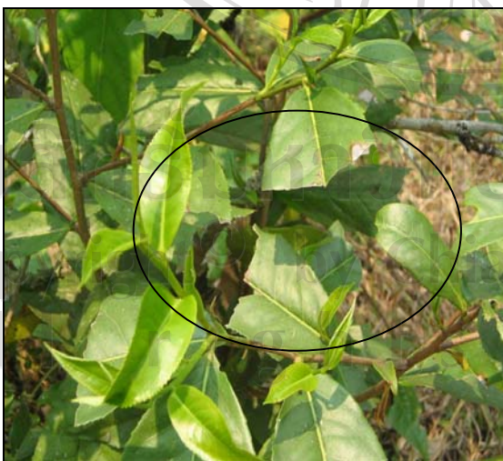
ภาพ 4.5 ใบเมี่ยงจะถูกเก็บประมาณ 2/3 ของใบ

ชาวสวนเมี่ยงในสมัยก่อนจะมีการปลูกเมี่ยงทดแทนต้นเมี่ยงที่ตายแล้วเสมอ วิธีการปลูกจะนำเมล็ดแก่ของเมี่ยงที่เก็บจากสวนไปหว่านทิ้งไว้บริเวณที่ว่างของสวน เมื่อดันกล้าเมี่ยงสูงประมาณ 1 ศอก ก็ย้ายไปปลูกในบริเวณที่ต้องการ หรืออีกวิธีหนึ่งก็คือปล่อยให้เมล็ดแก่ของเมี่ยงที่ร่วงจากต้น งอกขึ้นมาเอง และเมื่อดันกล้าสูงประมาณ 1 ศอก ก็จะนำไปปลูกในที่ว่างในสวน ซึ่งช่วงระยะเวลาการเติบโตของต้นเมี่ยงจนกระทั่งสามารถเก็บเกี่ยวผลผลิตได้ใช้เวลาประมาณ 3 ปี แต่ถ้าจะให้ได้ผลผลิตอย่างเต็มที่จะต้องรอให้ต้นเมี่ยงมีอายุ 6 ปี จากนั้นจะมีการตัดแต่งกิ่งเพื่อไม่ให้ต้นเมี่ยงสูงเกินไปและเพื่อความสะดวกในการเก็บใบเมี่ยง ซึ่งต้นที่โตเต็มที่จะให้ผลผลิตเมี่ยงประมาณ ต้นละ 5 กำ (กำหนึ่งหนักประมาณ 1 กิโลกรัม) และให้ผลผลิตเป็นชาแก่ประมาณต้นละ 3 กิโลกรัม แต่ปัจจุบันชาวบ้านไม่นิยมปลูกต้นเมี่ยงเพิ่มเติม โดยชาวบ้านให้เหตุผลว่าต้นเมี่ยงที่มีอยู่ก็ไม่มีแรงงานเก็บได้ทัน เนื่องจากไม่มีแรงงานขึ้นมารับจ้างเก็บเมี่ยงมากเหมือนสมัยก่อน การปลูกเมี่ยงจะไม่มีการใช้ปุ๋ยเคมีหรือใช้ยาปราบศัตรูพืช การเก็บเกี่ยวผลผลิตเมี่ยง สามารถแบ่งได้เป็น 4 ช่วง คือ เมี่ยงหัวปี เมี่ยงกลาง เมี่ยงช้อย และเมี่ยงเหมย