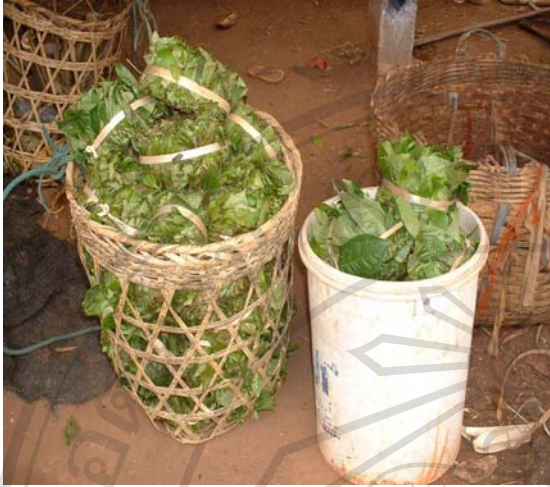
ภาพ 4.7 ใบเมี่ยงสดที่เก็บจะมัดไว้เป็นกำ

ภาพ 4.7-4.12 เป็นกระบวนการผลิตเมี่ยงฝาด ของชุมชนป่าเมี่ยงในแถบป่าแป๋ ปางมะกั่ว