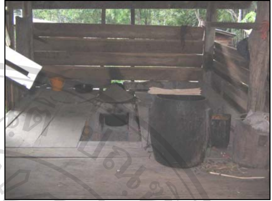
ภาพ 4.14 เตาสำหรับนั่งเมียง