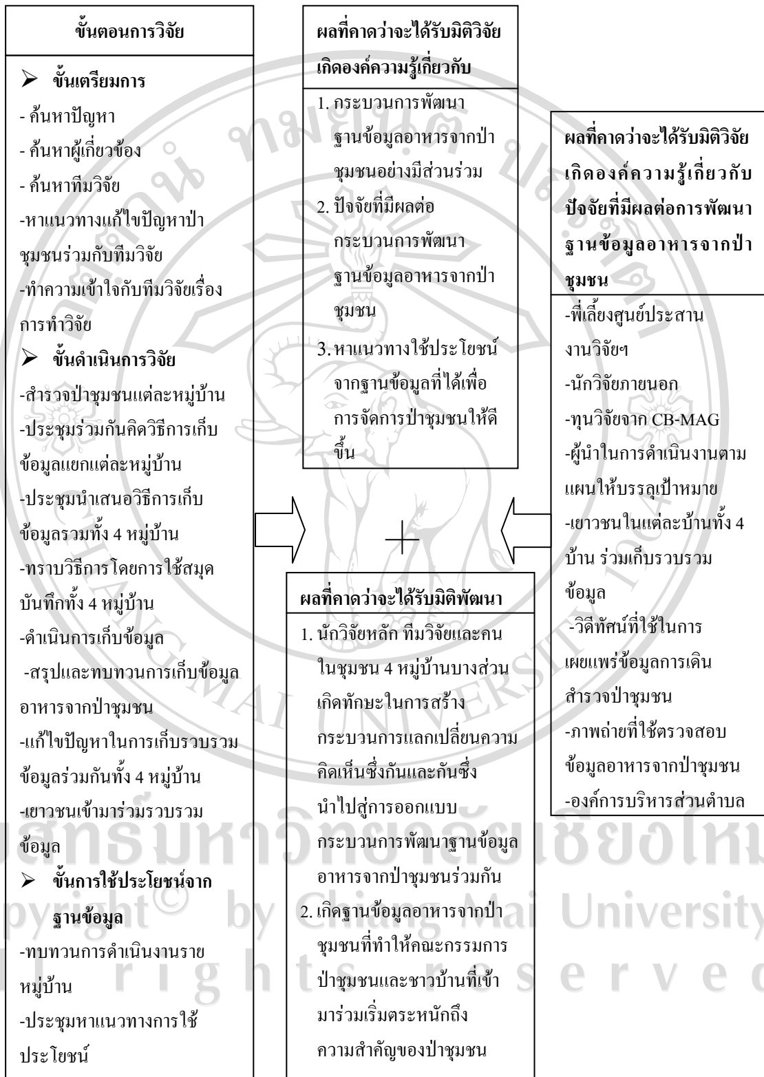
แผนภูมิที่ 2 กรอบแนวคิดการวิจัย