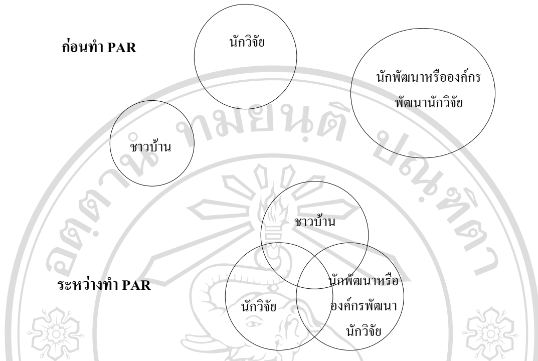
ภาพที่ 1 ความสัมพันธ์ระหว่างชาวบ้าน นักวิจัย นักพัฒนาหรือเอกชนก่อนและหลังการทำวิจัยเชิงปฏิบัติการแบบมีส่วนร่วม

จากแผนภาพดังกล่าวข้างต้นทำให้ทราบถึงการเปลี่ยนแปลงความสัมพันธ์ของผู้มีส่วนร่วมในช่วงก่อนทำและระหว่างทำการทำวิจัยเชิงปฏิบัติการแบบมีส่วนร่วมซึ่งสุกวงค์ (2531) อธิบายไว้ว่า วงกลมแต่ละวง คือ โลกทัศน์หรือวิธีการมองปัญหาของคนแต่ละกลุ่มที่เกี่ยวข้องกับการวิจัย ซึ่งวิธีการมองนี้ย่อมแตกต่างกันไปตามกรอบแนวความคิดที่แต่ละบุคคลยึดถือ ซึ่งภายหลังจากที่มีการวิจัย บุคคลทั้งสามกลุ่ม ซึ่งประกอบด้วยนักวิจัย ชาวบ้านหรือบุคคลกลุ่มเป้าหมายและนักพัฒนา จะมีความเข้าใจถึงปัญหาและความเข้าใจร่วมกันในการพัฒนาซึ่งเป็นรากฐานที่สำคัญสำหรับความสำเร็จในการพัฒนา และเป็นจุดเริ่มต้นของ โครงการต่าง ๆ ของชุมชนและปฏิบัติงานสามารถเป็นไปโดยมีประสิทธิภาพ