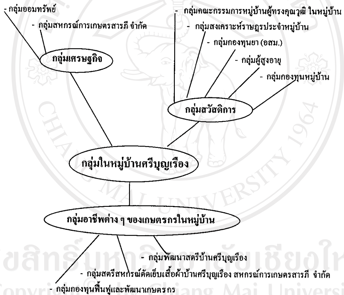
แผนภูมิที่ 3 กลุ่มและองค์กรในหมู่บ้านศรีบุญเรือง