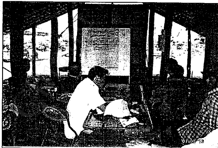
ภาพที่ 14 เกษตรกรร่วมร่างกฎระเบียบของกลุ่ม