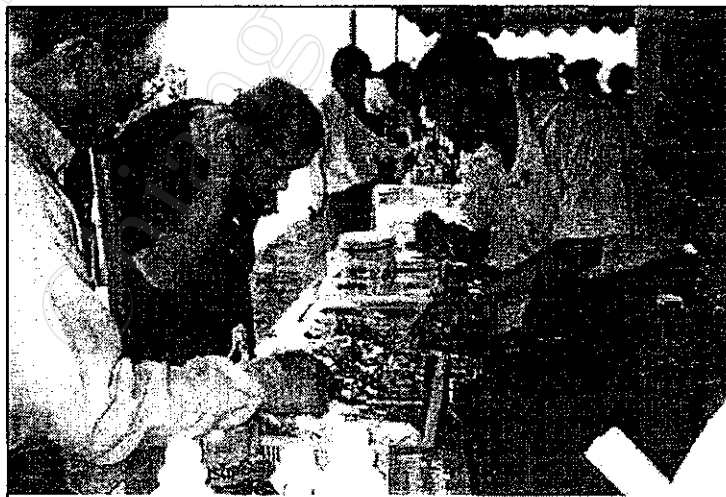
ภาพที่ 8 ผู้ว่าราชการจังหวัดสนใจในกิจกรรมนิทรรศการของศูนย์ส่งเสริมฯ