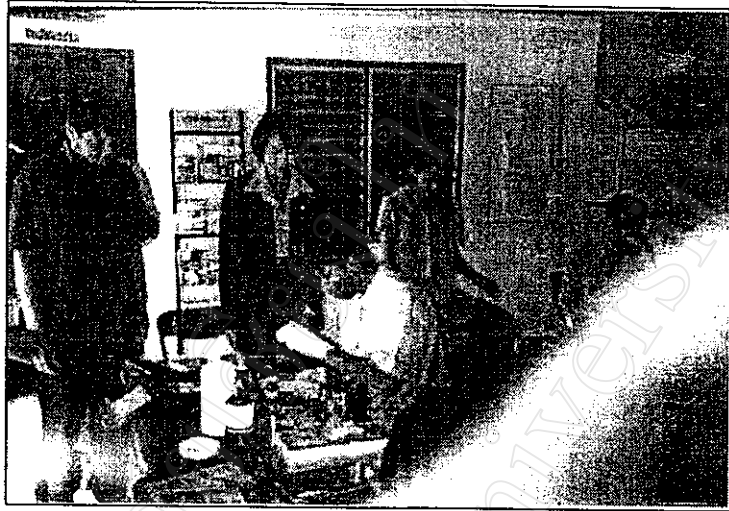
ภาพที่ 9 เจ้าหน้าที่สาธารณสุขบ้านใหม่สันมะนะให้บริการเจาะเลือดหาสารพิษ ตกค้างแก่ผู้มาร่วมงาน