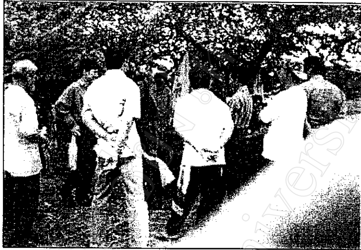
ภาพที่ 5 เกษตรกรแลกเปลี่ยนเรียนรู้ ซักถามระหว่างกลุ่มเกษตรกร