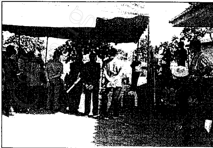
ภาพที่ 12 เกษตรกรบ้านใหม่สันมะนะสาธิตวิธีการทำปุ๋ยหมักชีวภาพจาก หอยเชอร์รี่