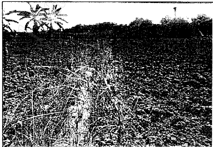
ภาพที่ 2 สารกำจัดวัชพืช สามารถปนเปื้อนได้ทั้งในดิน น้ำ และอากาศ