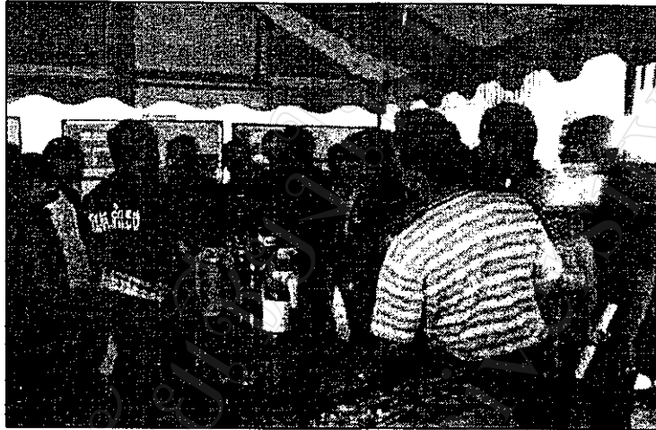
ภาพที่ 11 เกษตรกรบ้านใหม่สันมะนะแลกเปลี่ยนความรู้เกี่ยวกับปุ๋ยชีวภาพกับผู้ ที่มาร่วมงาน