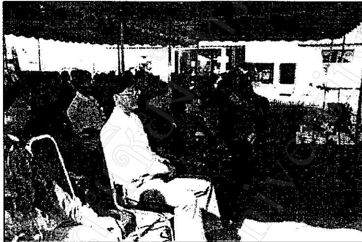
ภาพที่ 7 เจ้าหน้าที่ของรัฐ ผู้นำชุมชน เกษตรกร มีส่วนร่วมในกิจกรรมงานวัน สาริต