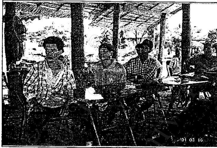
ภาพที่ 13 เกษตรกรมีส่วนร่วมในการประชุม ตัดสินใจในกิจกรรมที่เกิดขึ้น