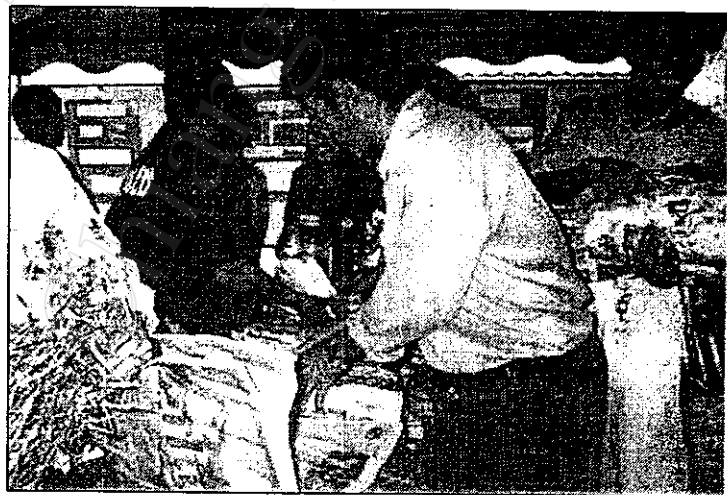
ภาพที่ 10 ผู้มาร่วมงานให้ความสนใจ และซื้อผักปลอดภัยจากสารพิษ