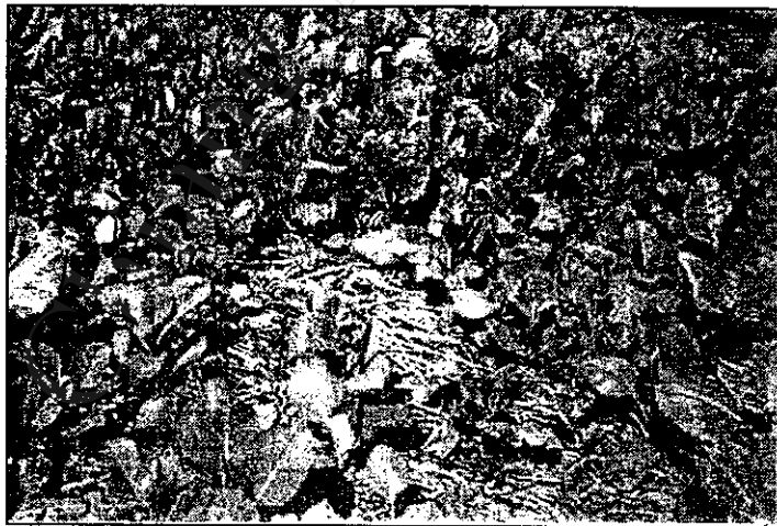
ภาพที่ 4 ต้นคะน้าที่เจริญเติบโต รอกการเก็บเกี่ยว