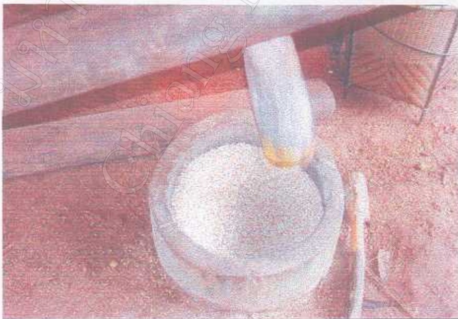
การทำข้าวเพื่อนำไปบริโภคโดยใช้ครกกระเดื่อง