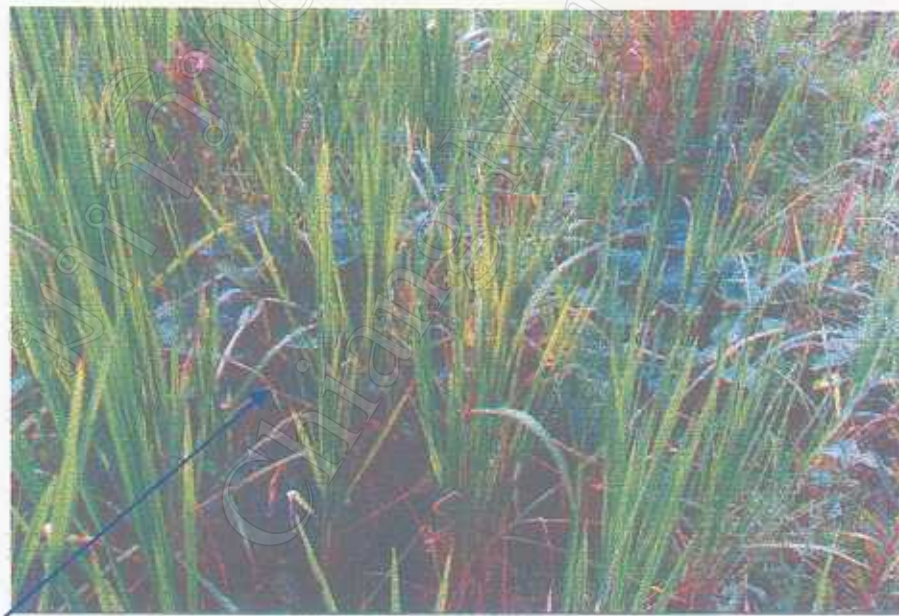
พืชที่ปลูกแซมในไร่ข้าว