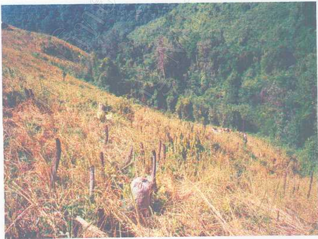
สภาพไร่ข้าวของชาวดินในบ้านหนองน่าน อ.บ่อเกลือ จ.น่าน