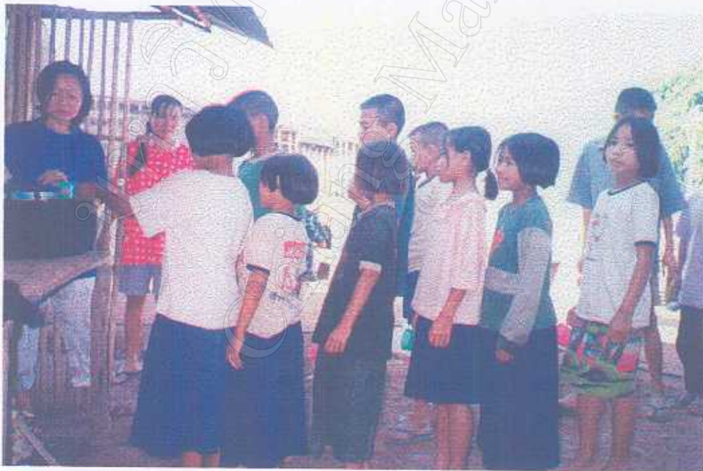
ครู ก.ศ.น. และเด็กนักเรียนชาวจีนในหมู่บ้านหนองน่าน