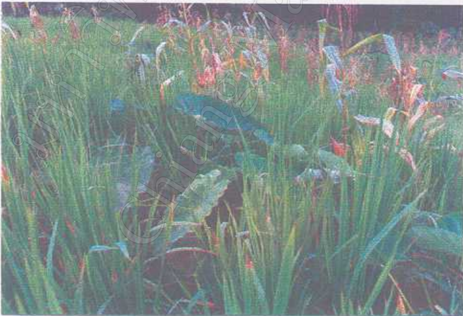
เผือกพืชที่ปลูกแซมในไร่ข้าว