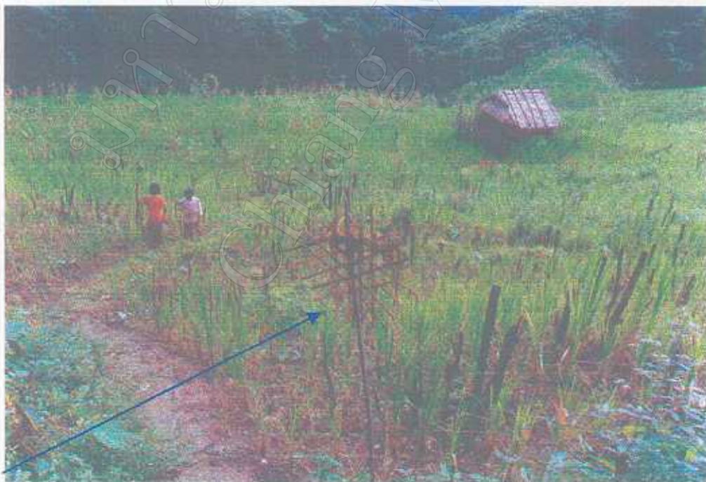
ตะแหลั่วใช้ในพิธีกรรมในไร่ข้าวของชาวลีน