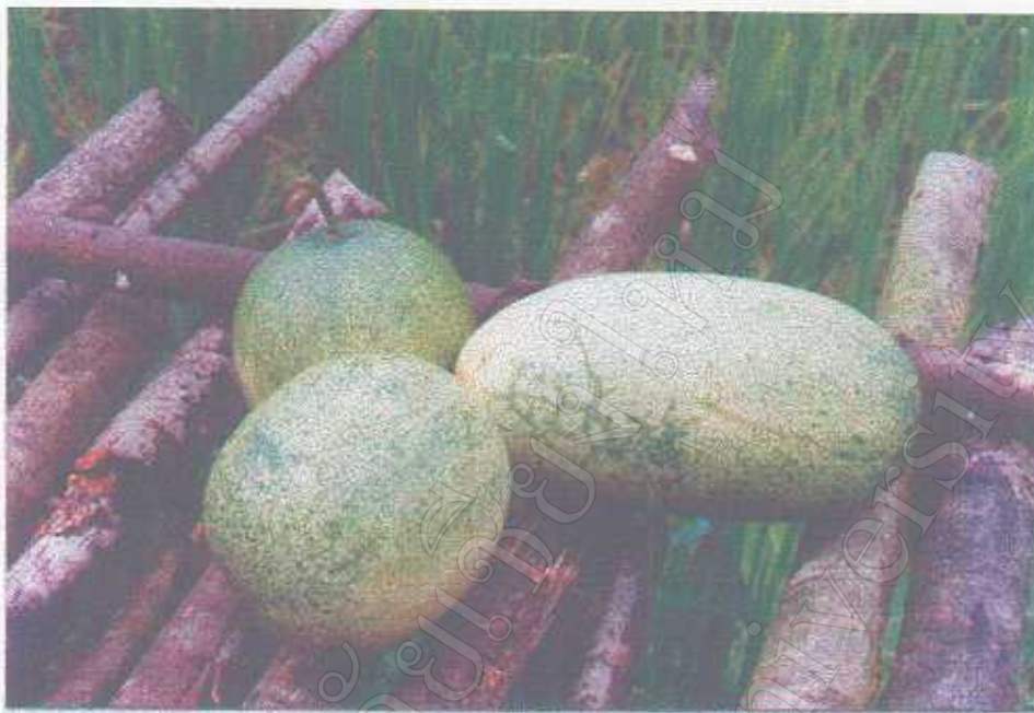
แตงกวาพีชที่ปลูกชมในไร่ข้าว