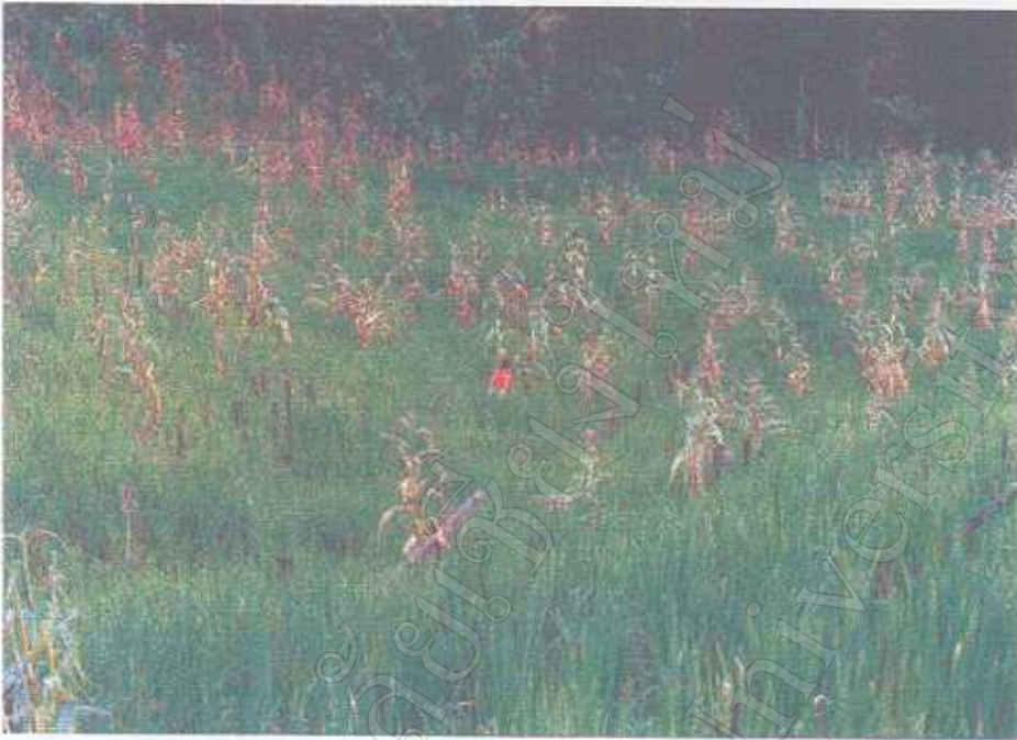
ข้าวโพดพืชที่ปลูกแซมในไร่ข้าว