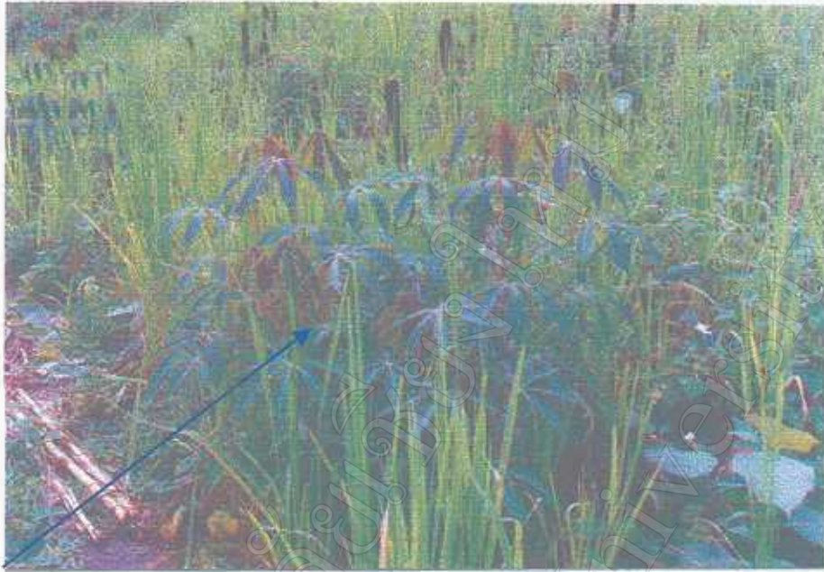
มันสำปะหลังพืชที่ปลูกแซมในไร่ข้าว