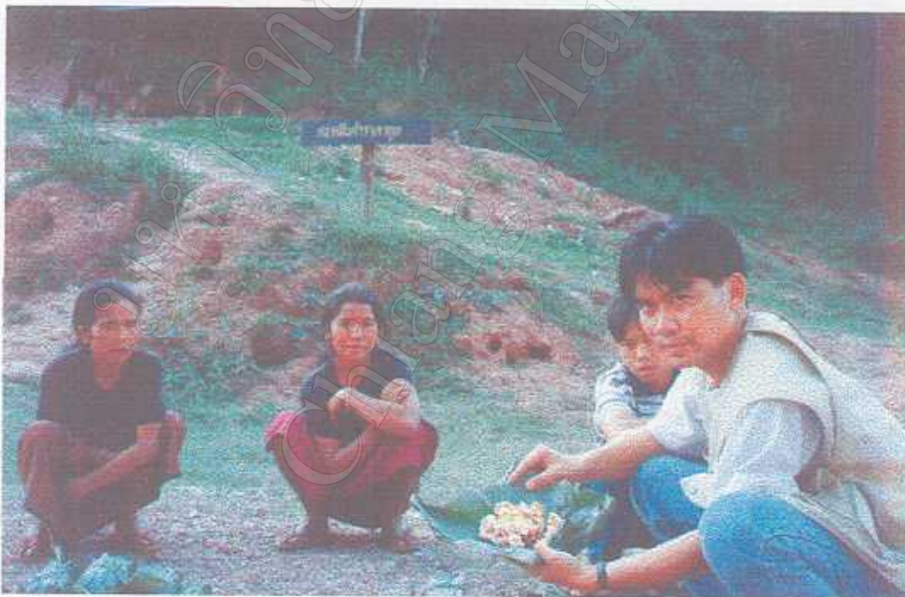
ตลาดขายของป่าของชาวกินในบ้านหนองน่าน อ.บ่อเกลือ จ.น่าน