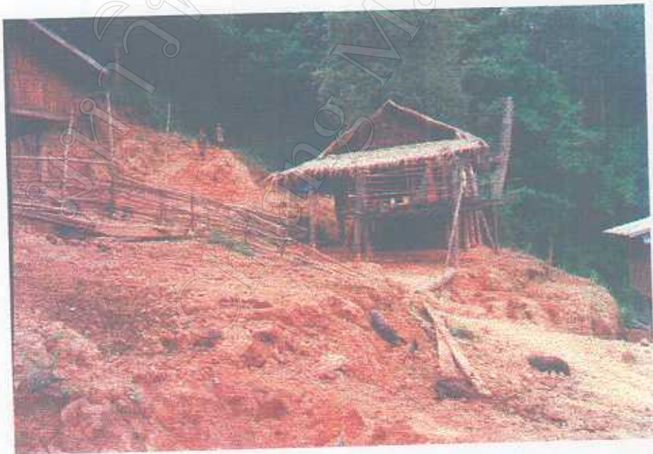
สภาพโดยทั่วไปของชาวจีน ในบ้านหนองน่าน อ.บ่อเกลือ จ.น่าน