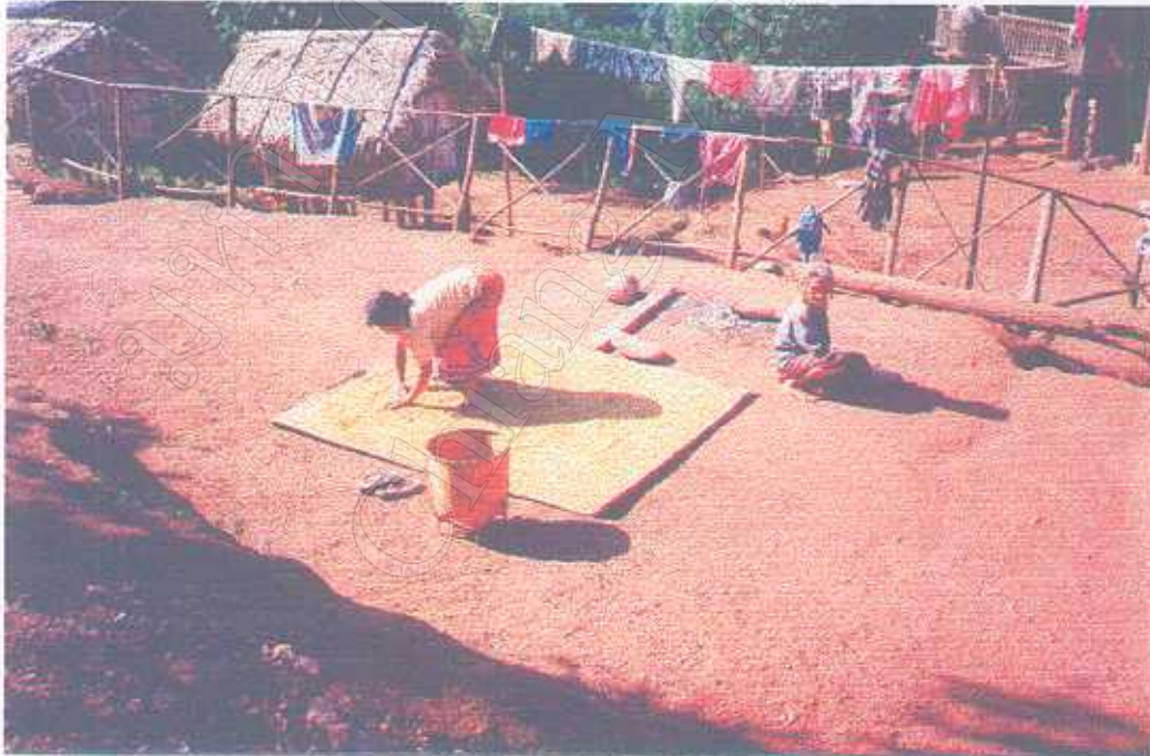
การตากข้าวของชาวดินภายในหมู่บ้านก่อนเก็บใส่ยุ้งฉาง