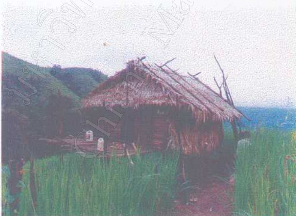
เพิงพักกลางไร่ข้าวของชาวนิน