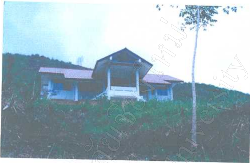
อนามัยประจำตำบลภูคา