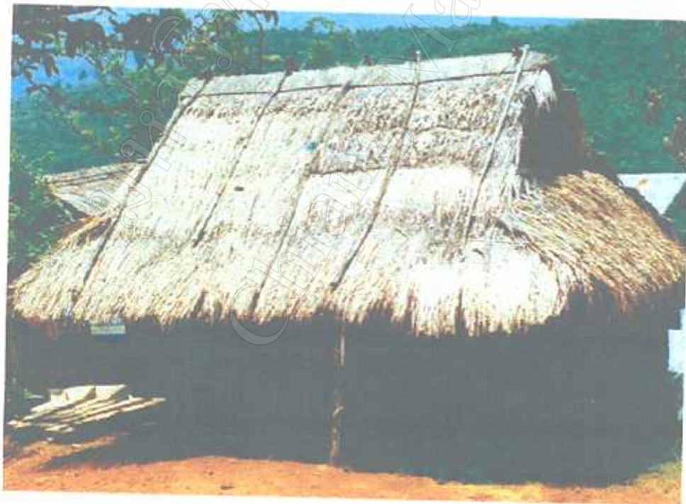
สภาพบ้านที่อยู่กันอย่างกระจัดกระจายทั่วไปในหมู่บ้าน