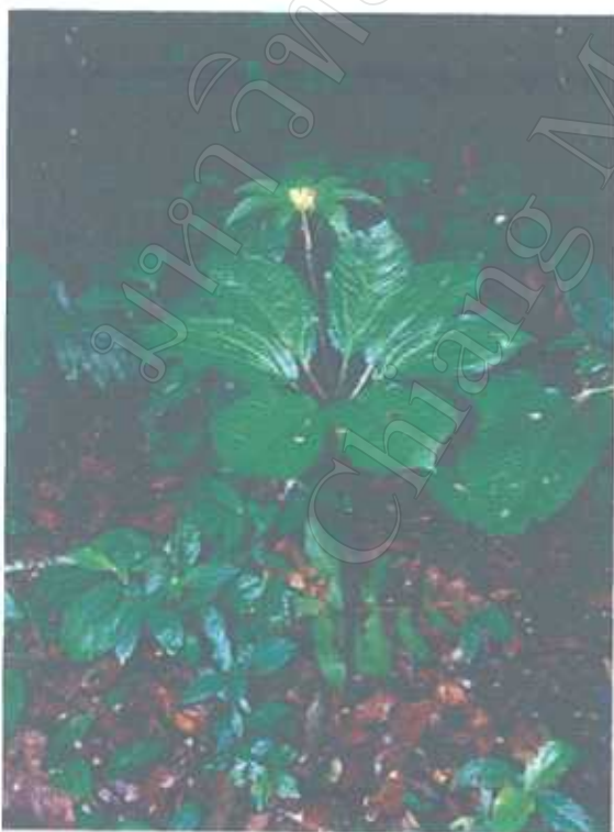
ตีนตุ๊กคอบ