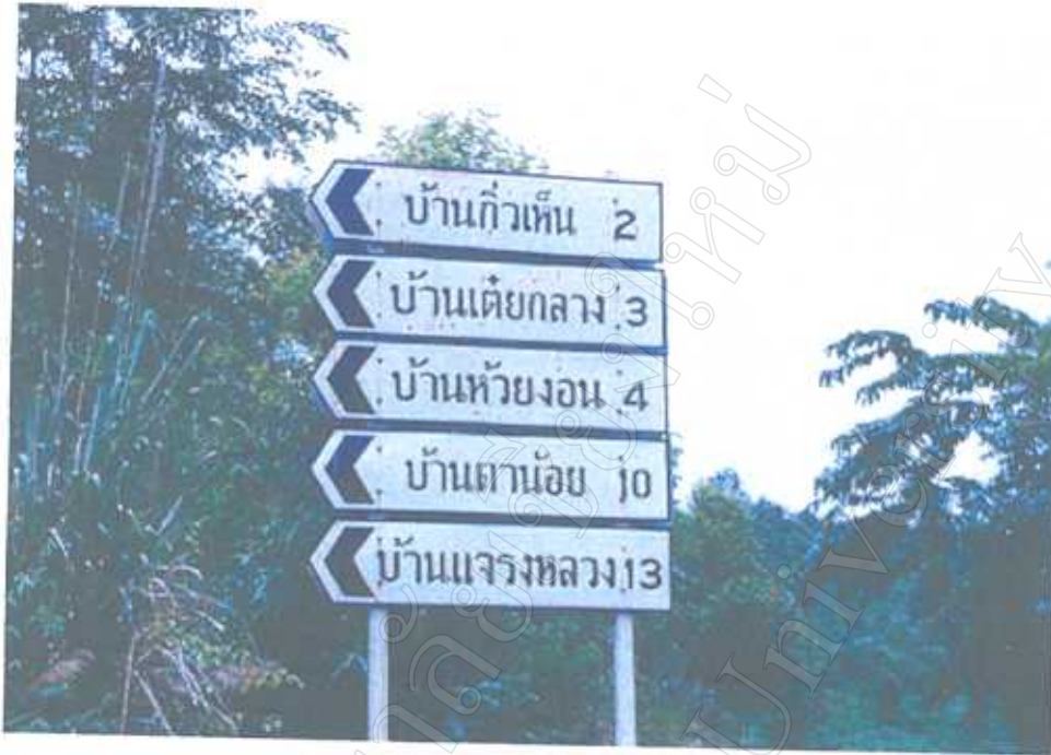
ป้ายแสดงทางเข้าหมู่บ้านเตี้ยกลาง