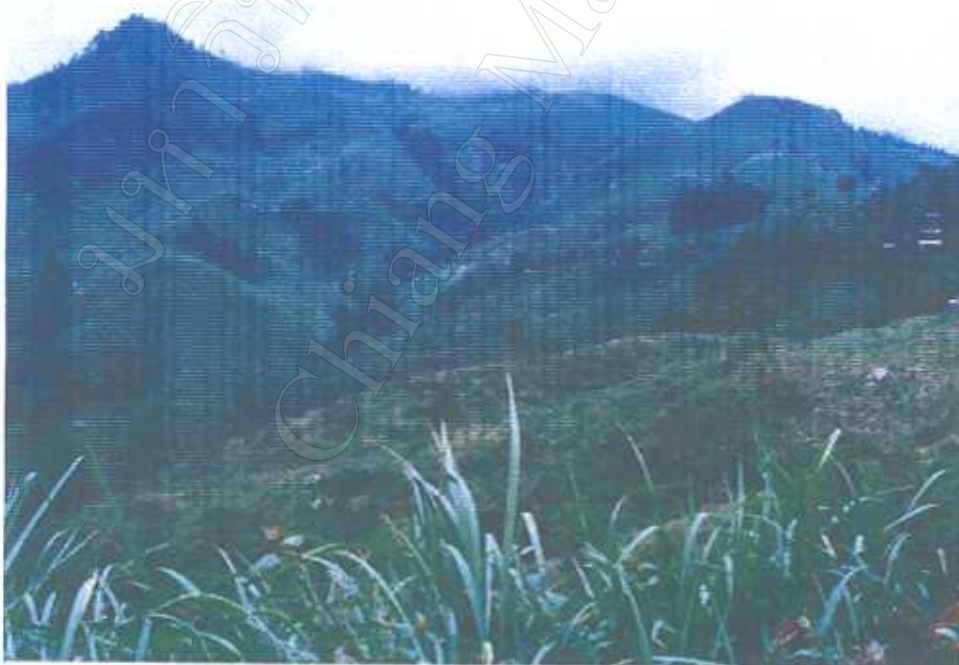
สภาพการทำไร่หมุนเวียนของชาวลัวะ