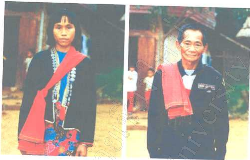
การแต่งกายของชาวลัวะ