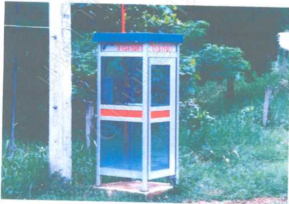
คูโทรศัพท์ที่เพิ่งติดตั้งใหม่แสดงถึงความทันสมัย