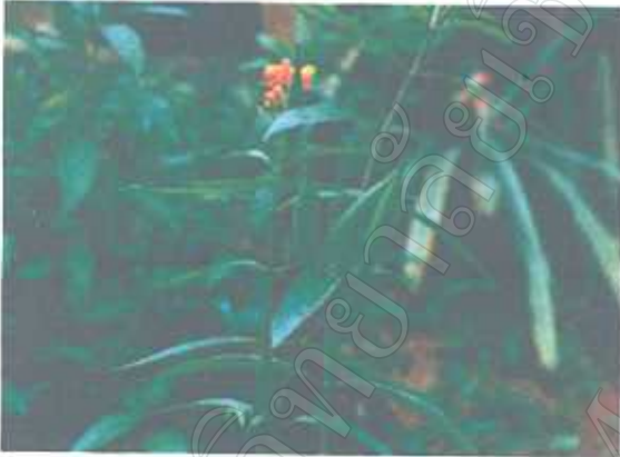
ไฟเดียนห้า