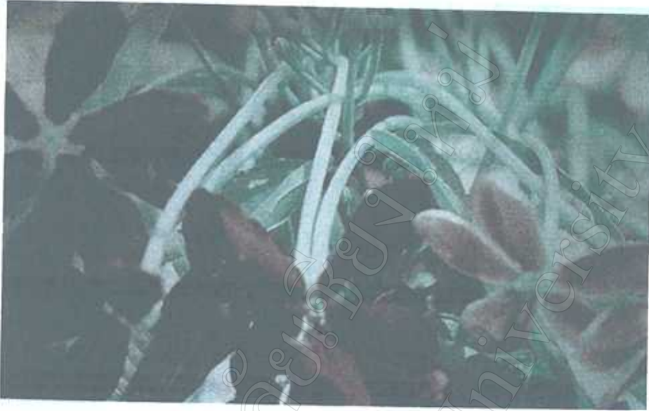
เล็บมือนาง