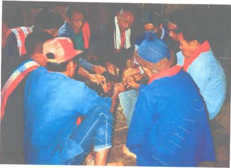
การเวียนกรวดข้าวในพิธีโลด