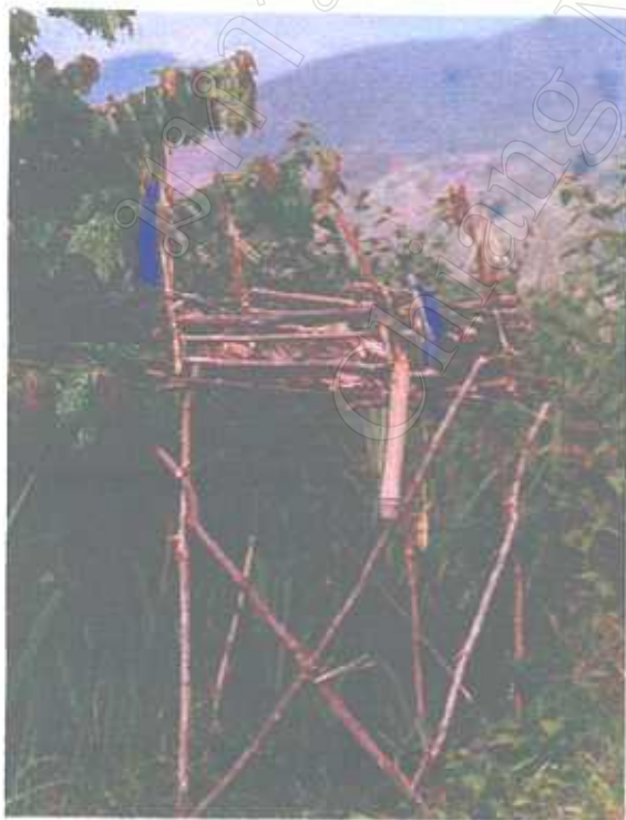
ศาลไม้ประจำหมู่บ้าน