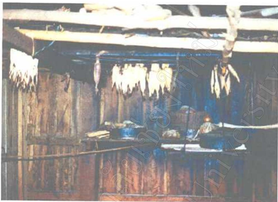
ที่เก็บอาหารเหนือเตาไฟของชาวลัวะ