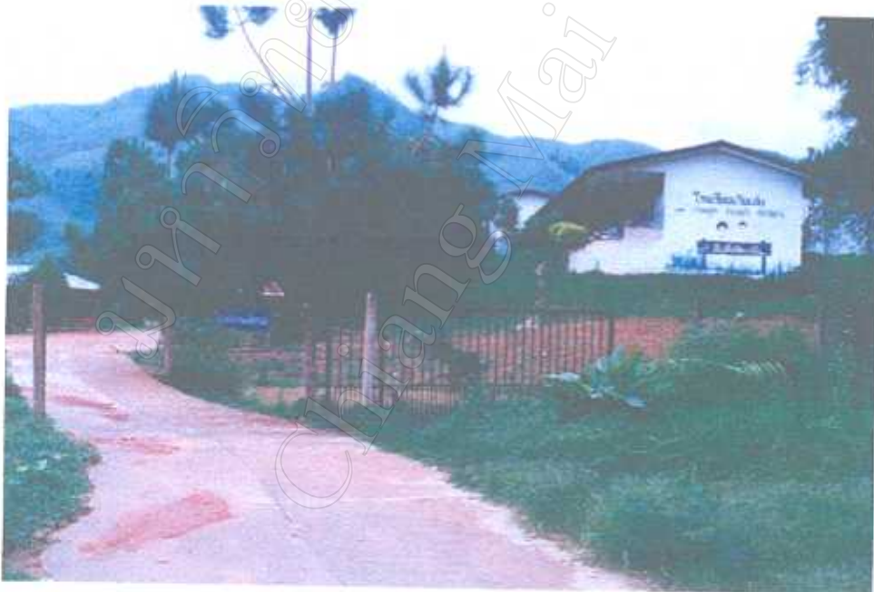
โรงเรียนในหมู่บ้านต๋อยกลางเป็นโรงเรียนขยายโอกาส