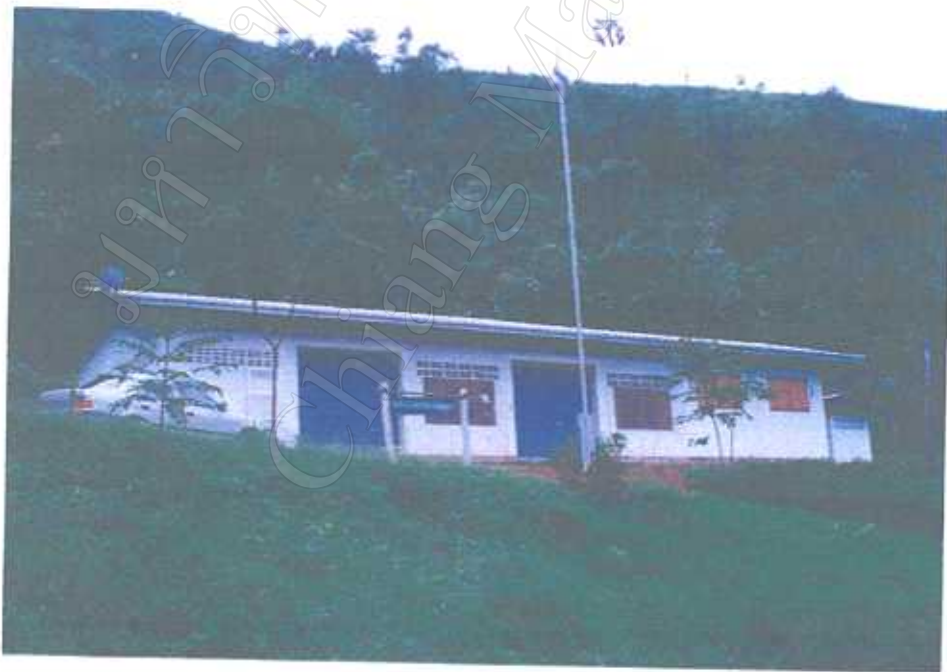
ที่ทำการองค์การบริหารส่วนตำบล (อบต.)