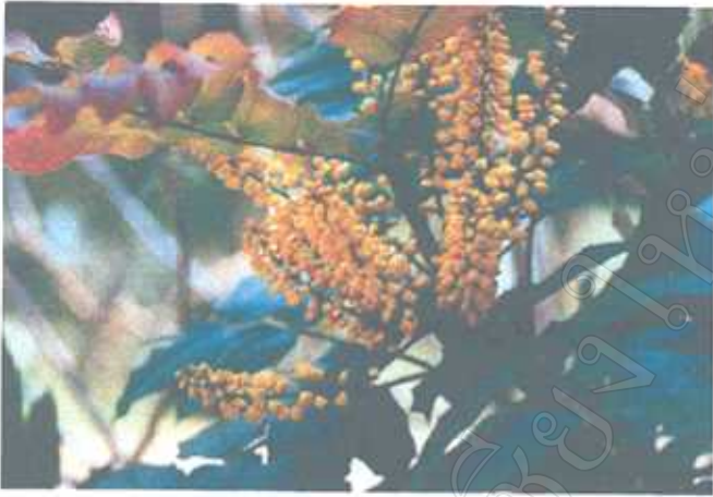
ขมิ้นต้น