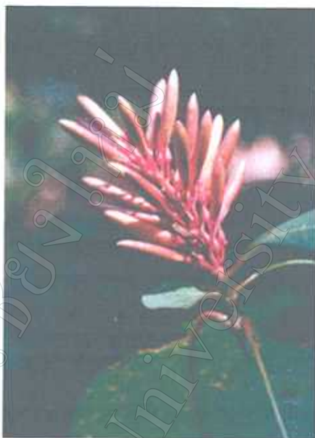
ช่อมะขาง