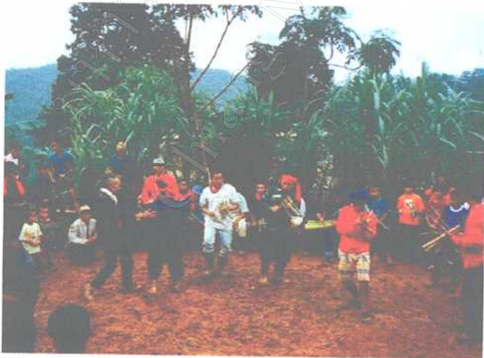
การแห่พิ ในพิธีโลด