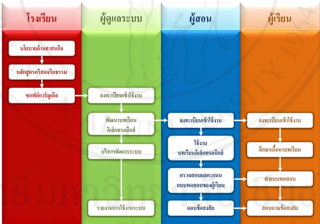
รูปที่ 3.2 แผนภาพระบบงานใหม่

จากความต้องการดังกล่าว สามารถแสดงเป็นแผนภาพระบบงานใหม่ ดังรูปที่ 3.2