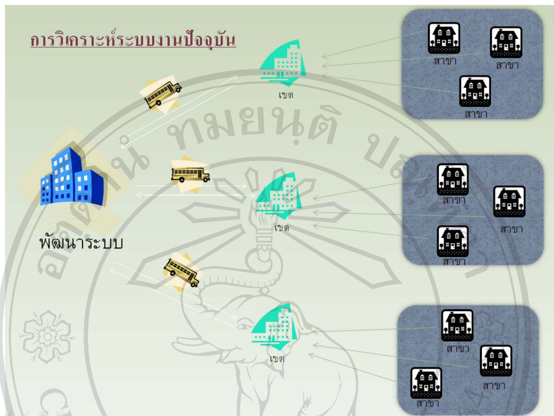
รูปที่ 3.1 การวิเคราะห์ระบบงานปัจจุบัน

จากการที่ผู้ศึกษาได้ศึกษาระบบทดสอบและประเมินผลของ บริษัท นิมซีเส็ง จำกัด ได้พบปัญหาในการทดสอบและประเมินผล ดังนี้