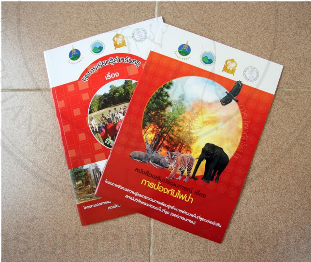
ภาพ 4.4 หนังสือเสริมประสบการณ์ชีวิต เรื่องการป้องกันไฟฟ้า

เป็นชุดการเรียนรู้ที่จัดทำขึ้น โดยโครงการจัดการความรู้และกระบวนการเรียนรู้เพื่อการพัฒนาพื้นที่สูงอย่างยั่งยืน จากการพัฒนาชุดการเรียนรู้ของ สำนักบริการวิชาการ มหาวิทยาลัยเชียงใหม่