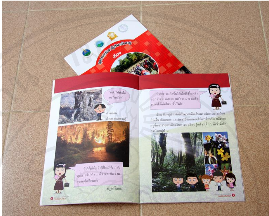
ภาพ 4.5 หนังสือเสริมประสบการณ์ชีวิต เรื่องการป้องกันไฟป่า