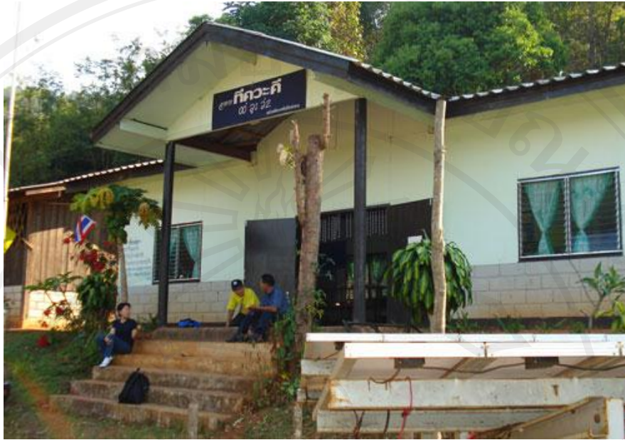
ภาพ 4.2 ศูนย์การเรียนรู้ชาวไทยภูเขา หรือ ศศช.

การคมนาคม รถยนต์สามารถเข้าถึงพื้นที่ได้ในช่วงฤดูแล้ง และจะมีปัญหา เรื่องการเดินทางในฤดูฝน ที่สภาพถนนเป็นหลุม เป็นโคลน ยากต่อการเข้าถึงและทำให้ไม่สะดวกในการขนส่งผลผลิตออกสู่ตลาด โดยมีระยะห่างจากตัวอำเภอ 25 กิโลเมตร โดยส่วนใหญ่เป็นถนนลาดยาง ในเขตเมืองเมื่อแยกเข้าหมู่บ้านจะเป็นถนนดิน และมีสภาพถนนเป็นถนนลาดยาง 18 กิโลเมตร และถนนดินอีก 7 กิโลเมตรด้วยกัน (อุทยานแห่งชาติคอยอินทนนท์, 2552)