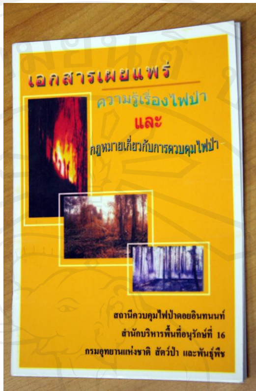
ภาพ 4.6 แผ่นพับ เรื่องความรู้ไฟฟ้าและกฎหมายเกี่ยวกับการควบคุมไฟฟ้า