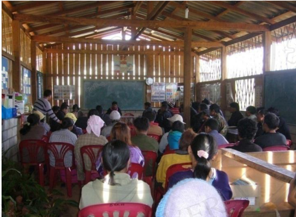
ภาพ 4.3 การเรียนรู้ในศูนย์การเรียนรู้ชาวไทยภูเขา “แม่ฟ้าหลวง”

มีการประเมิตผลระหว่างการเรียน จับกลุ่มสนทนา ออกความคิดเห็น ในหมู่ผู้เรียน ฝึกปฏิบัติจริง หรือดูการเรียนรู้จริงใน ศูนย์ ศศช. เช่น การทำปุ๋ยหมักชีวภาพ การเลี้ยงหมูหลุม การทำฝายชะลอความชุ่มชื้น การทำแนวป้องกันไฟป่า ฯลฯ ผู้เรียนจะได้ลงมือปฏิบัติทุกคน หากวันไหนไม่มีการเรียนการสอน ศศช. ก็พร้อมที่จะเป็นแหล่งเรียนรู้ให้กับเด็กและผู้ใหญ่ที่ต้องการเข้ามาเรียนรู้ได้ด้วยตัวเอง ใน ศศช.จะมีหนังสือ แผ่นพับ ป้ายนิเทศ ให้ศึกษา และทาง ศศช.ก็มีการสื่อสารระบบเสียงตามสาย เป็นการอ่านบทวิทยุที่เป็นองค์ความรู้ซึ่งจะได้ยินทั้งหมู่บ้าน หากเรื่องไหนที่ทำการสอนไปแล้ว ครูผู้สอนก็จะมีการนำกลับมาทบทวนเพื่อเตือนความจำของผู้เรียนอยู่เป็นครั้งคราว