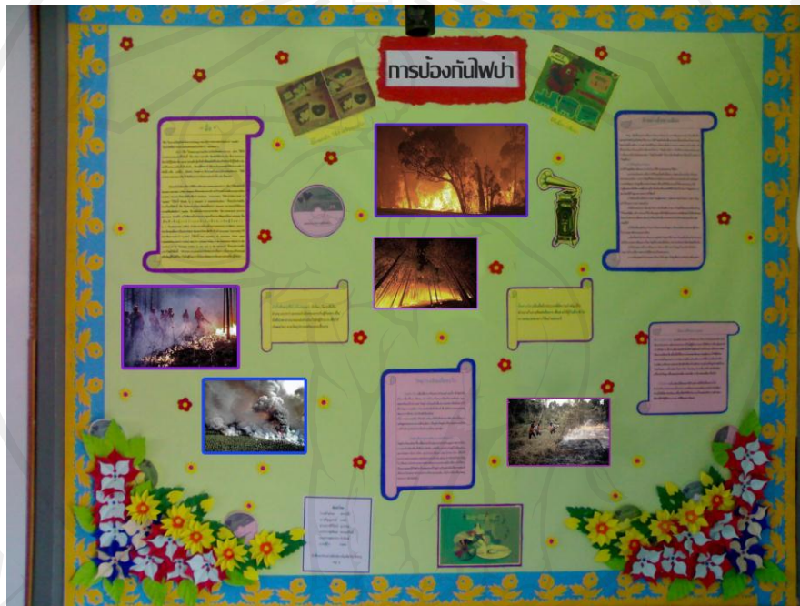
ภาพ 4.8 ป้ายนิเทศ เรื่องการป้องกันไฟฟ้า

เป็นบอร์ดจัดแสดงความรู้ เรื่องการป้องกันไฟฟ้า จัดทำขึ้นโดย ศูนย์การเรียนรู้ชุมชนชาวไทยภูเขา “แม่ฟ้าหลวง” บ้านแม่แอบใน ป้ายนิเทศเป็นสื่อทัศนวัสดุประเภทหนึ่ง ที่ทำหน้าที่เสนอเนื้อหาเพื่อถ่ายทอดความรู้และประสบการณ์ให้ผู้เรียนรู้ ด้วยรูปภาพและเนื้อหาที่สั้นกะทัดรัด โดยมีวัตถุประสงค์ให้ผู้เข้าใจเรื่องที่มาของไฟฟ้า และการป้องกันไฟฟ้า