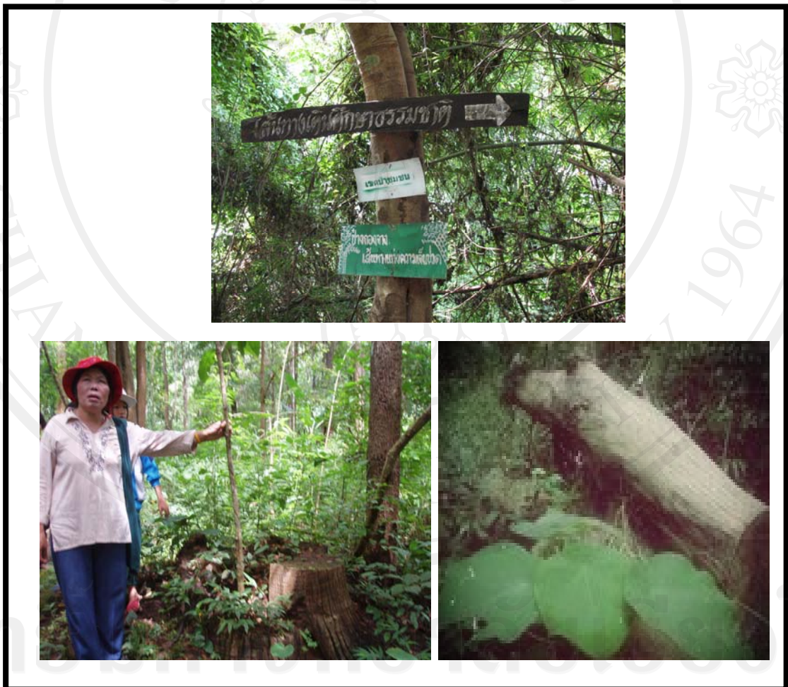
ภาพ 4.10 จุดเรียนรู้ที่ 4 การเรียนรู้เรื่องป่าสัมปทาน

ป่าสงวนแห่งชาติ พ.ศ. 2507 และได้จัดวางโครงการเป็นป่าสัมปทานไม้สักให้กับองค์การอุตสาหกรรมป่าไม้ (ออป.) เมื่อวันที่ 24 มีนาคม 2515 และจัดเป็นป่าสัมปทานไม้กระยาเลยให้กับบริษัทป่าไม้จังหวัด วันที่ 5 กันยายน พ.ศ. 2516 การอนุญาตให้มาทำไม้ในครั้งนั้นเป็นเหตุทำให้ป่าไม้บริเวณป่าดอยเชียงดาวตลอดจนป่าบ้านหัวทุ่งถูกตัดฟัน โคนล้มและถูกบุกรุกแผ้วถางหนักลงไปมาก ทั้งที่ถูกต้องและไม่ถูกต้อง การเรียนรู้ตรงจุดนี้เพื่อต้องการให้เด็กได้เรียนรู้ถึงประวัติศาสตร์ชุมชนว่า ครั้งหนึ่งป่าแห่งนี้เคยถูกทำลายจนเหลือแต่ต้นไม้สักขนาดใหญ่ให้เห็น และให้เด็กได้ลองเปรียบเทียบดูว่า ต้นไม้กว่าจะโตมาได้ขนาดนี้ต้องใช้เวลาหลายสิบปี แต่หากจะทำลายใช้เวลาแค่ไม่กี่นาทีก็ทำได้ ผลกระทบจากการตัดไม้ทำลายป่า ประโยชน์ในการช่วยกันดูแลรักษา