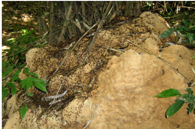
ภาพ 4.13 จุดที่ 7 การเรียนรู้เรื่องชั้น โพลง มีดแต่ไม้ลับ

จุดที่ 7 การเรียนรู้ เรื่องชั้น โพลง มีดแต่ไม้ลับ เรื่องชั้น โพลง มีดแต่ไม้ลับ จุดนี้เป็นจุดที่ต้องการให้เด็กเรียนรู้เกี่ยวกับ ระบบนิเวศการพึ่งพาอาศัยกัน เช่น จอมปลวกเวลาที่ปลวกย้ายออกไปทำรังใหม่ ก็จะมีจิ้งย้า ซึ่งเป็นแมลงชนิดหนึ่ง คล้ายผึ้งเข้ามาอาศัย ในสมัยโบราณชาวบ้านจะนำมูลของจิ้งย้ามาใช้ประโยชน์ เช่น การนำมาทำเชื้อเพลิง นำมาซ่อมกระบุง ซ่อมถังน้ำ ซ่อมเรือ เป็นต้น ทำให้เห็นว่าธรรมชาติเอื้อประโยชน์ให้กับสัตว์ที่อยู่ในป่า และคนในชุมชน ได้อย่างสมดุล