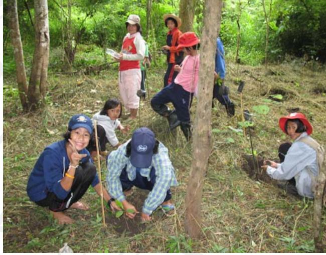
ภาพ 4.16 กิจกรรมการปลูกป่า

กิจกรรมต่างๆ ที่มีการถ่ายทอดไปสู่เยาวชนนั้น ผ่านขั้นตอนการสร้างกระบวนการเรียนรู้ให้เยาวชนได้โดย