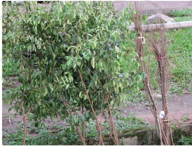
ภาพ 4.14 จุดที่ 8 การเรียนรู้เรื่องไม้ในดำนาน

นอกจากที่กล่าวมานี้ยังมีไม้ดำนานอีกหลายชนิด ที่ให้เด็กได้เรียนรู้ และศึกษาทำให้เห็นถึงความสำคัญของป่าไม้และเกิดจิตสำนึกที่ดีในการดูแลรักษาฐานทรัพยากรที่มีอยู่ให้ดีที่สุด