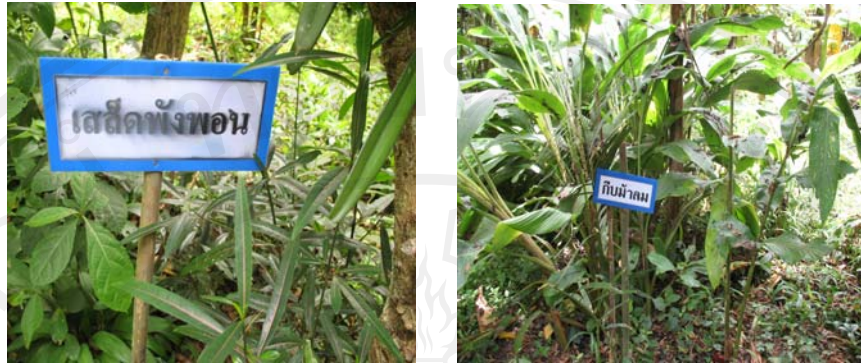
ภาพ 4.7 จุดเรียนรู้ที่ 2 การเรียนรู้เรื่องป่าสมุนไพร

จุดเรียนรู้ที่ 3 การเรียนรู้เรื่อง ป่าสี่ชั้น จุดนี้ต้องการให้เด็กเรียนรู้เกี่ยวกับระบบ