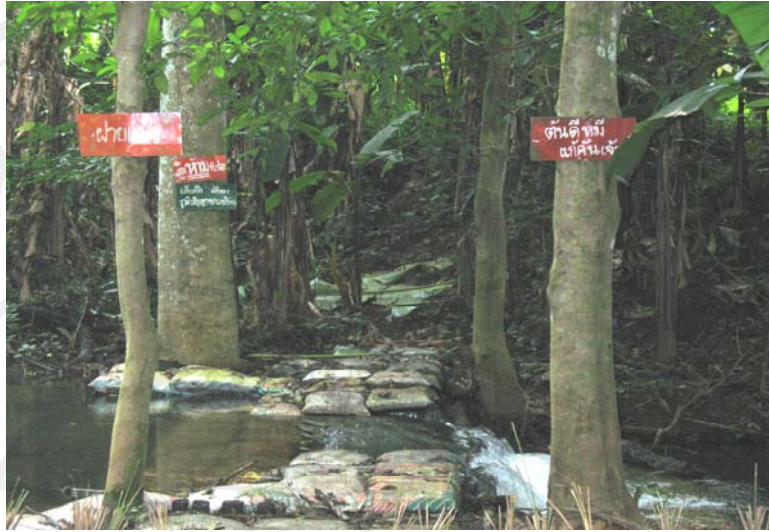
ภาพ 4.15 จุดที่ 9 การเรียนรู้ เรื่องฝายแม่ัว