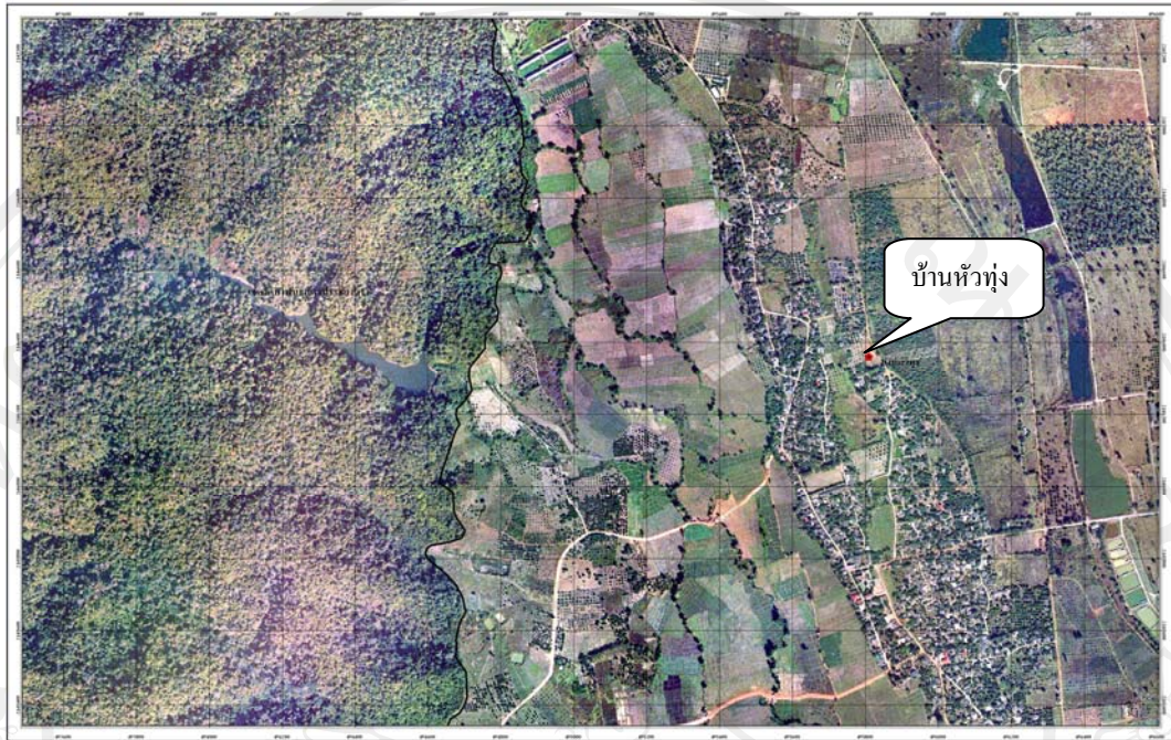
ภาพ 4.2 ภาพถ่ายทางอากาศ บ้านหัวทุ่ง ต.เชียงดาว อ.เชียงดาว จ.เชียงใหม่