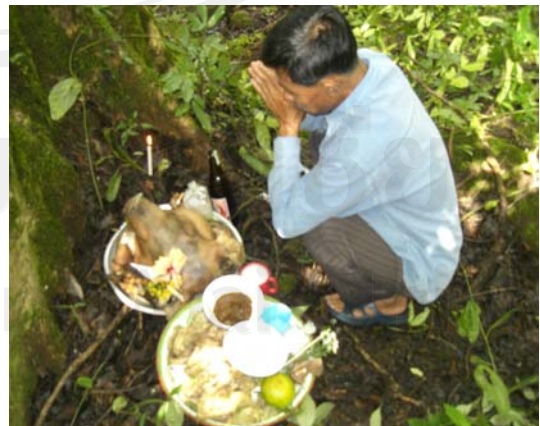
ภาพ 4.5 การประกอบพิธีกรรมเลี้ยงผีขุนน้ำของชุมชนบ้านหัวทุ่ง