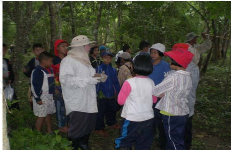
ภาพ 4.17 การให้ความรู้โดยการบอกเล่าจากผู้รู้

ขั้นที่ 1 การให้ความรู้โดยการบอกเล่าจากผู้รู้ ตามจุดฐานการเรียนรู้ ให้ตระหนักทราบคุณค่า ความสำคัญ เรียนรู้แหล่งที่มา ประวัติศาสตร์ สถานการณ์ปัจจุบัน