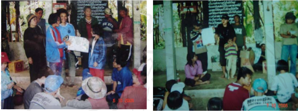
ภาพ 4. 22 เยาวชนนำเสนอผลการเรียนรู้ด้วยตนเอง

สรุปได้ว่า การถ่ายทอดภูมิปัญญาท้องถิ่นของกลุ่มสตรีผู้นำชุมชน เริ่มจากวิถีการผลิตของชุมชนบ้านหัวทุ่ง เป็นวิถีที่ผูกโยงคน ทรัพยากรธรรมชาติ สิ่งเหนือธรรมชาติเข้าด้วยกัน บนความเชื่อว่าทุกสิ่งต่างพึ่งพาอาศัยกันและกัน ก่อให้เกิดประเพณี พิธีกรรม ความเชื่อระหว่างผู้คน กับธรรมชาติสืบสานส่งต่อจากรุ่นสู่รุ่น แม้ว่าหลายอย่างไม่อาจต้านทานกาลเวลาที่ก่อให้เกิดการเปลี่ยนแปลงได้ แต่ว่าหลายอย่างยังคงมีพลังยึดโยงผู้คนให้ประพฤติปฏิบัติต่อกันอยู่ หรือบางอย่างเกิดการผสมผสานกับความรู้และวิทยาการสมัยใหม่ เพื่อให้ได้ผลที่มีประสิทธิภาพมากยิ่งขึ้น หรือบางอย่างก็ถูกรื้อฟื้นนำมาปรับใช้สถานการณ์ปัจจุบันอีกครั้ง จะเห็นว่า วิถีชีวิต วัฒนธรรมที่เป็นวิถีปฏิบัติของผู้คน ไม่ได้หยุดนิ่ง ตายตัว แต่มีการเคลื่อนไหว เลื่อนไหลและถูกรื้อฟื้นอยู่ตลอดเวลา ตามแต่สถานการณ์หรือเงื่อนไขในแต่ละช่วงเวลาและสถานการณ์นั่นเอง