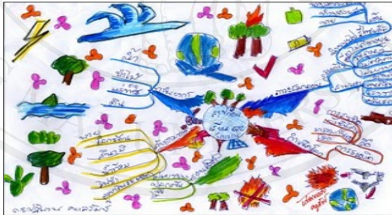
ภาพ 4.21 การทำแผนการเรียนรู้

ขั้นที่ 5 เยาวชนนำเสนอผลการเรียนรู้ด้วยตนเอง ในการนี้กลุ่มเยาวชนได้คิดค้น การนำเสนอผ่านการเล่นละคร การแสดงบทบาทสมมติ ทำให้ตัวเยาวชนเองมีความรู้ ความเข้าใจ ความตระหนักในทรัพยากรธรรมชาติและสิ่งแวดล้อม ทั้งยังเป็นการขยายความรู้สู่เยาวชนในพื้นที่ใกล้เคียงอีกด้วย