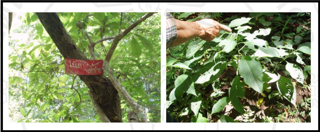
ภาพ 4.8 พืชสมุนไพร จุดเรียนรู้ที่ 3 การเรียนรู้เรื่องป่าสีเขียว

ใบไม้กิ่งไม้ที่ย่อยสลายเป็นอาหารให้กับมดปลวก หรือพวกนก หนู รวมไปถึงสัตว์ใหญ่เช่นหมูป่า กวางที่กินพืชเป็นอาหารต่างก็มีความเกี่ยวเนื่องต่อกันยกตัวอย่าง เช่น ต้นมะเขวน ต้นมะแฟน ต้นมะกอกป่า เวลาที่ นก หนู รวมไปถึงสัตว์ใหญ่ที่มากินผลของมันก็จะกินเมล็ดของต้นนั้นๆ ไปด้วย เป็นตัวนำพาเมล็ดที่ติดอยู่ข้างในท้องไปขยายพันธุ์ในที่อื่น สัตว์ที่ถ่ายออกมามูลสัตว์ก็จะ เป็นปุ๋ยสำหรับต้นกล้าที่จะงอกต่อไป”