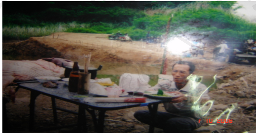
ภาพ 4.6 จุดการเรียนรู้ที่ 1 พิธีกรรมเลี้ยงผีขุนน้ำ

แล้วคนเฒ่าคนแก่ก็จะนำไม้ไผ่มาสานเป็นรูปนก กบ ปู และปลา วางไว้ เพราะชาวบ้านเชื่อว่า หากการทำแบบนี้จะเป็นการขอฝนจากเทวดา เพราะถ้าหากว่าเทวดาหรือเจ้าแม่ นางอินหลวง ไม่ปล่อยให้น้ำไหลออกมา กบ เขียด ปลา หรือสัตว์ต่างๆ ที่ต้องใช้น้ำในการอยู่รอดก็จะต้องตาย ทำให้เราเห็นว่าไม้ที่อยู่ในป่าจะไปเกี่ยวข้องกับเรื่องของการทำพิธีกรรม ความเชื่อ ประเพณี และวัฒนธรรมของชาวบ้านมาตั้งแต่อดีตเป็นต้นมา