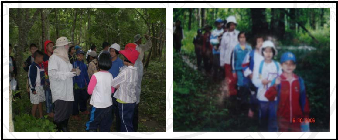
ภาพ 4.19 เยาวชนเรียนรู้ในแหล่งเรียนรู้จริงผ่านการปฏิบัติ

ขั้นที่ 3 การนำเยาวชนเรียนรู้ในแหล่งเรียนรู้จริงผ่านการปฏิบัติ เช่น การสำรวจชนิดพันธุ์พืช สมุนไพร พืชอาหาร