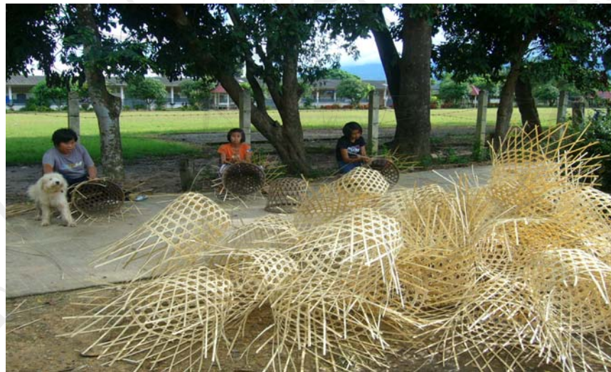
ภาพ 4.4 อาชีพสานก้วย (ตระกร้า) ของชุมชนบ้านหัวทุ่ง

เพื่อดำเนินการจัดการการใช้ไม้ไผ่บงขึ้น ภายใต้ชื่อโครงการ “ป่าไผ่เศรษฐกิจ” ซึ่งได้รับการสนับสนุนพื้นที่จำนวน 42 ไร่เพื่อใช้ในการปลูกป่าไผ่เศรษฐกิจ จากหน่วยบัญชาการทหารพัฒนา กองบัญชาการทหารสูงสุด โดยไม้ไผ่ที่ปลูกใช้เวลาในการเติบโต 6 ปี เมื่อกอไผ่เริ่มแตกกอจึงมีการตัดแจกจ่ายแก่สมาชิก โดยให้ผู้หญิงเป็นผู้ดูแลจัดการการแบ่งขนาดของไผ่ที่คละกันออกจากกัน ซึ่งผู้หญิงทุกคนเป็นผู้ดูแลกอไผ่ทุกกอจนได้กอไผ่ที่มีขนาดเท่ากัน ผลของการจัดการทำโครงการป่าเศรษฐกิจเบื้องต้นสามารถขายผลิตภัณฑ์ก้วยเพิ่มขึ้น ทั้งยังช่วยให้ครอบครัวมีรายได้เพิ่มเฉลี่ยครัวเรือนละ 4,000-5,000 บาท รายได้ของแต่ละครอบครัวอาจมากหรือน้อยขึ้นอยู่กับเวลาในการทำงานและจำนวนสมาชิกในบ้าน จากความสำเร็จของโครงการที่ผ่านมาทำให้หน่วยพัฒนาการเคลื่อนที่ 32 จัดตั้งงบประมาณเพื่อจัดซื้อเครื่องจักตอก โดยมอบเป็นทุนให้หมู่บ้านหัวทุ่งจำนวน 2 เครื่อง และให้การอนุมัติพื้นที่เพื่อใช้ในการปลูกป่าไผ่เศรษฐกิจเพิ่มอีก 104 ไร่