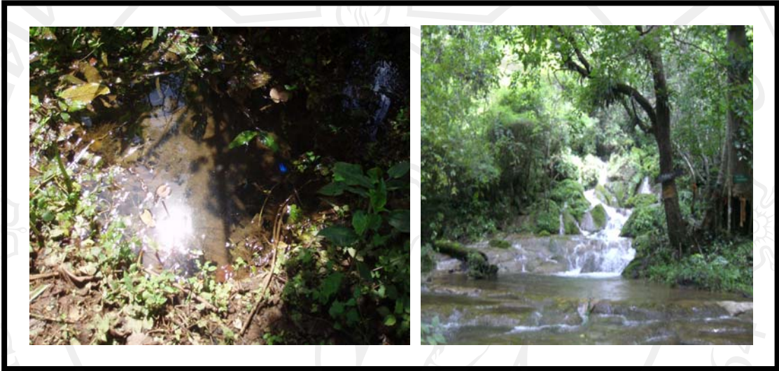
ภาพ 4.11 จุดเรียนรู้ที่ 5 การเรียนรู้เรื่องบึงน้ำซับ

และไหลไปที่ไหน และให้เห็นถึงวัฏจักรของน้ำ ที่หมุนเวียนกัน เช่น น้ำออกมาจากตาน้ำ ไหลไปรวมกับลำน้ำแม่ลู่ และไหลลงสู่แม่น้ำปิง ไหลลงสู่แม่น้ำเจ้าพระยา และไหลลงสู่ทะเล เมื่อแสงอาทิตย์สาดส่องกระทบผิวน้ำกลายเป็นไอน้ำ เป็นเมฆ ก็จะเกิดเป็นน้ำฝน ตกลงมาสร้าง ความชุ่มชื้นให้กับผืนป่าอีกครั้ง ซึ่งวัฏจักรเหล่านี้จะเกิดขึ้นได้ก็ต่อเมื่อเรามีการรักษาป่าให้อุดมสมบูรณ์อยู่เสมอ นั่นเอง