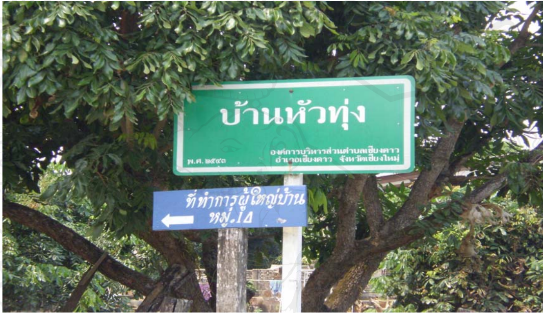
ภาพ 4.1 บ้านหัวทุ่ง หมู่ 14 ต.เชียงดาว อ.เชียงดาว จ.เชียงใหม่

บริเวณที่ตั้งของหมู่บ้านหัวทุ่ง มีความอุดมสมบูรณ์ของทรัพยากรธรรมชาติ เนื่องจากมีการตั้งชุมชนรอบป่าผืนใหญ่ทางทิศตะวันออกของคอยหลวงเชียงดาว ชาวบ้านได้ใช้ประโยชน์จากป่าในการดำรงชีวิต และมีการอนุรักษ์ป่าไม้ควบคู่กันไป จึงทำให้บริเวณป่าต้นน้ำของชุมชนหัวแม่ลูและหัวขลครแห่งนี้ยังคงความอุดมสมบูรณ์และหล่อเลี้ยงชีวิตของชาวบ้านตลอดมา