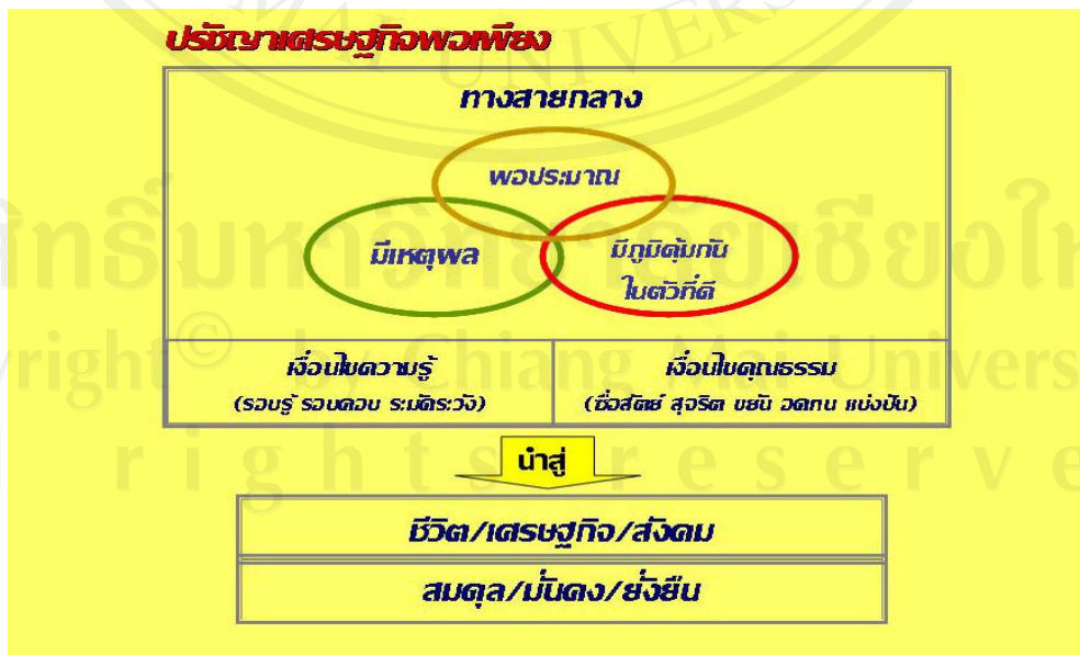
ภาพ 1 หลักปรัชญาเศรษฐกิจพอเพียง

- ระดับรัฐหรือระดับประเทศ เป็นเศรษฐกิจพอเพียงแบบก้าวหน้า เกิดขึ้นจากการรวมกลุ่มของชุมชนหลาย ๆ แห่ง ที่มีความพอเพียง มาร่วมแลกเปลี่ยนความรู้และประสบการณ์ และร่วมมือกันสร้างเป็นเครือข่ายเชื่อมโยงระหว่างชุมชน ด้วยหลักแบ่งปันและช่วยเหลือซึ่งกันและกัน จนเกิดเป็นสังคมแห่งความพอเพียง และสามารถวางนโยบายและกลยุทธ์การพัฒนาให้สังคมเจริญก้าวหน้าได้อย่างสมดุลและยั่งยืน