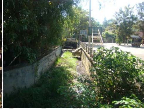
ภาพ 56 ลำเหมืองบางแห่งแห้งแล้ง