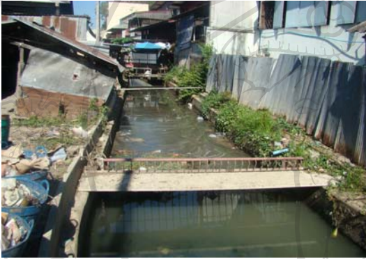
ภาพ 57 ลำเหมืองบางแห่งสกปรก