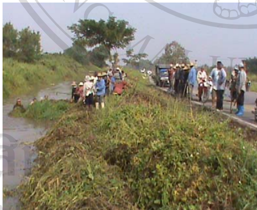
ภาพ 59 สมาชิกช่วยกันขุดลอกลำเหมือง