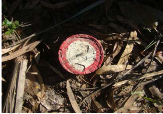
ภาพ 55 หลักระดกลำเหมืองบริเวณฝายแม่ฟ้าผ่า