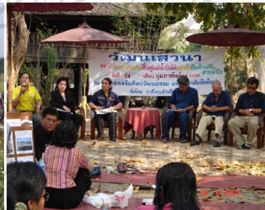
ภาพ 60 เวทีเสวนาเหมืองฝาย