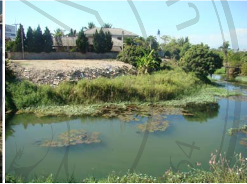
ภาพ 58 ลำเหมืองบางแห่งถูกบุกรุก